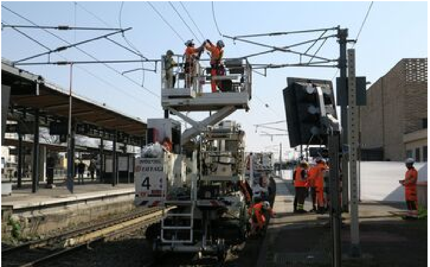
Les perturbations dans les transports d'Ile-de-France ce week-end des 13 et 14 mai