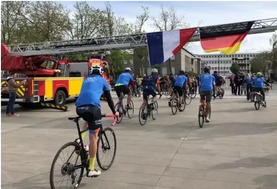
Une vingtaine de pompiers de Lorient et de Ludwigshafen ont parcouru ensemble à vélo la route de Rennes à Lorient, soit 174 kilomètres.