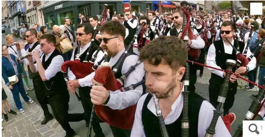
Les 40 ans du bagad de Lorient ont commencé par un défilé dans le centre-ville, dont ils ont fermé la marche derrière leurs camarades des bagadoù de tout le Morbihan.

Le bagad de Lorient (Morbihan) a fêté ses 40 ans, ce samedi 13 mai 2023, à l'occasion de la fête de la Bretagne, avec 450 sonneurs et danseurs morbihannais et des centaines de fans.