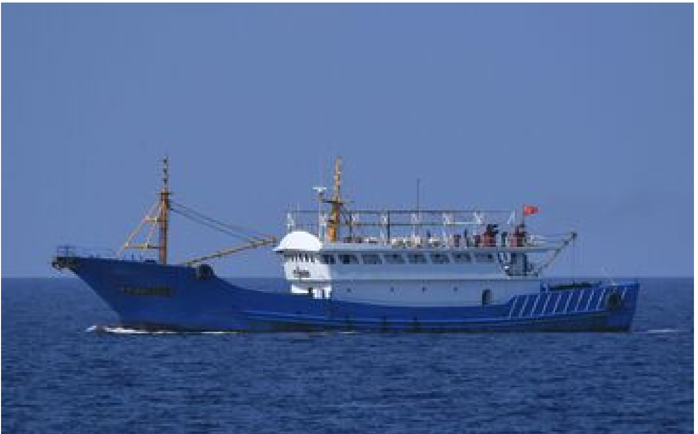
Un navire de pêche chinois chavire dans l'océan Indien, 39 personnes portées disparues