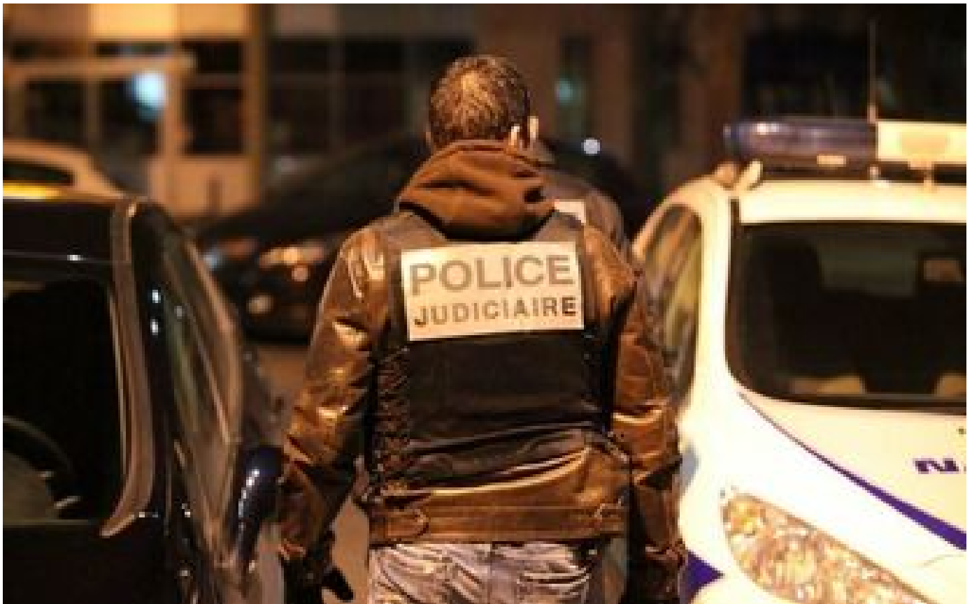
Mort d'un homme de 25 ans à Paris : « le cadavre a été retrouvé pieds et mains liées sur son lit »