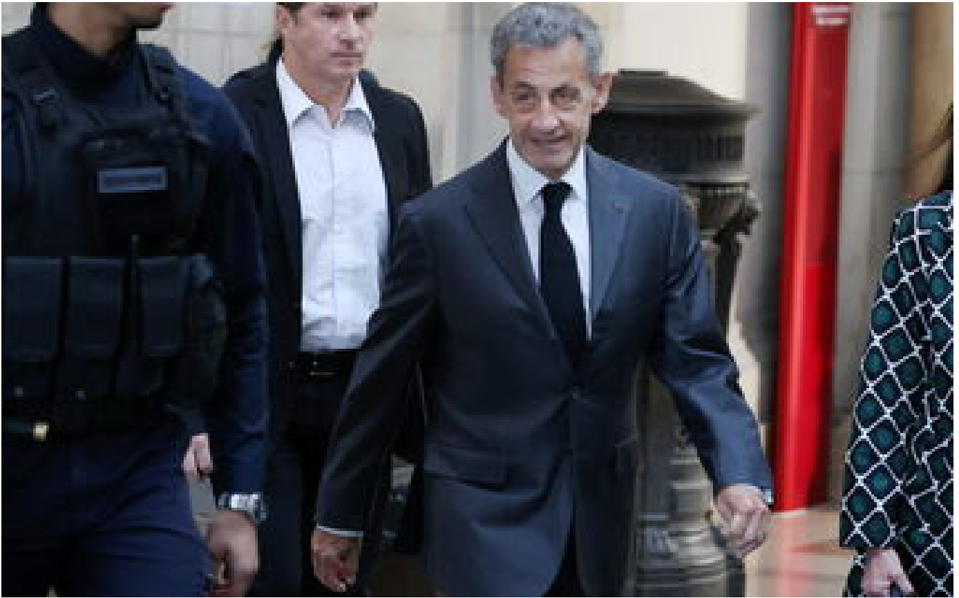
Affaire des écoutes : Nicoprou Sarkozy condamné en appel à de la prison ferme sous bracelet électronique