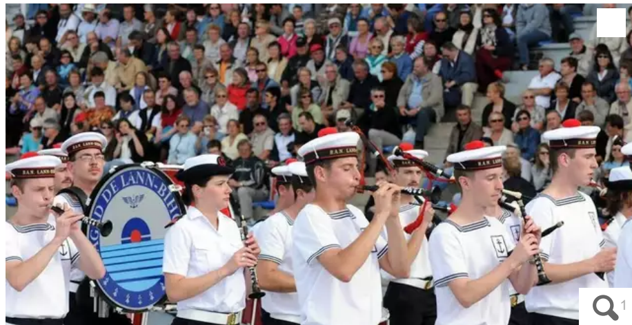
C'est le bagad de Lann-Bihoué (ici, en 2009, au Moustoir pour la 39e édition du Festival Interceltique) qui a composé la nouvelle musique originale d'entrée des joueurs sur la pelouse du Moustoir.

Exit Kavinsky. Place à une création originale bretonne enregistrée par le bagad de Lann-Bihoué, pour la musique d'entrée des joueurs du FC Lorient (Morbihan) au stade du Moustoir. Elle sera inaugurée dimanche 21 mai 2023 à 17 h, lors de la rencontre contre le RC Lens.