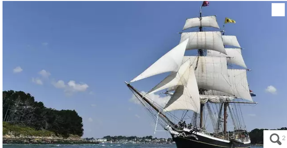
Pour sa 12e édition, la Grande parade de la Semaine du Golfe a rassemblé, une nouvelle fois, de sublimes bateaux.

Temps fort de la Semaine du Golfe, qui se déroule dans tout le golfe du Morbihan jusqu'au dimanche 21 mai 2023, la Grande parade de cette 12e édition a démarré à 15 h, ce samedi 20 mai. Revivez notre direct de l'événement, qui a rassemblé plusieurs milliers de personnes et de navires.