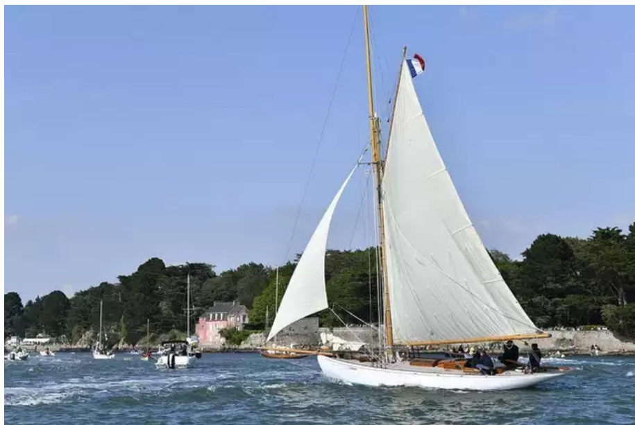
Un voilier devant la maison rose de Sené (Morbihan), à la fin de la Grande parade.