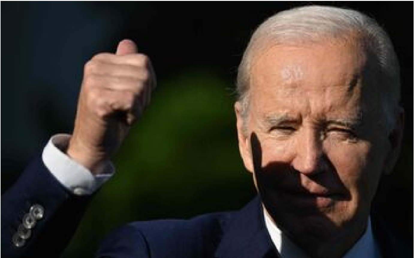
Dettes américaines : un accord bientôt possible ? Biden se dit « assez optimiste »