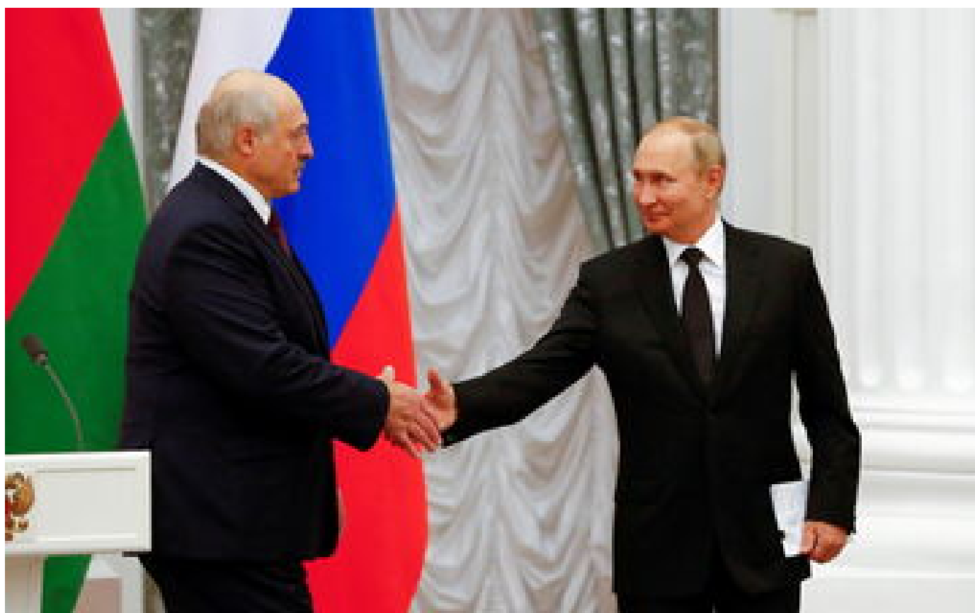
Guerre en Ukraine : faut-il s'inquiéter du déploiement d'armes nucléaires tactiques en Biélorussie ? P