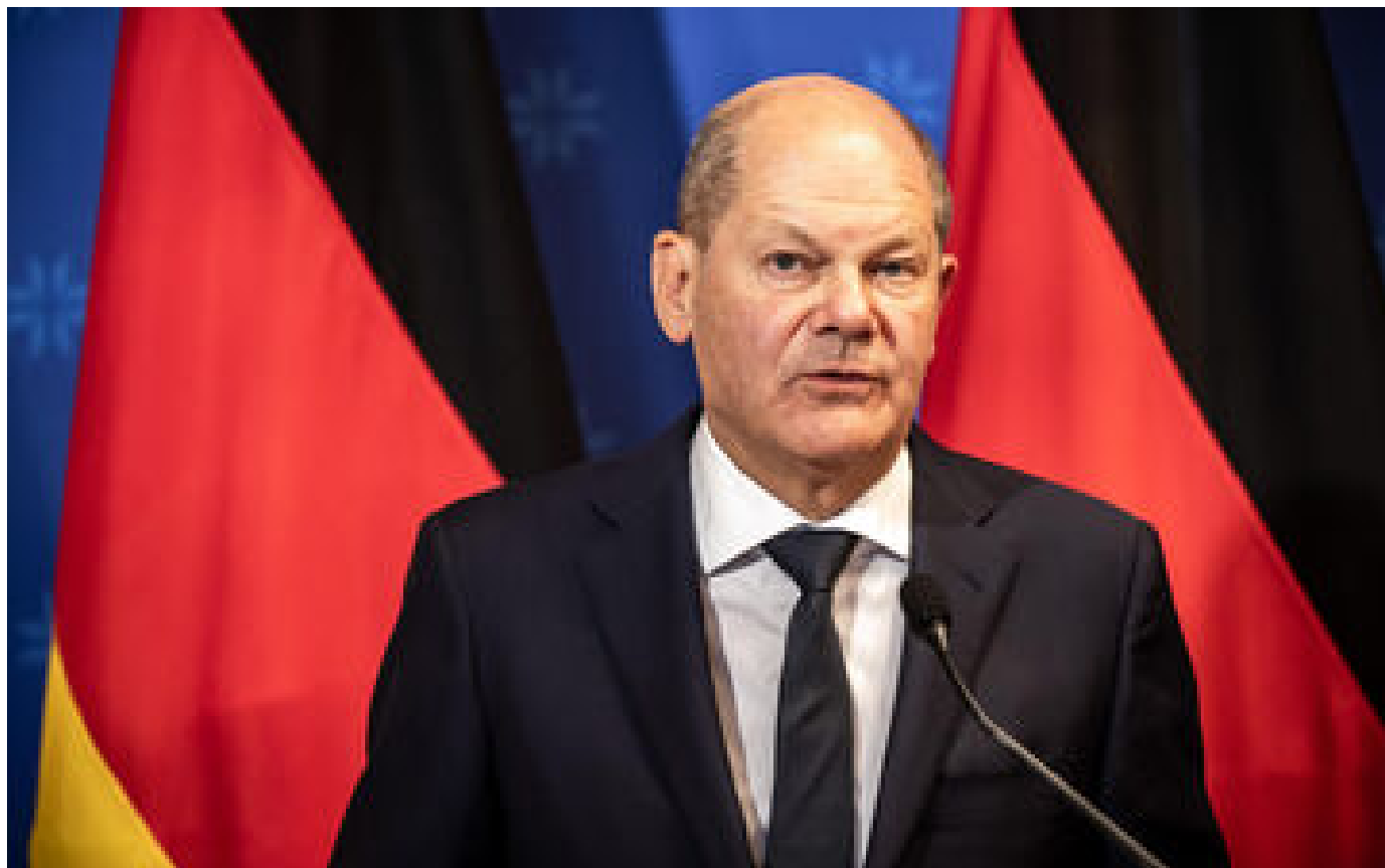
Un homme interpellé après avoir enlacé le chancelier allemand sans autorisation