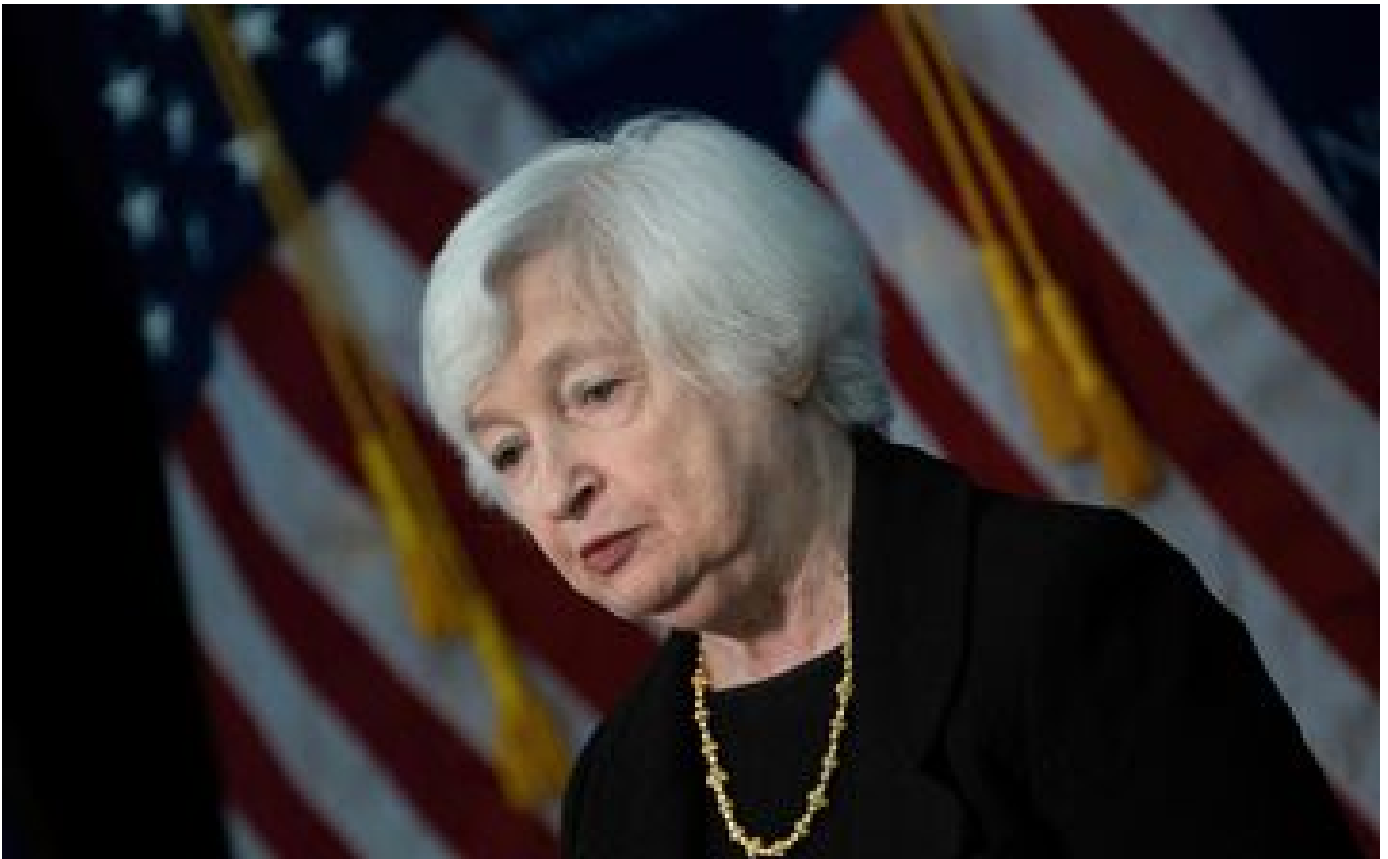
États-Unis : la date d'un possible défaut de paiement ajustée au 5 juin, les négociations continuent