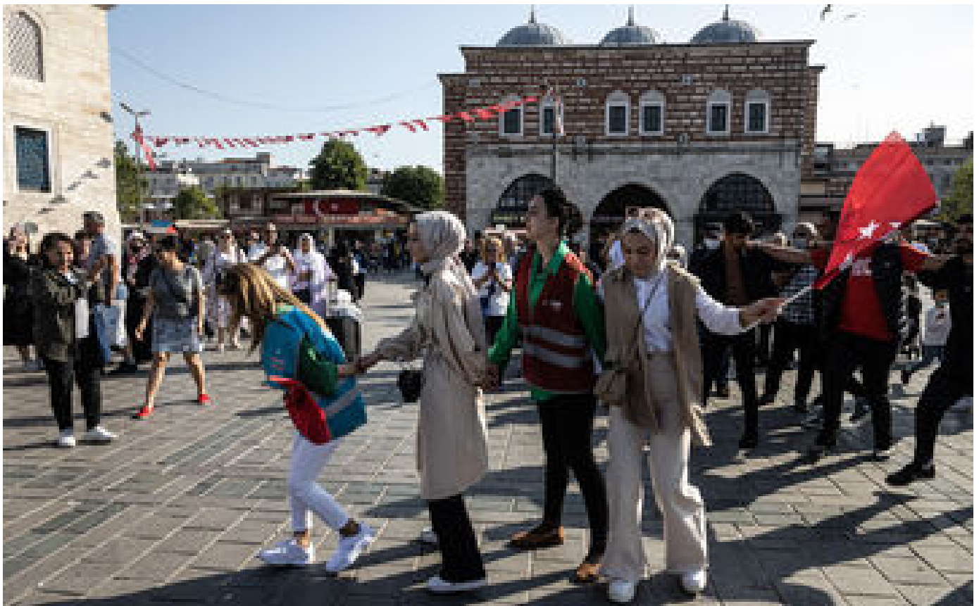
En Turquie, les anti-Erdogan n'ont plus d'espoir : « J'ai vite compris que le combat était fini »