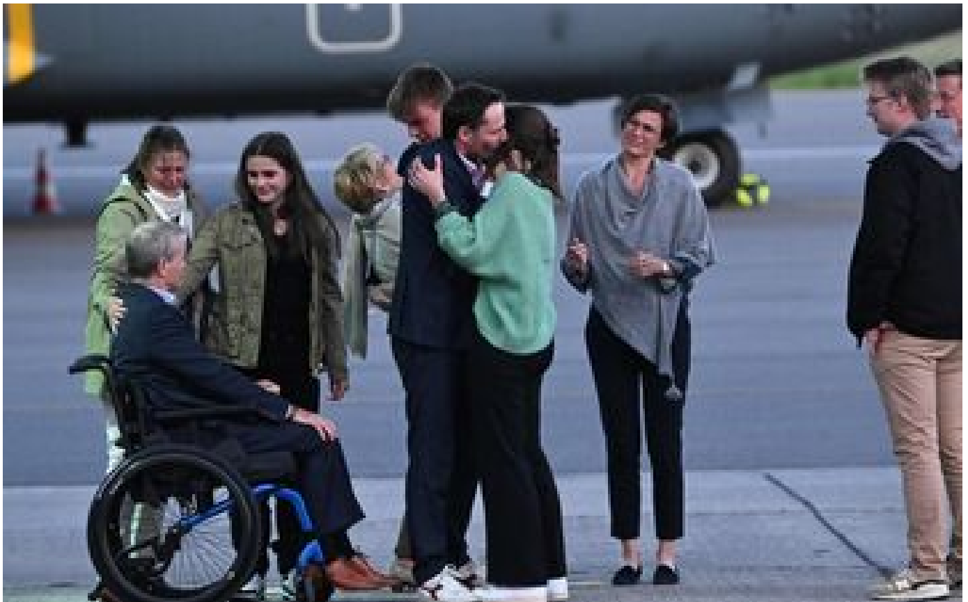
Libéré, l'humanitaire belge détenu en Iran a pu retrouver ses proches