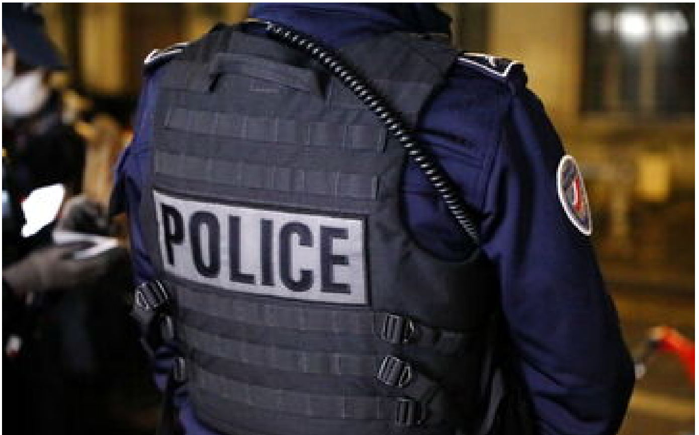
Morbihan : le corps sans vie d'une femme retrouvé dans un cours d'eau