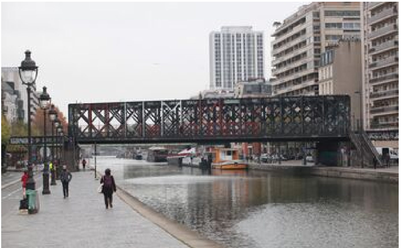
Paris : un corps repêché dans le canal de l'Ourcq, la brigade criminelle saisie