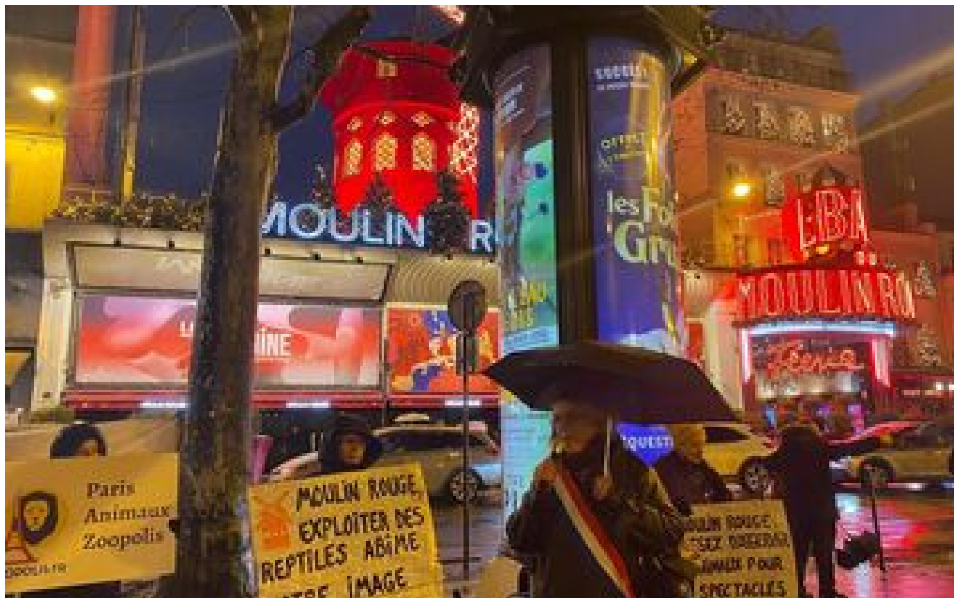
Le Moulin Rouge arrête immédiatement son numéro contesté avec des serpents