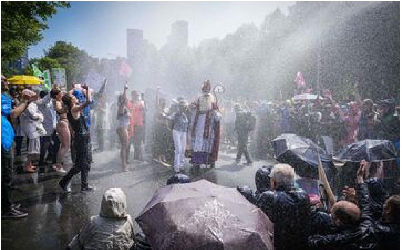
Manifestation pour le climat aux Pays-Bas : près de 1600 interpellations, dont l'actrice Carice Van Houten