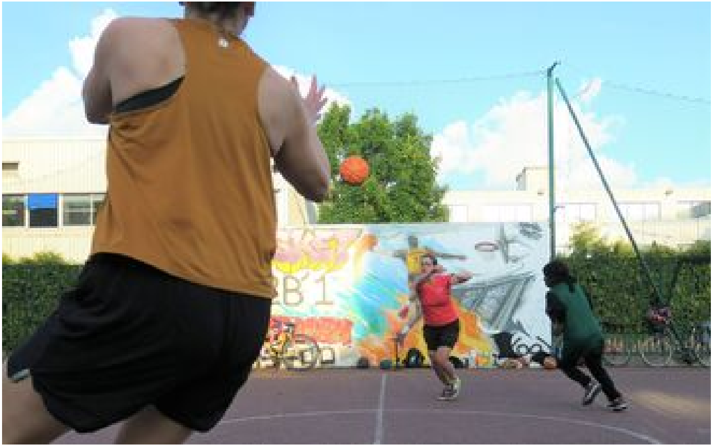
Cette heure et demi est à peine de Paris à Saint-Ouen, comment ces femmes impressionnent-elles