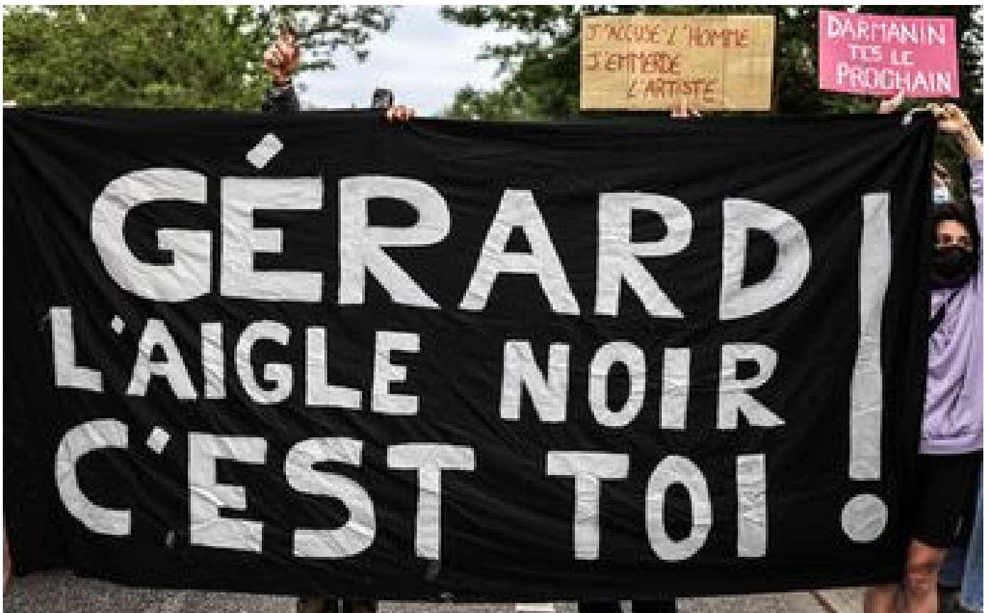
Lyon : un spectacle de Gérard Depardieu perturbé par des collectifs féminins