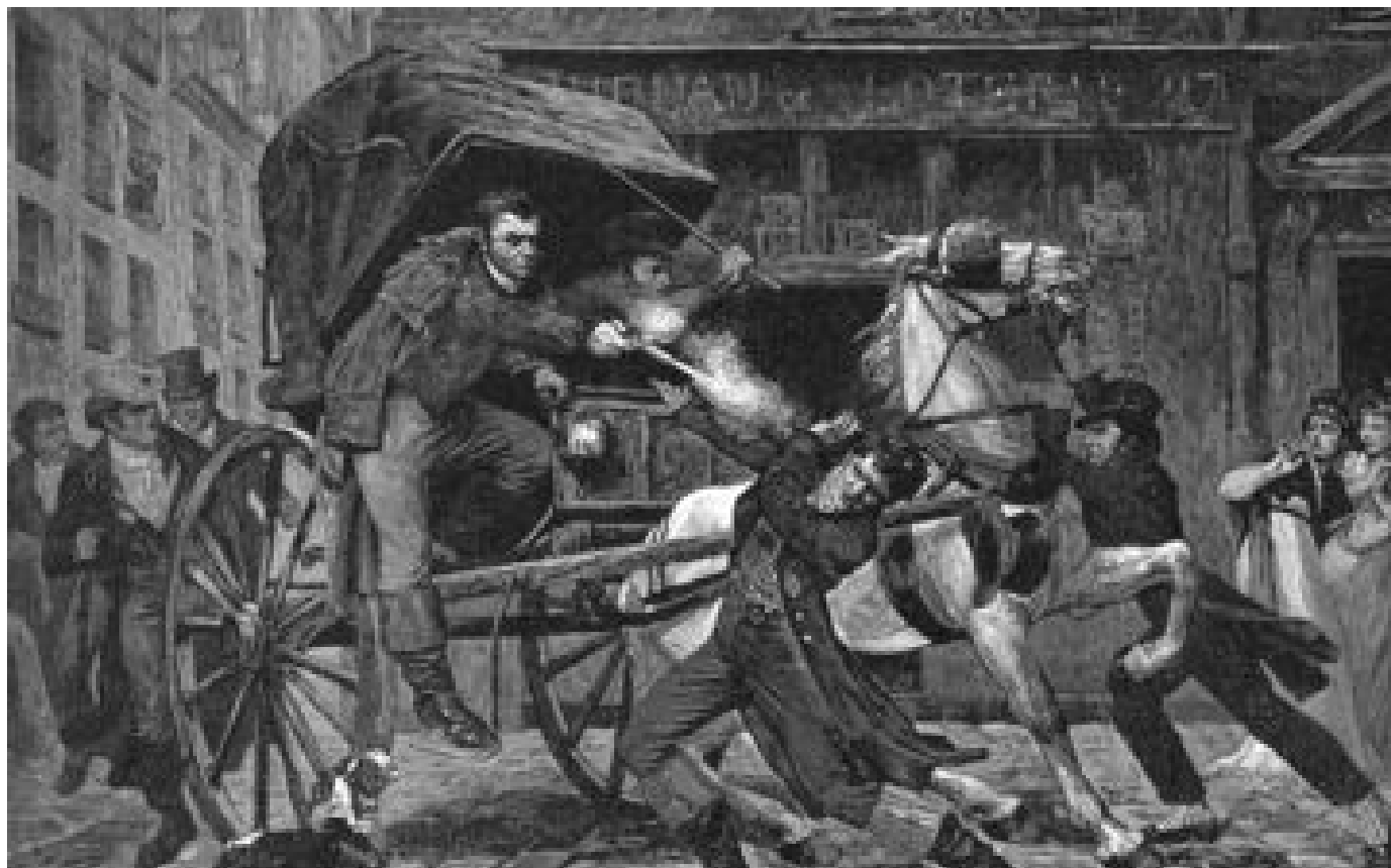
Policiers tués dans le Nord : en 1804, Bonaparte fait de l'inspecteur Buffet la première « victime du devoir »