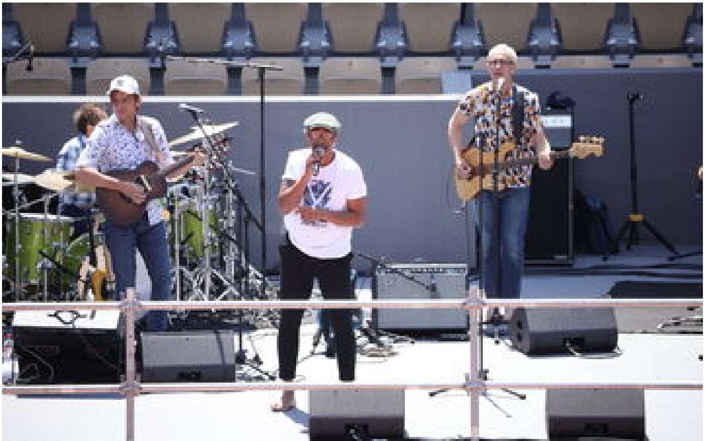
A Roland-Garros, on a fêté Yannick Noah 40 ans après : « Ce jour a compté pour les gens de ma génération »