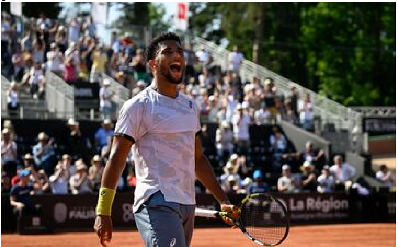
Tennis : Arthur Fils vainqueur final de l'Open Parc de Lyon, son premier trophée ATP