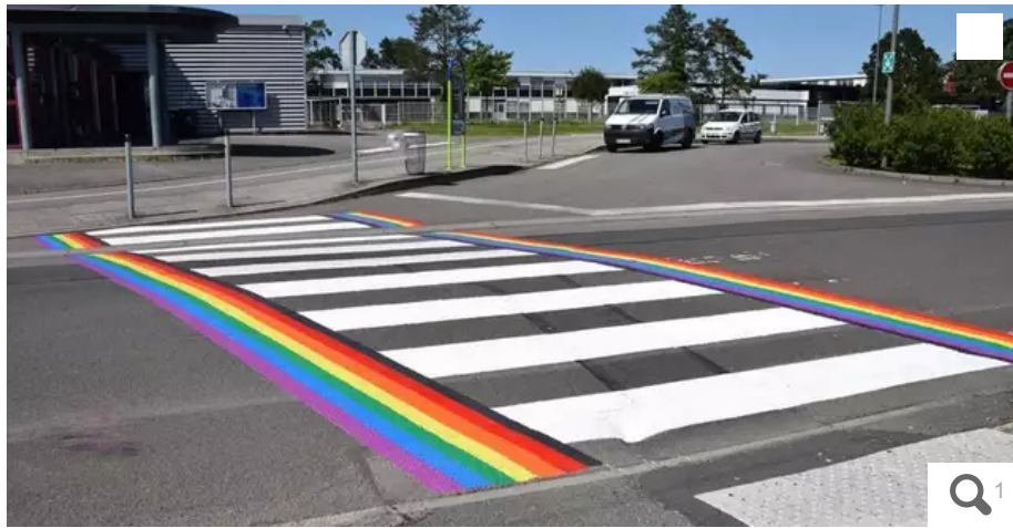
Le passage piéton, avant les dégradations.

Au lendemain de la marche des fiertés, des dégradations ont été commises sur le passage piéton repeint aux couleurs de l'arc-en-ciel, à Ancenis-Saint-Géréon. Une plainte a été déposée par la mairie.