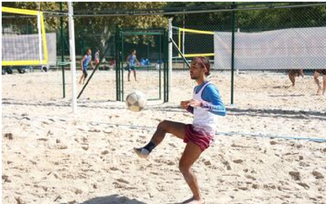
« Il va y avoir du spectacle » : très prisé des Brésiliens, le foot volley débarque à Wissous