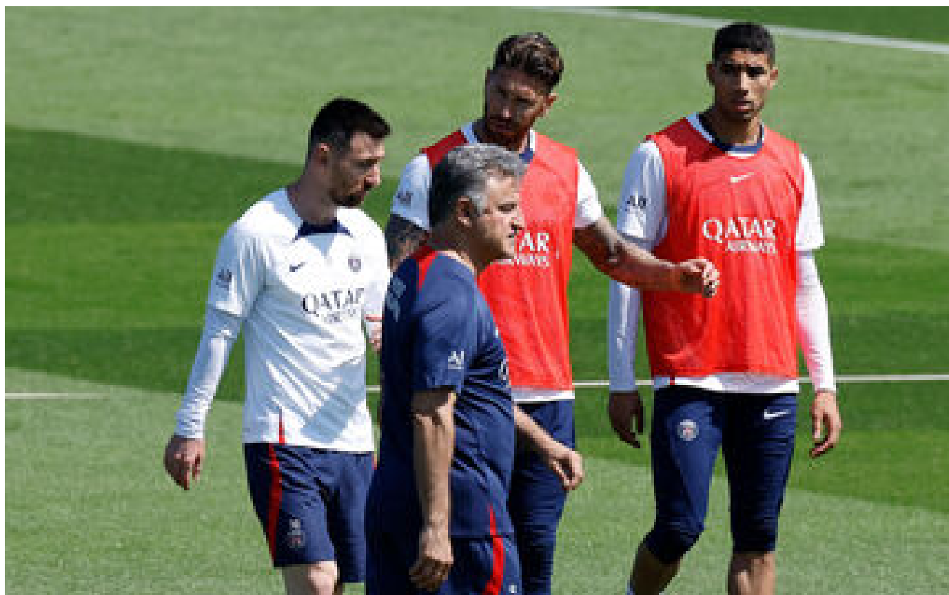
PSG-Clermont : « Ce sera son dernier match au Parc », Galtier confirme le départ de Messi