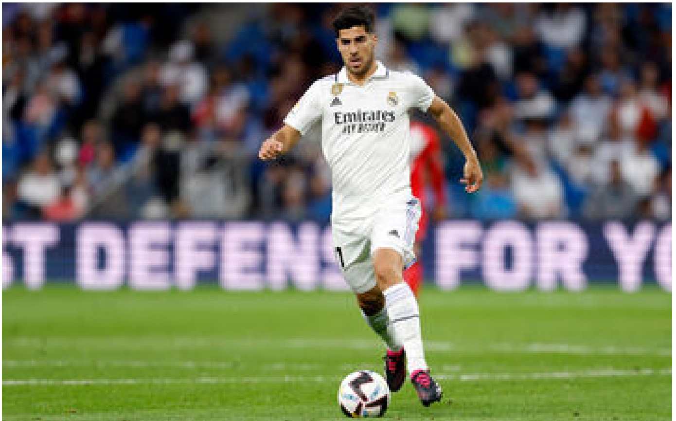
Mercato : Marco Asensio va signer au PSG