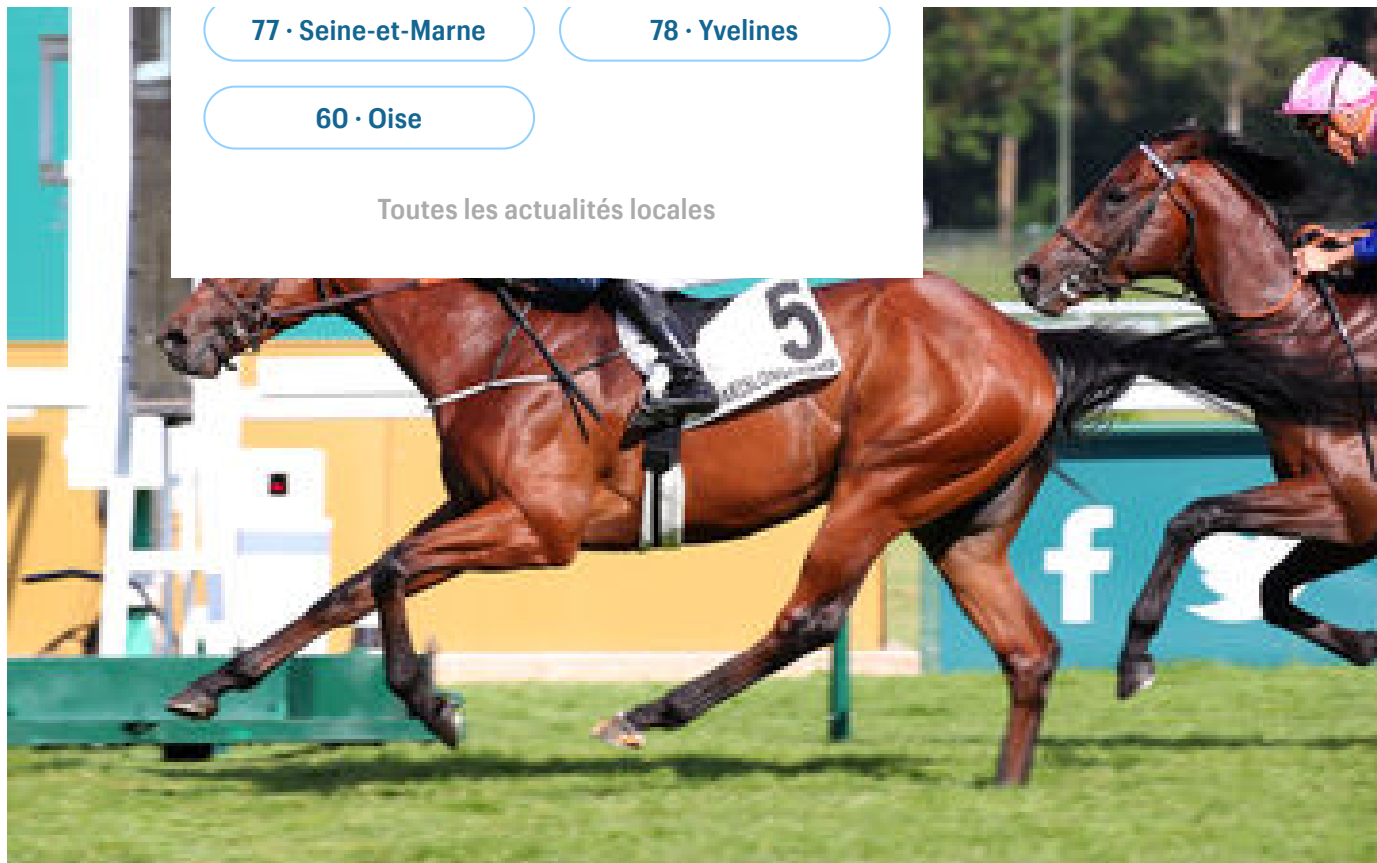
PMU - Arrivée du quinté du jeudi 1er juin à ParisLongchamp : Aalto fait forte impression