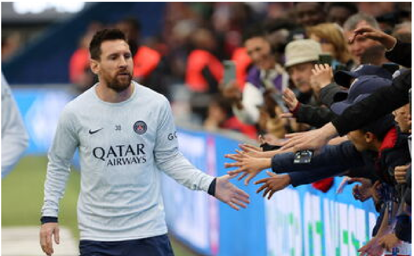
PSG : Galtier annonce le dernier match de Messi... le club rétropédale