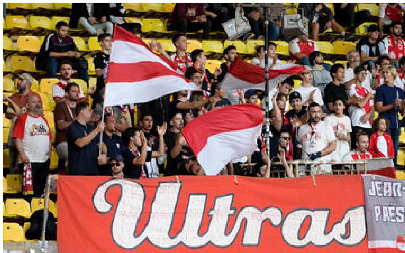
« Mouillez le maillot ou cassez-vous » : le coup de pression des ultras monégasques