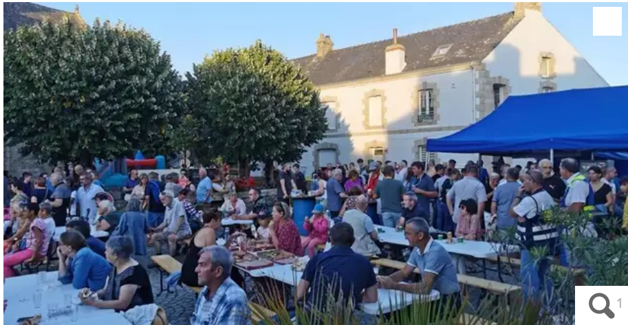
Les marchés nocturnes seront reconduits cet été.