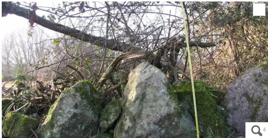
Une partie des monolithes du site de Montauban, à Carnac (Morbihan), avant leur destruction.

Dans l'affaire des menhirs détruits à Carnac (Morbihan), l'emballement médiatique national – à grand renfort de photos inappropriées d'alignements, très éloignés du site concerné – et les menaces scandaleuses dont est victime le maire de Carnac, laissent désormais la place aux soupçons de fake news. Sans aucune vérification et au mépris des faits. La rédaction de Ouest-France refait un point précis sur la réalité de ce dossier.