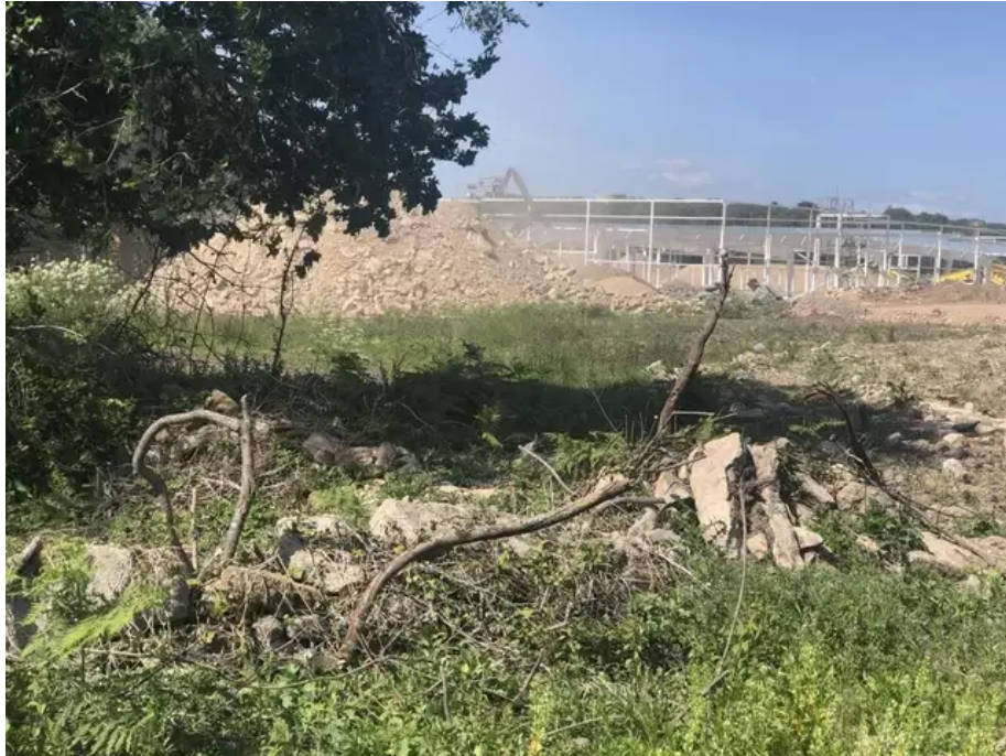
Le site de la zone de Montauban, devant le chantier de construction de l'enseigne de bricolage.

Autre élément capital pour les archéologues : une datation au carbone 14 réalisée en 2009 lors d'une fouille à 200 m du site, avait montré une datation de 5480-5320 avant Jésus Christ. Ce qui laissait envisager que ces petits menhirs constituaient l'un des ensembles du genre les plus anciens de l'ouest.