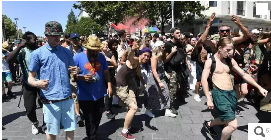
Manifestation des sound system dans les rues de Nantes ce samedi, après leur interdiction pendant la fête de la musique du 21 juin.

Les membres du collectif de musique électro étaient entre 200 et 300 à défiler, ce samedi 24 juin, entre la préfecture et le miroir d'eau, à Nantes. Le 21 juin, ils avaient souhaité participer à la Fête de la musique, mais ils s'étaient sentis mis à l'écart par la Ville de Nantes. En organisant ce défilé, ils ont aussi pris date pour le 21 juin 2024, en espérant que Ville et État les laisseront s'exprimer.