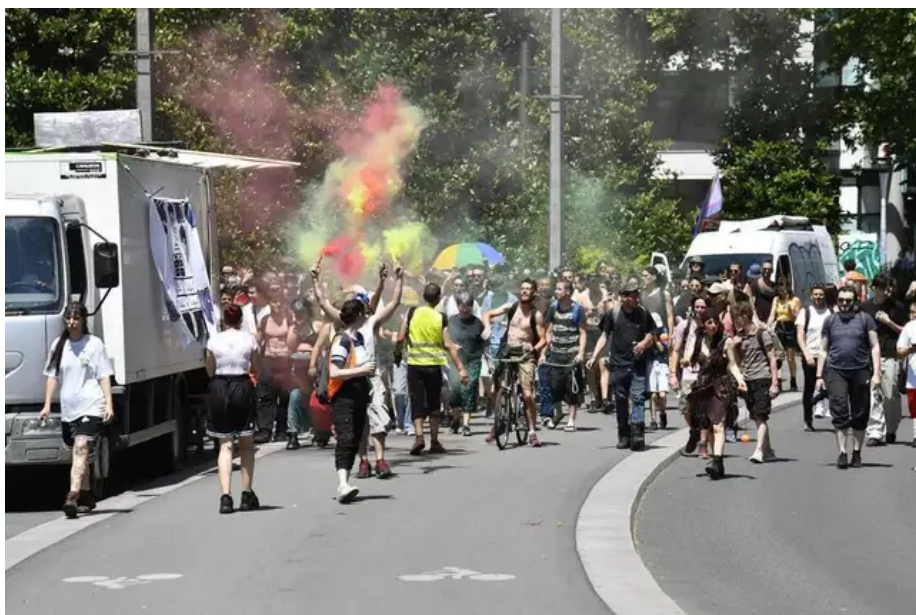
Ils défendent la culture electro underground, trop souvent « discriminée », selon les organisateurs de free party.