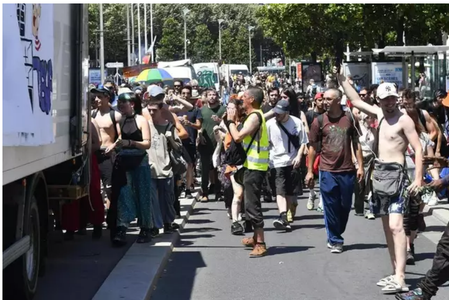
Comme un petit retour de la marche des fiertés, qui a eu lieu le 10 juin à Nantes.

excentrés. Aussi parce que « toutes nos propositions ont été balayées », écrivaient-ils récemment dans une lettre envoyée aux autorités, « alors que nous étions prêts à couper le son à 1 h comme tous les autres et à limiter les nuisances sonores ».