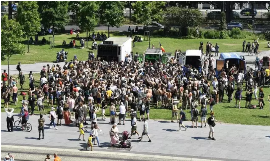
La fin du parcours se trouve près du miroir d'eau à Nantes. Place à la free party et ses sound system.

À défaut de participer à la Fête de la musique, le collectif a décidé d'organiser une manifestation ce samedi, afin notamment de « sensibiliser sur la discrimination perpétuelle subie par les organisateurs et le public des évènements électroniques underground ».