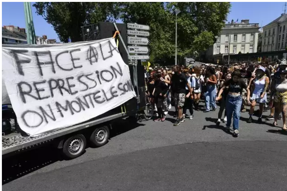
« Face à la répression, on monte le son » : un des slogans de la manifestation.

Environ 300 sympathisants des sound system et free party manifestent en musiques, ce samedi 24 juin, pour se faire entendre et revendiquer leur culture festive et musicale. Ils s'étaient donné rendez-vous à partir de 14 h, devant la préfecture de Loire-Atlantique à Nantes, pour un parcours jusqu'au miroir d'eau.