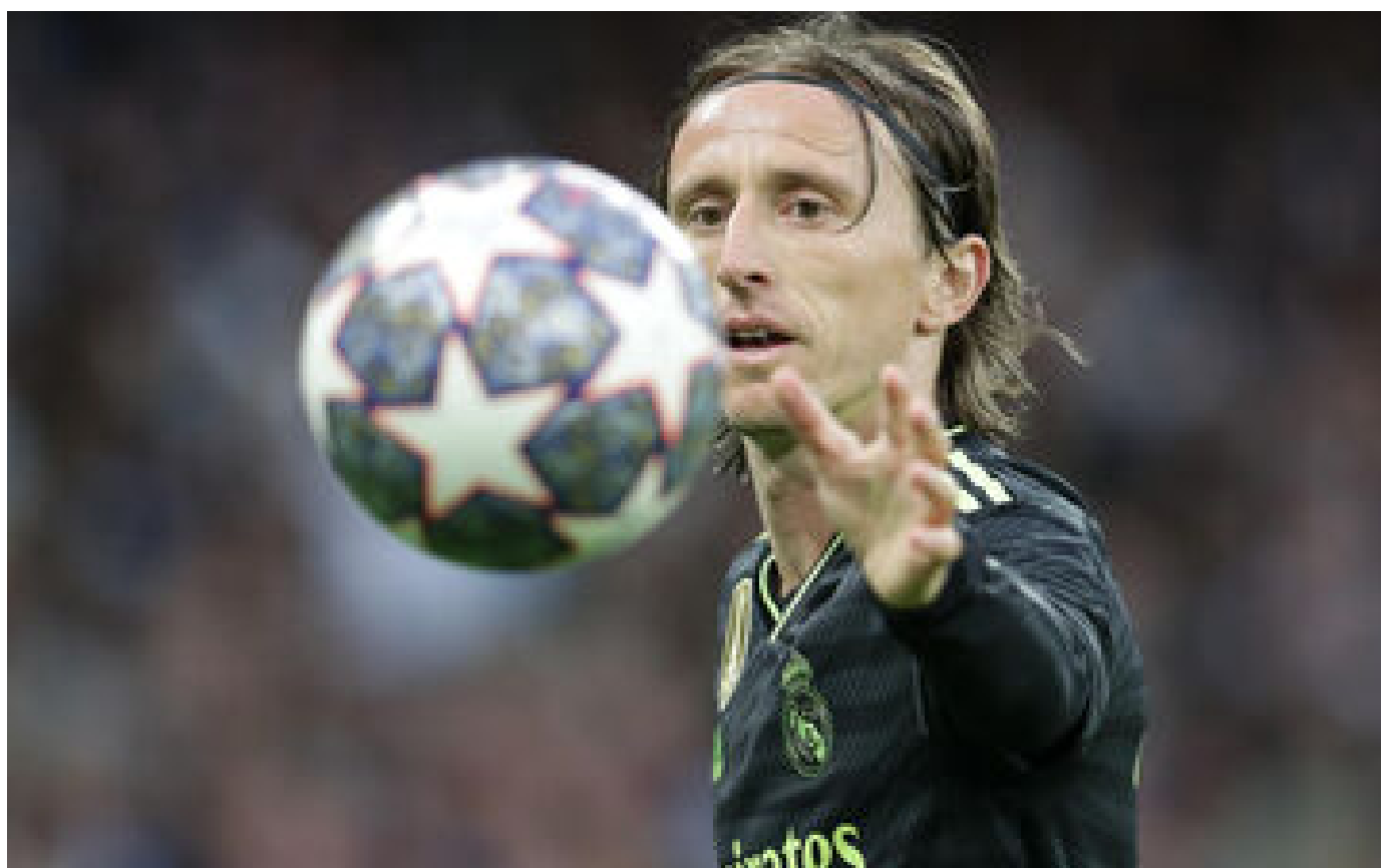
Mercato : Luka Modric prolonge au Real Madrid jusqu'en juin 2024