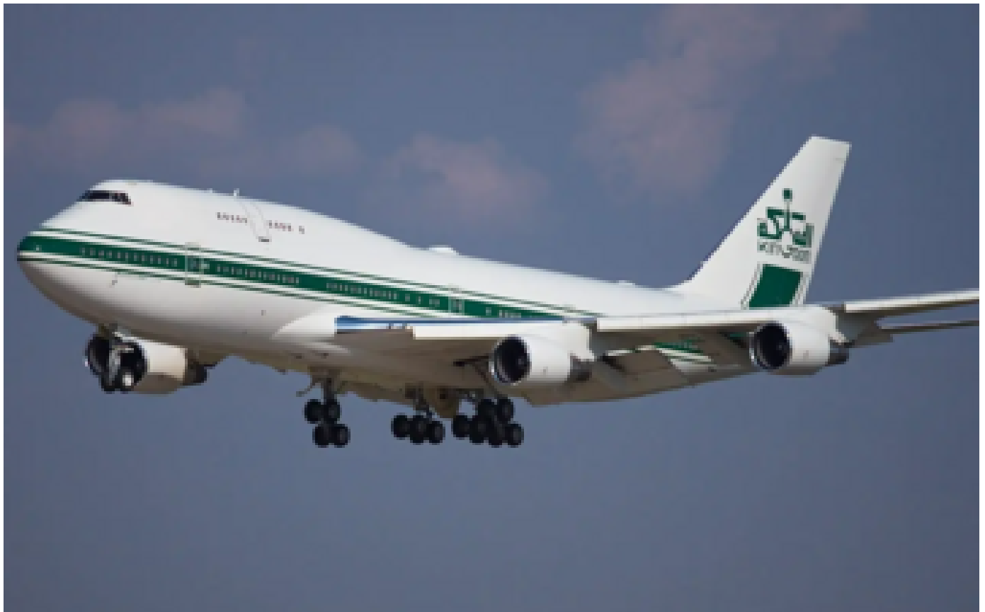
Football: l'incroyable palace volant utilisé par les joueurs du club saoudien d'Al-Hilal