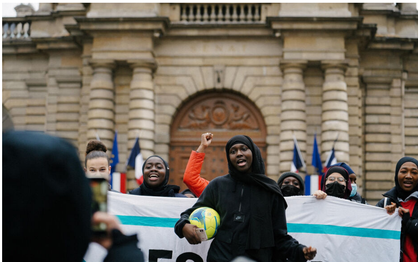
En janvier 2022, les "Hijabeuses" avaient protesté devant le Sénat.

Ce lundi, se déroulait devant le Conseil d'État l'audience concernant le recours du collectif des Hijabeuses qui milite pour le droit de jouer voilées en compétition. Le rapporteur public a demandé l'annulation de l'article 1 de la Fédération française. Une décision est attendue d'ici mi-juillet.