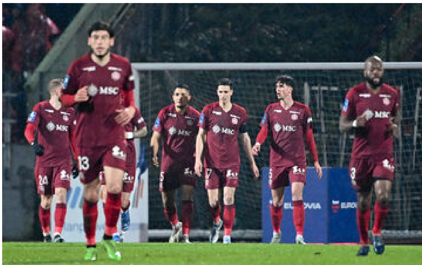
Ligue 2 : « Ne laissez pas passer cette injustice »... l'appel au secours des joueurs d'Annecy