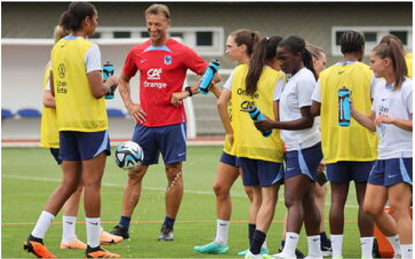
Coupe du monde féminine de football : la finale sur France Télévisions, le premier match des Bleues sur M 6