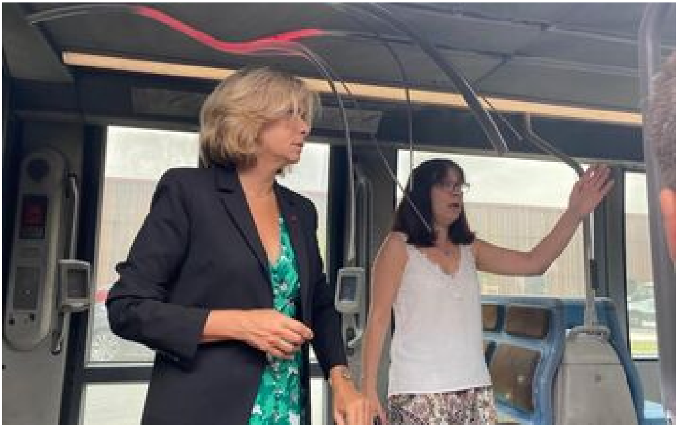
Incidents après la mort de Nahel : Péresse préconise l'arrêt des bus et trams à 21 heures en Île-de-France