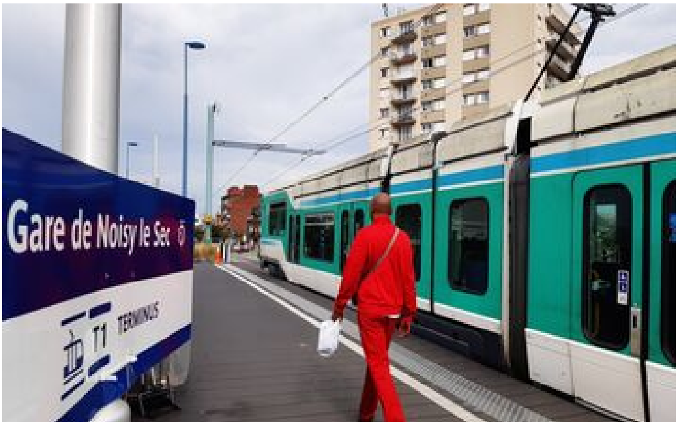
Mort de Nahel : cinq lignes de tramway interrompues après une deuxième nuit de violences