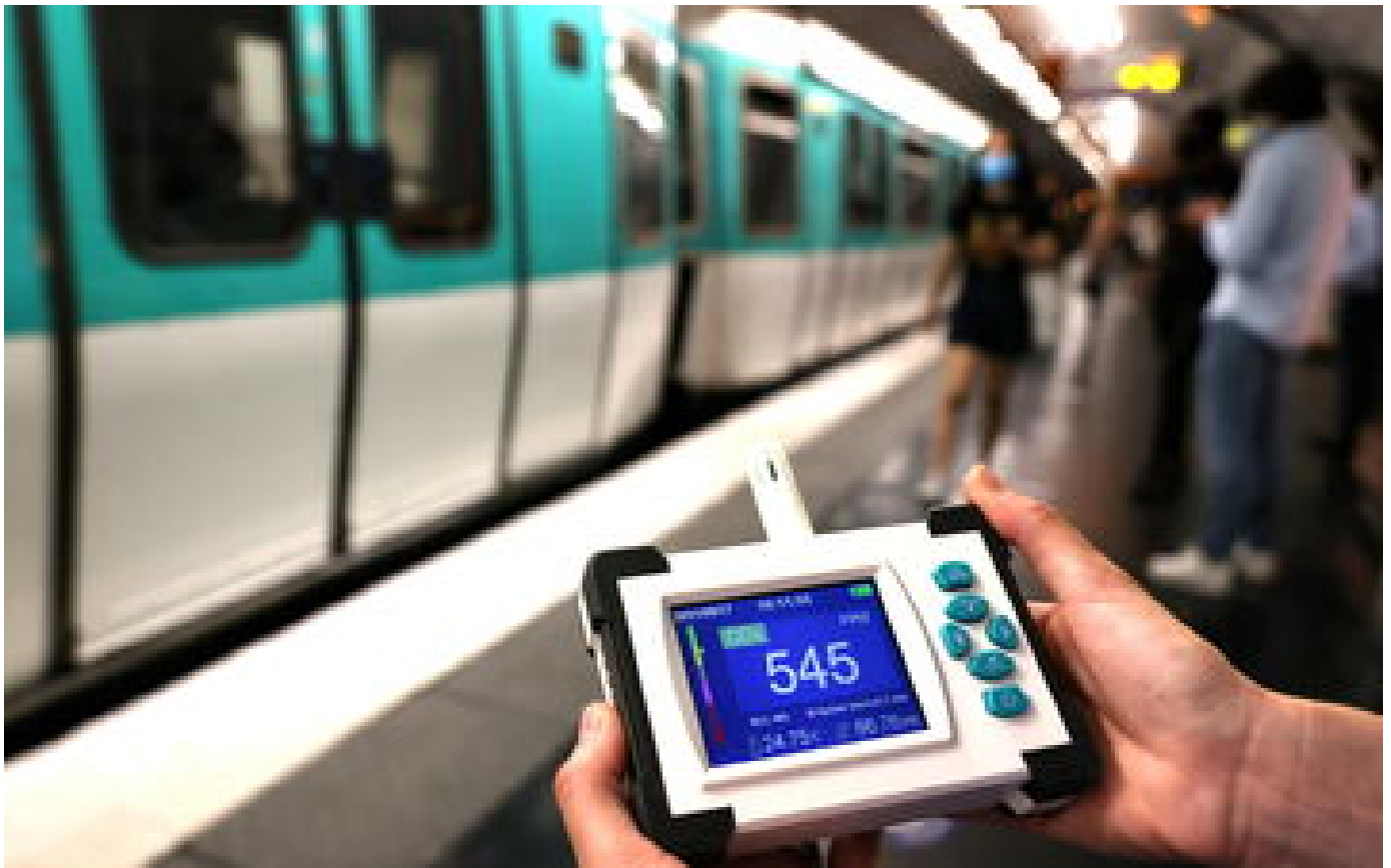
Qualité de l'air dans le métro : la RATP sommée de dévoiler ses données