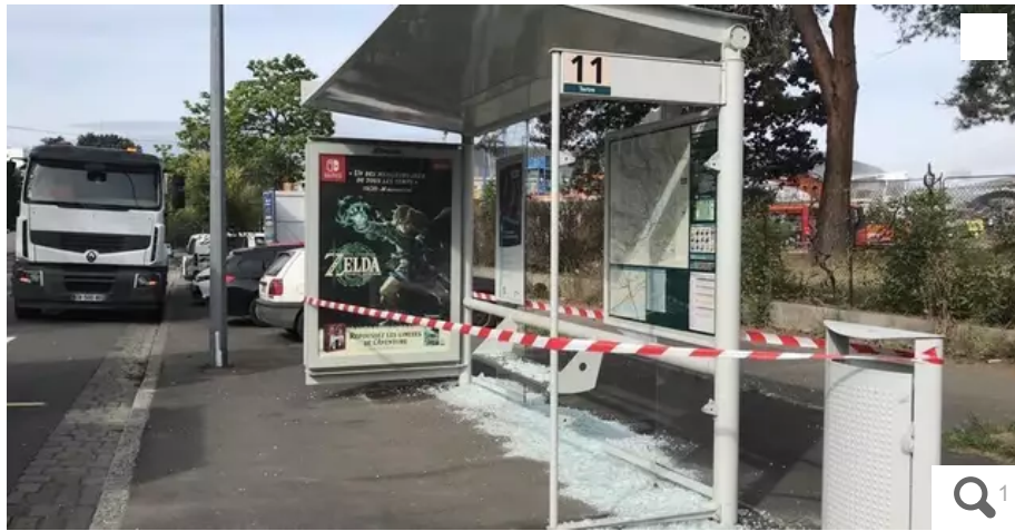
Un abribus caillassé, dans la nuit du jeudi 29 au vendredi 30 juin, à Nantes.

Organisations syndicales et direction de la Semitan, société d'exploitation des transports en commun de l'agglomération nantaise, l'ont décidé ce vendredi 30 juin dans la matinée lors d'un CSE extraordinaire.