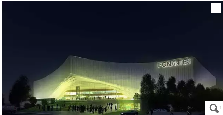
Parmi les centaines de factures produites par le club, pour un montant total de près de 5 millions d'euros, une seule (118 000 €), émanant d'un cabinet de conseil se rattache directement au « FC Nantes Stadium ».

Votre e-mail, avec votre consentement, est utilisé par la société Additi Multimedia pour recevoir les newsletters sélectionnées. En savoir plus