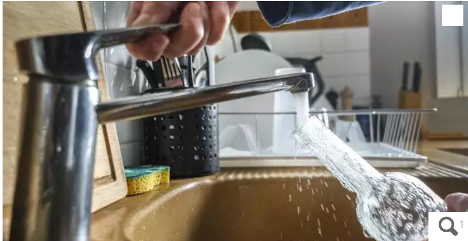
Le département de la Loire-Atlantique a atteint le seuil de « alerte » pour l'eau potable.

Malgré les orages et les pluies enregistrées ces derniers jours, la situation hydraulique de la Loire-Atlantique ne s'améliore pas. Plusieurs bassins-versants ont atteint le seuil de « crise » et le préfet a placé ce 31 juillet 2023 l'ensemble du département en « alerte » eau potable.