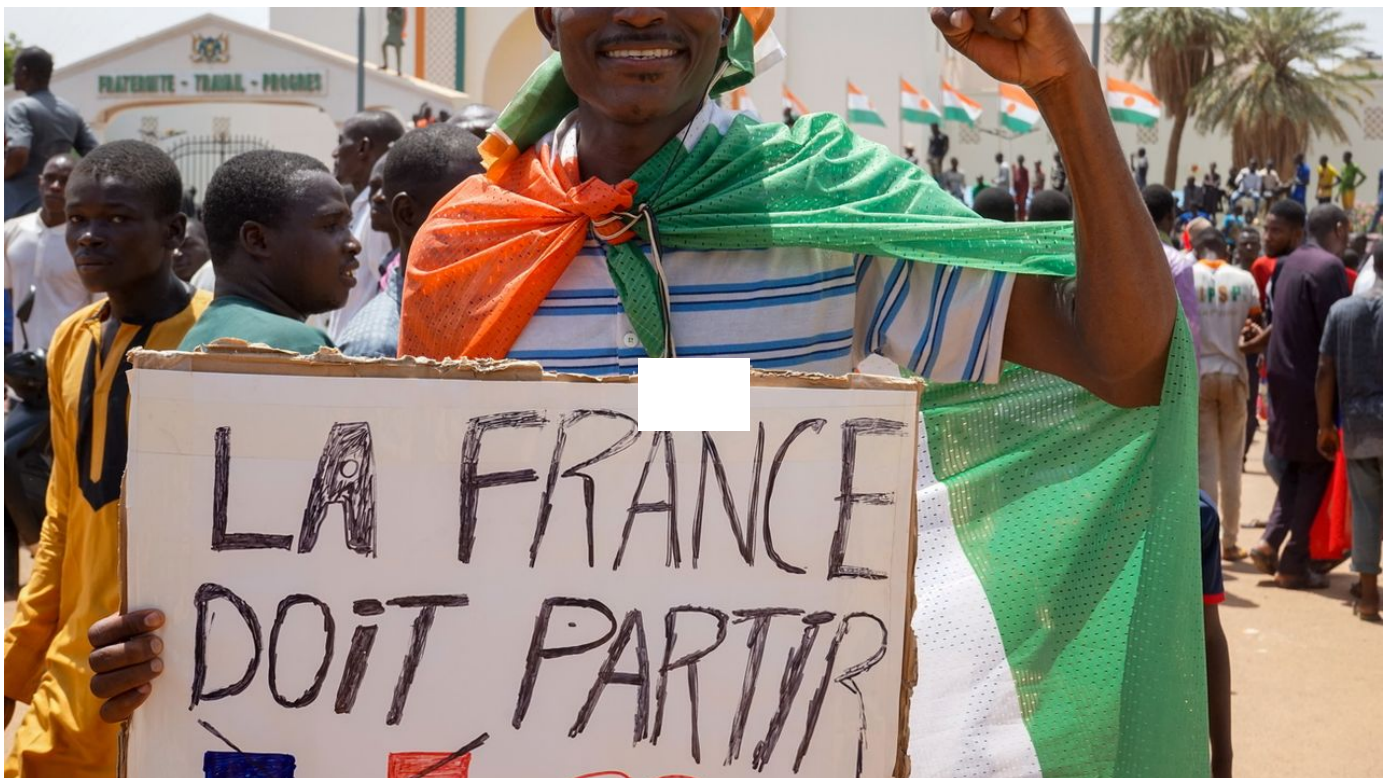
La France va débiter ce mardi l'évacuation de ses ressortissants au Niger / La Matinale / 25 sec. / aujourd'hui à 06:28

La France a décidé d'évacuer dès mardi ses ressortissants du Niger, "compte tenu de la situation à Niamey", a annoncé le ministère des Affaires étrangères dans un communiqué.