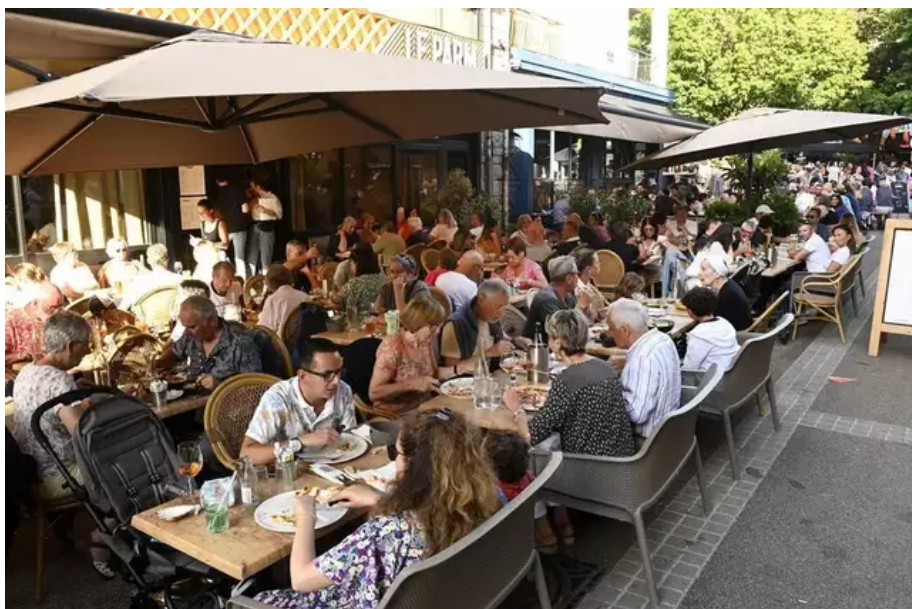
Le soir, les terrasses sont bien pleines.

Un peu plus loin dans la rue, à Fromageons, les clients privilégient les carafes d'eau à l'alcool et « les desserts ne sont pas systématiques », observe Isabelle Mazzola, la responsable.