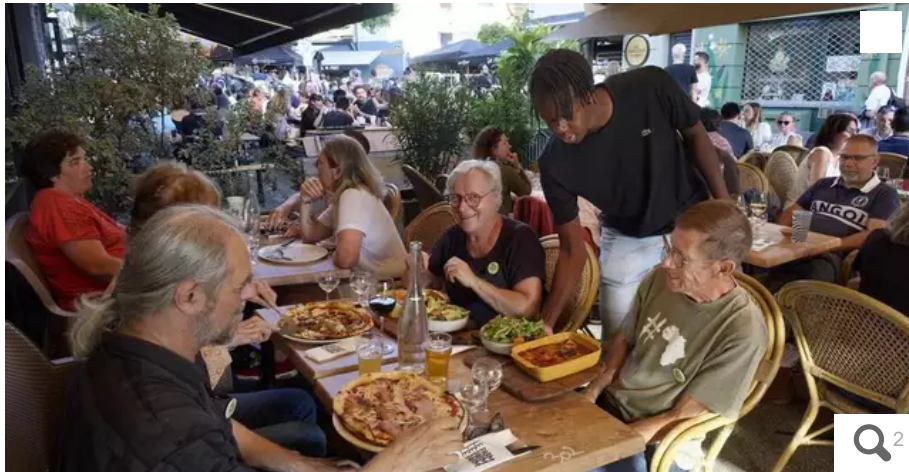
Au Café Parm', rue du Port, la terrasse ne désemplit pas.

Avec l'inflation, les festivaliers trouvent des alternatives pour continuer à manger au restaurant, pendant le Festival Interceltique de Lorient, du 4 au 13 août 2023 : pas de dessert, ou seulement une carafe d'eau en guise de boisson. Les restaurants affichent quoi qu'il en soit toujours complets.