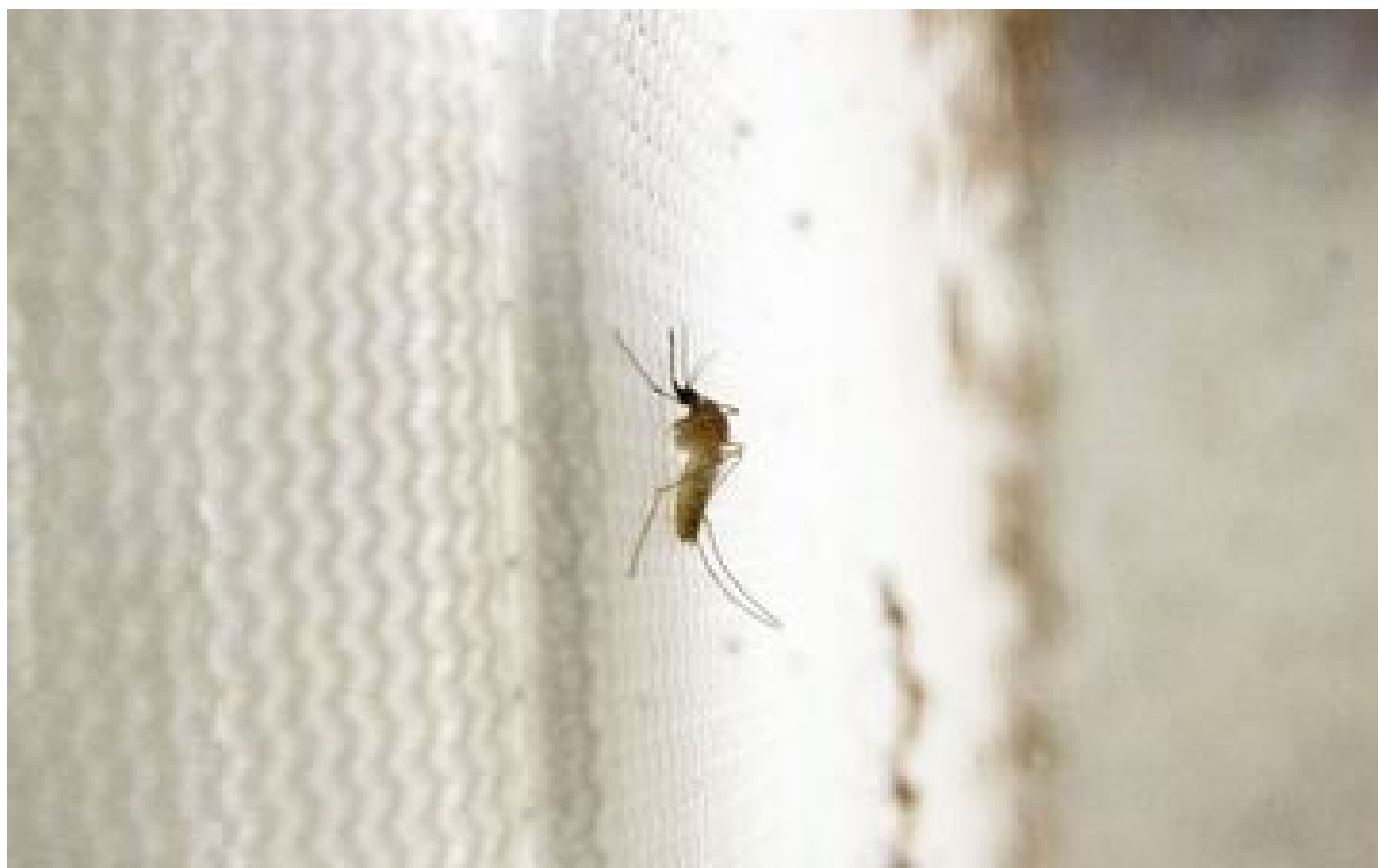
Sept cas du virus du Nil occidental identifiés en Gironde