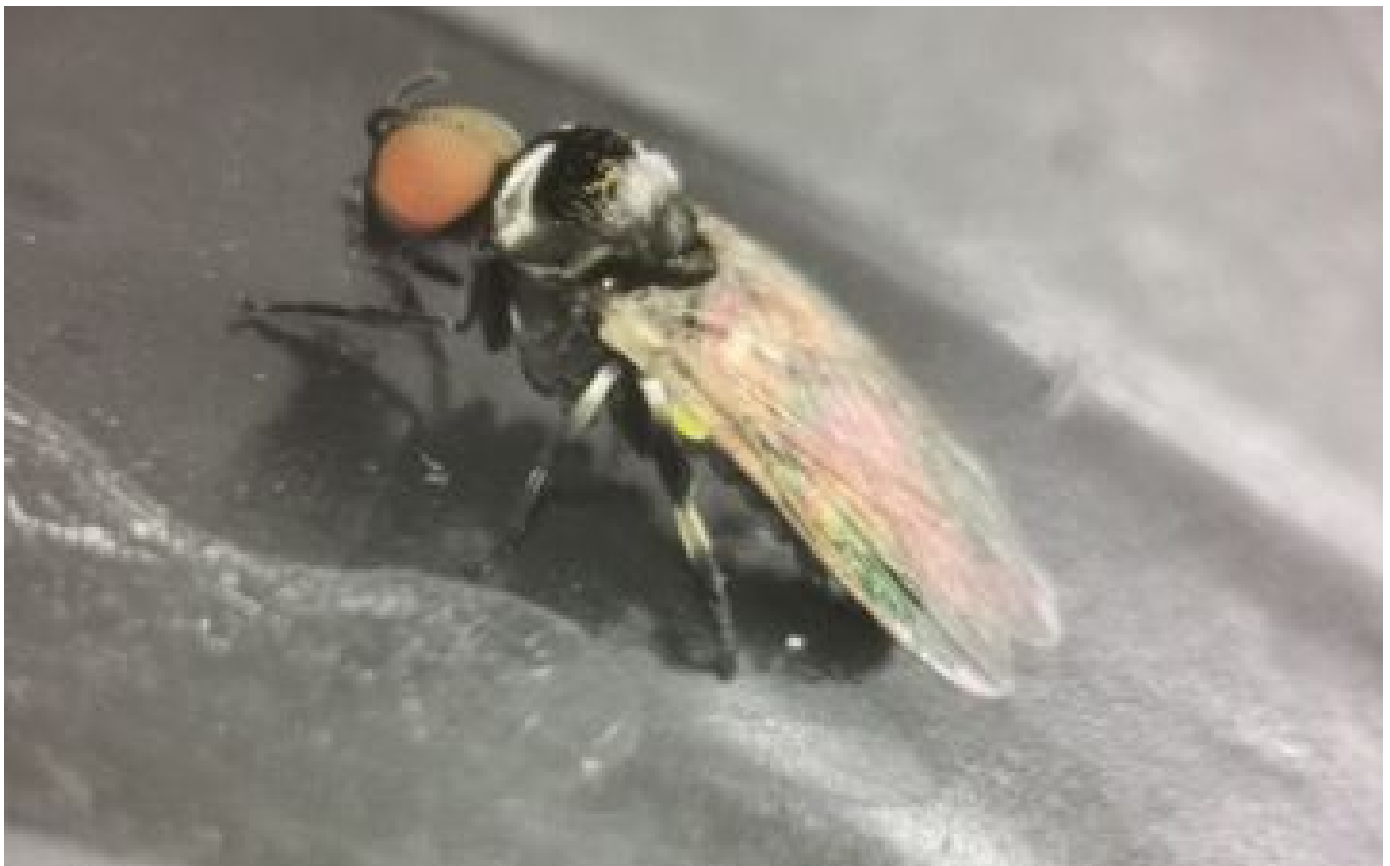
Mouche noire : qu'est-ce que cet insecte mordeur, présent en France, qui met l'Espagne en alerte ?