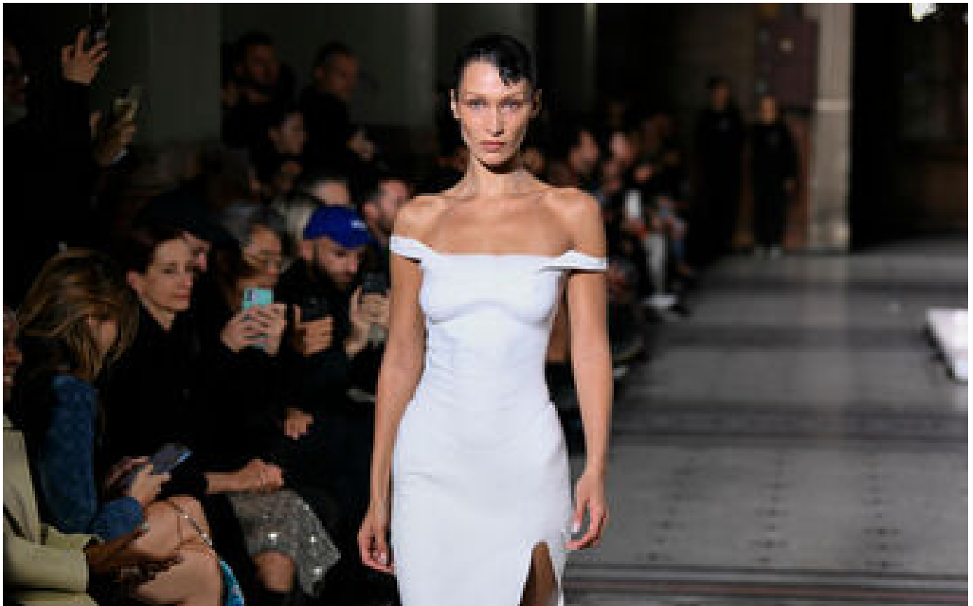
« 15 ans de souffrance invisible » : Bella Hadid annonce être atteinte de la maladie de Lyme