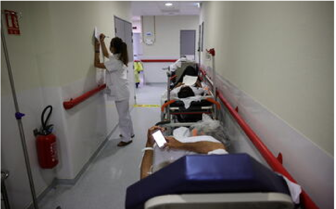
Botulisme : une femme décédée en Île-de-France, des jeunes de nationalité étrangère... qui sont les victimes ?