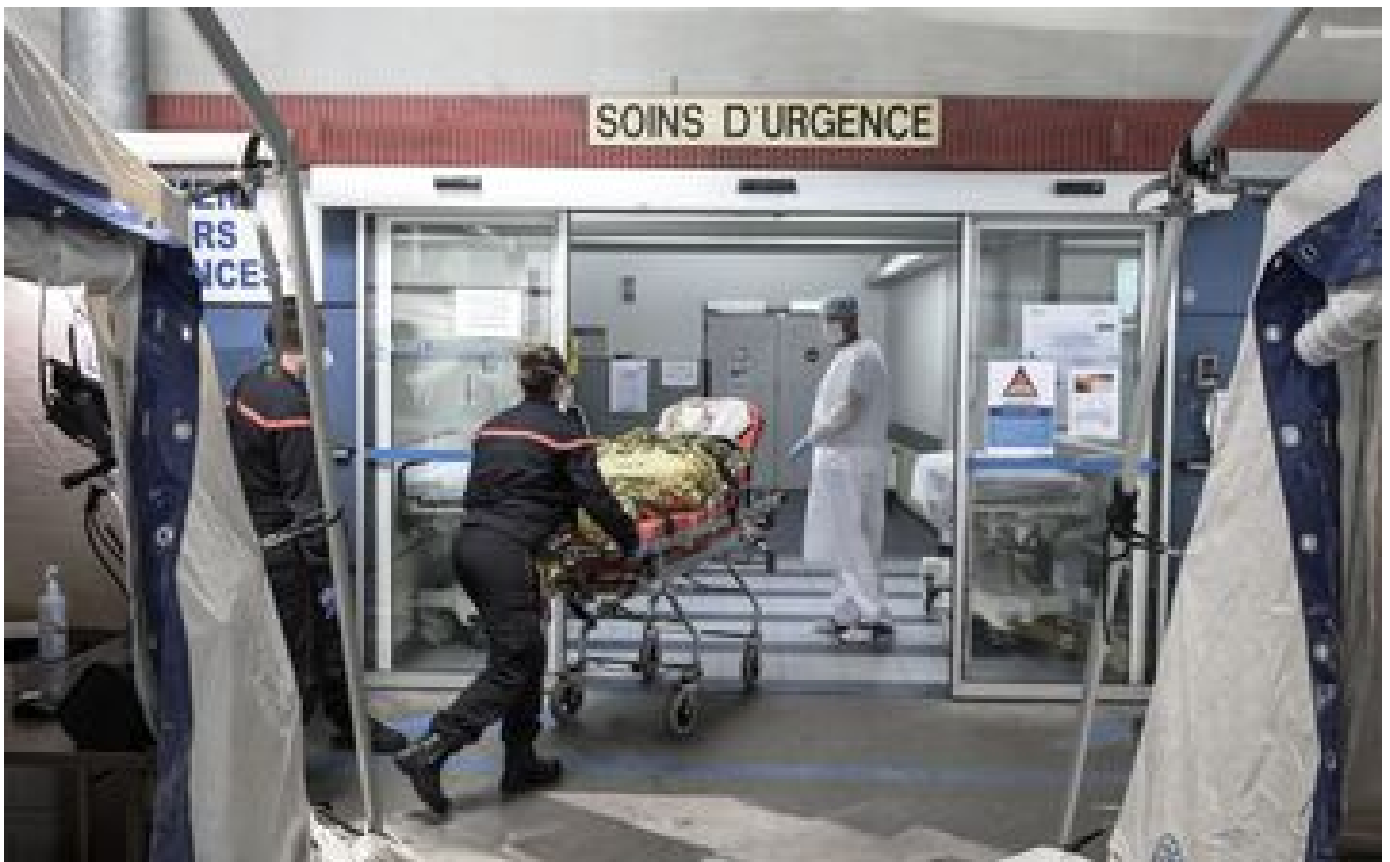
Botulisme à Bordeaux : un mort, plusieurs victimes hospitalisées... ce que l'on sait de cette grave intoxication