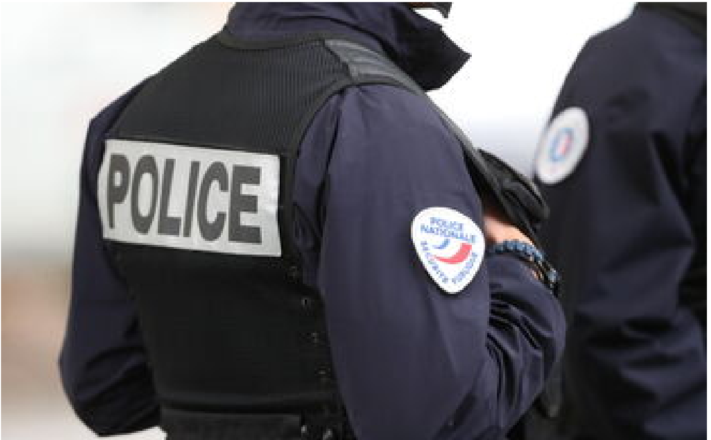
Coupe du monde de rugby : viol présumé d'une supportrice irlandaise à Bordeaux