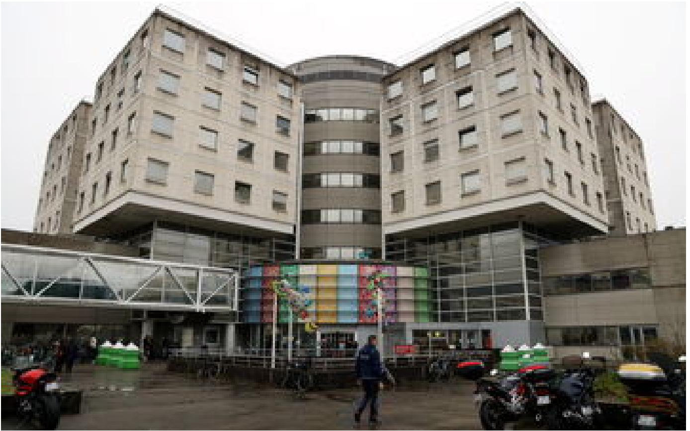
Bordeaux : un décès et plusieurs clients d'un bar hospitalisés après des cas de botulisme