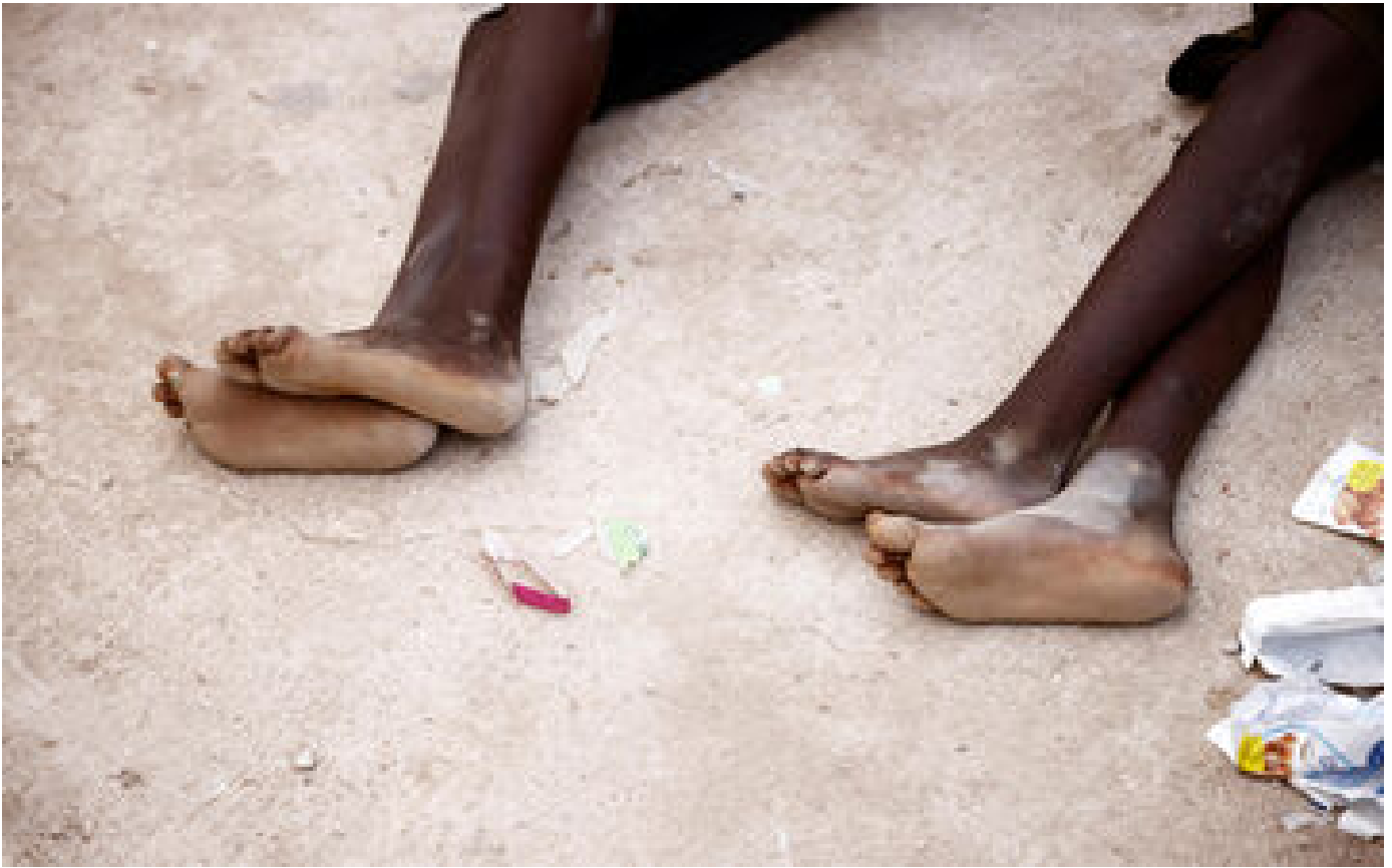
Lampedusa : cinq minutes pour comprendre la crise migratoire qui touche l'Italie