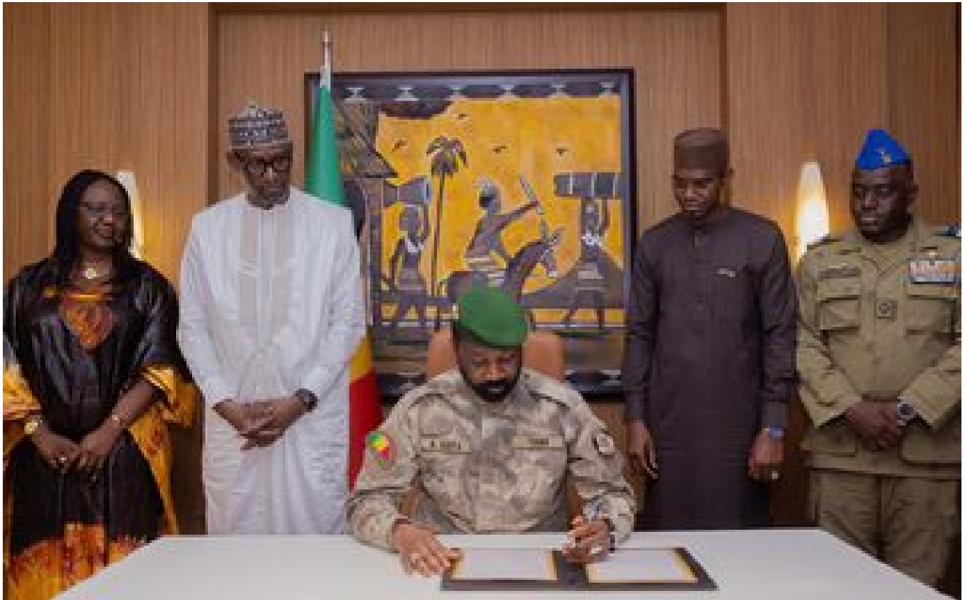
Le Mali, le Burkina et le Niger signent une alliance défensive pour lutter « contre le terrorisme »