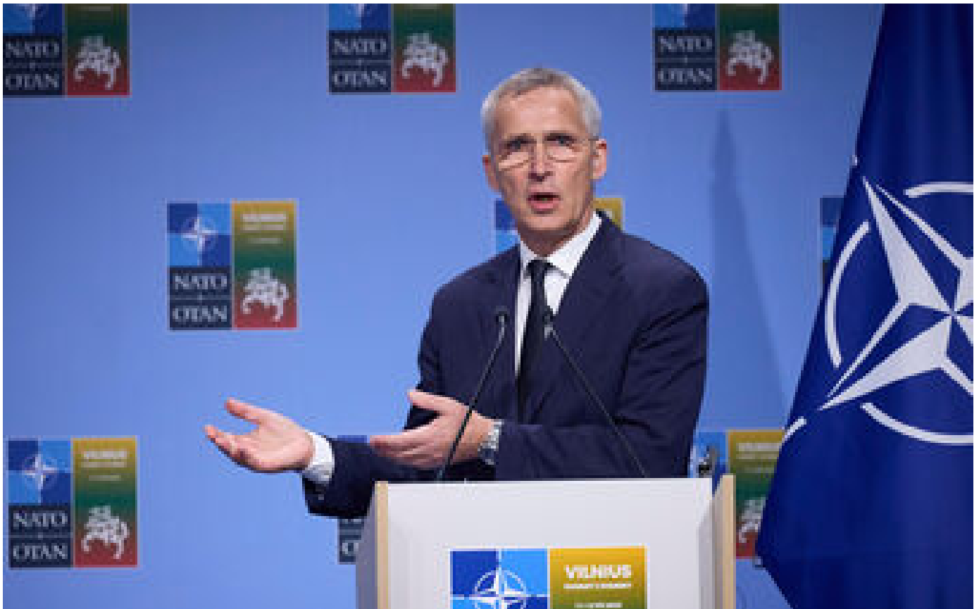
La guerre en Ukraine sera longue, prévient le secrétaire général de l'Otan