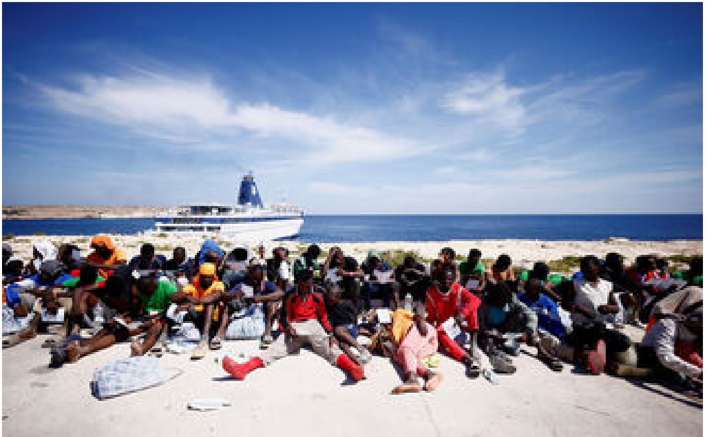
Lampedusa, seule depuis trente ans face aux migrants : « Ce n'est pas à nous de trouver des solutions » P