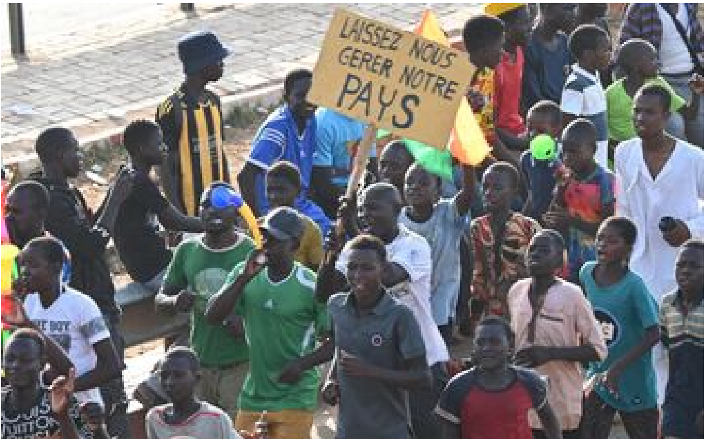
Niger, Burkina Faso... des chercheurs français craignent la suspension de programmes scientifiques P