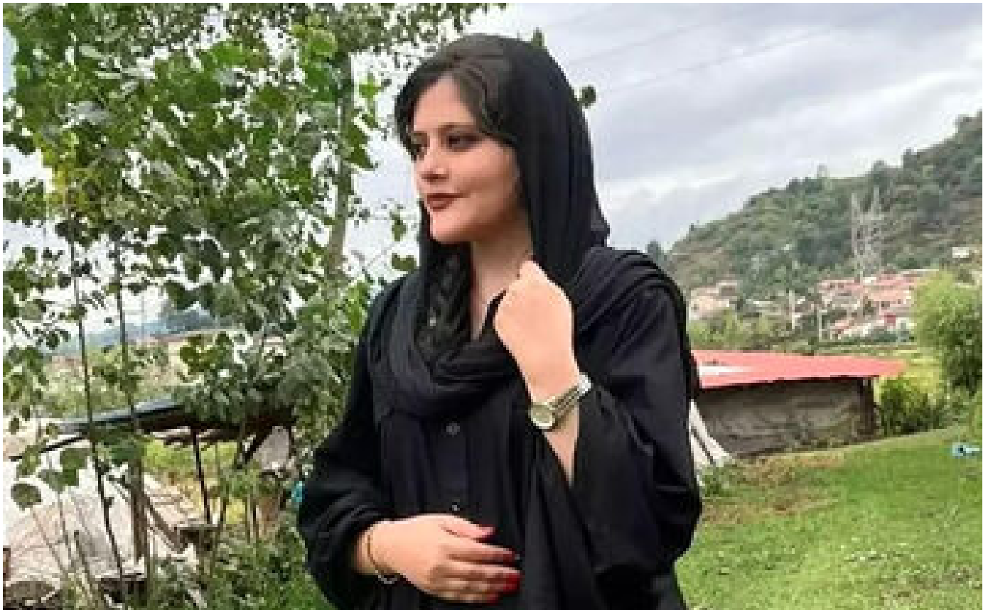
Iran : le père de Mahsa Amini arrêté alors qu'il se rendait sur sa tombe, les autorités prétendent avoir déjoué son « assassinat »