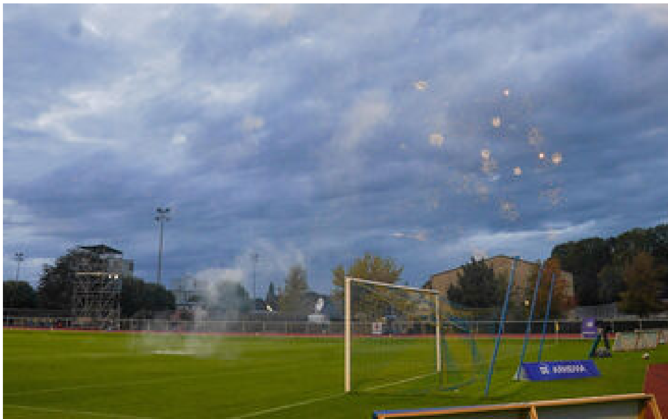
D1 Arkema : le match du PSG féminin contre Reims arrêté après des tirs de feu d'artifice sur le terrain