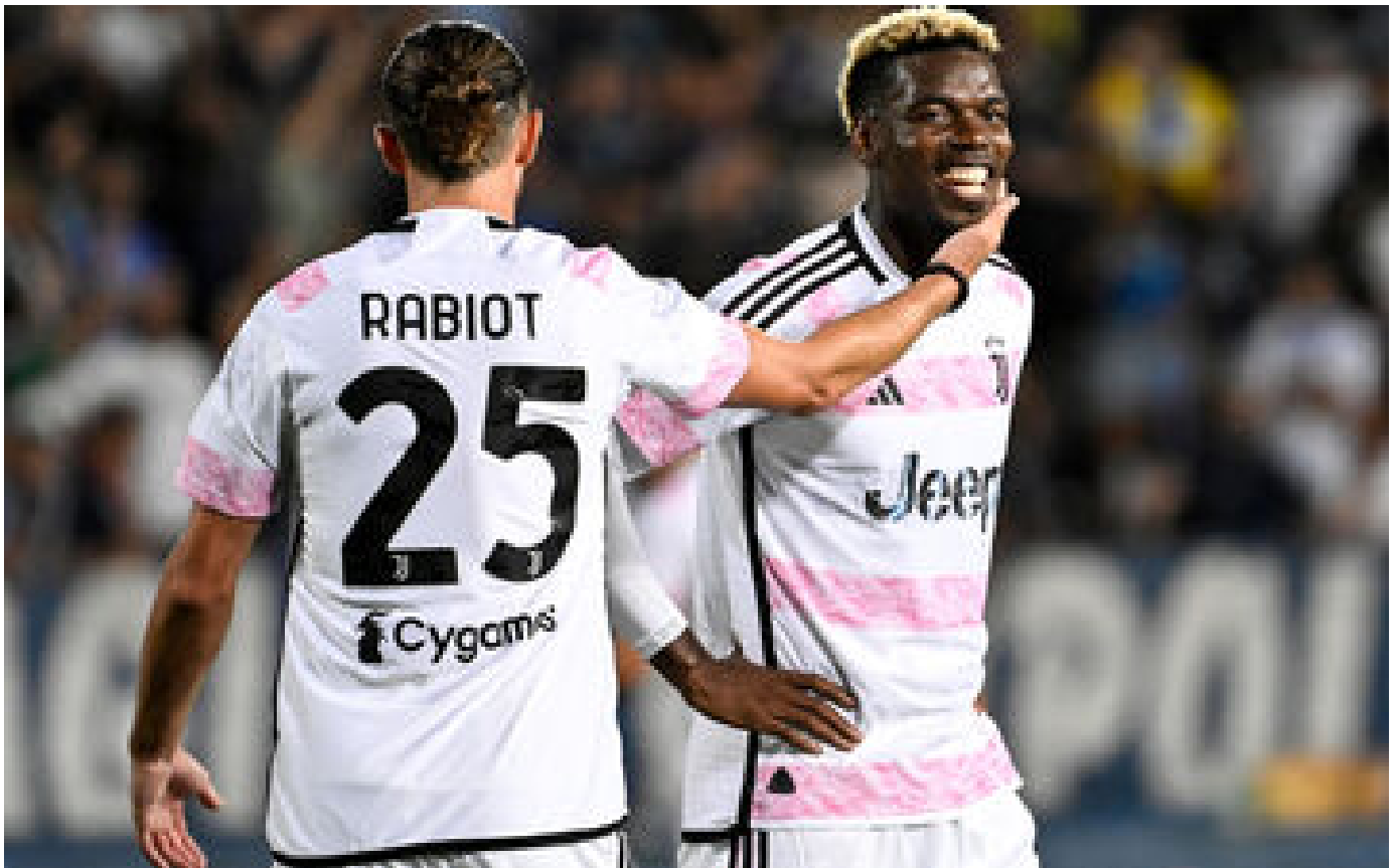
Football : « Bien sûr, on est avec lui », Adrien Rabiot affiche son soutien à Paul Pogba