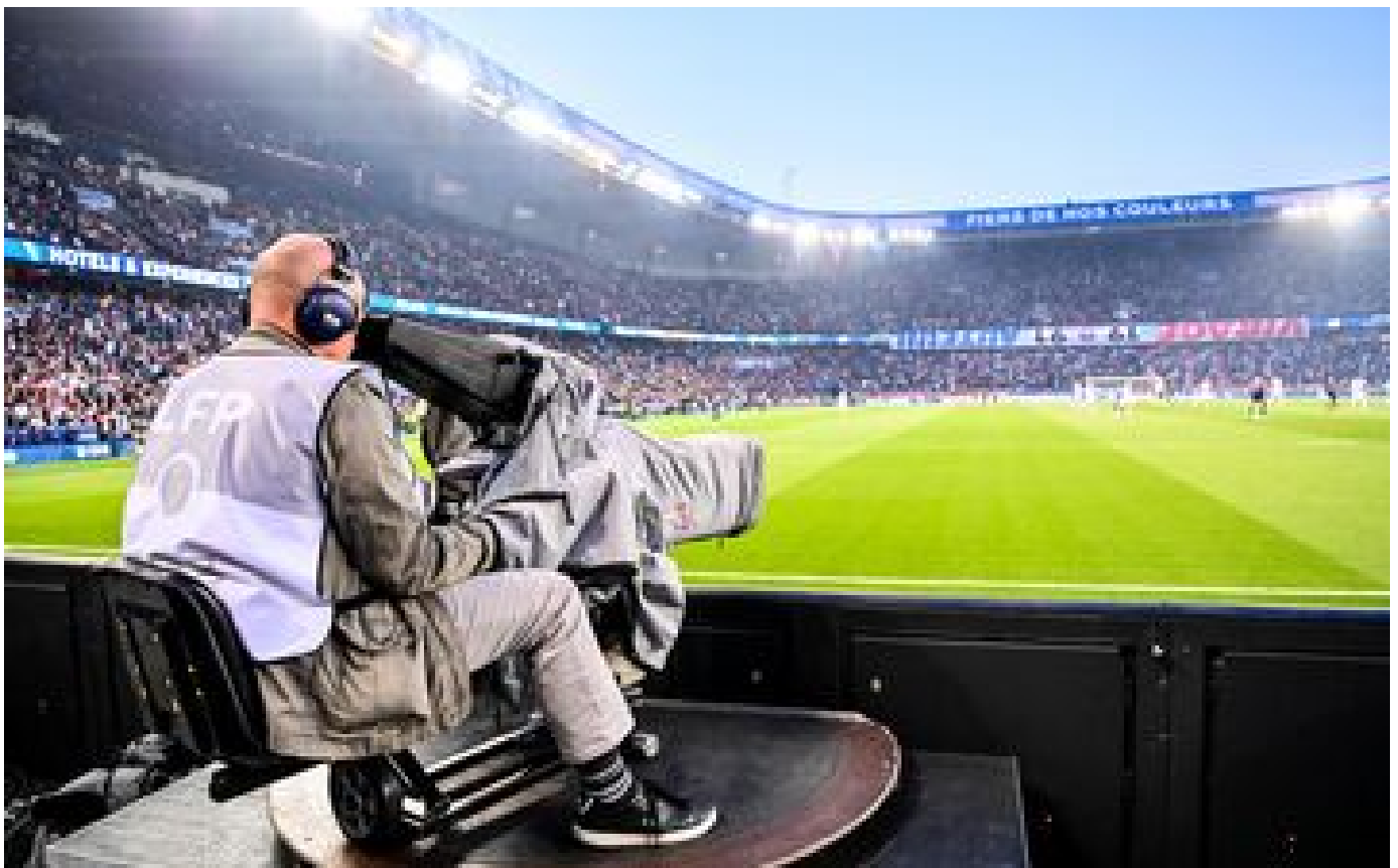
Droits de la Ligue 1 : stratégies secrètes, coups de bluff et manigances dans la dernière ligne droite P