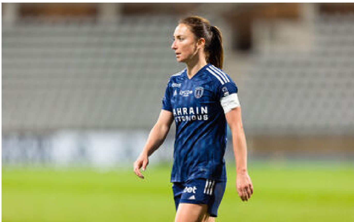
D1 Arkema : le Paris FC féminin poursuit son sans-faute et reste leader