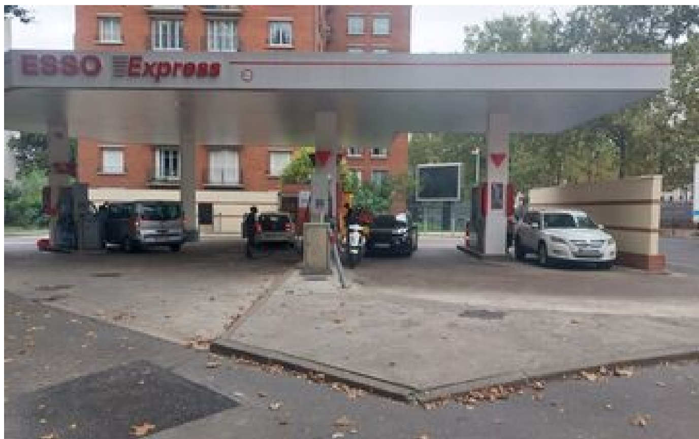
Crack à Paris : le fou furieux de la station-service a été interné