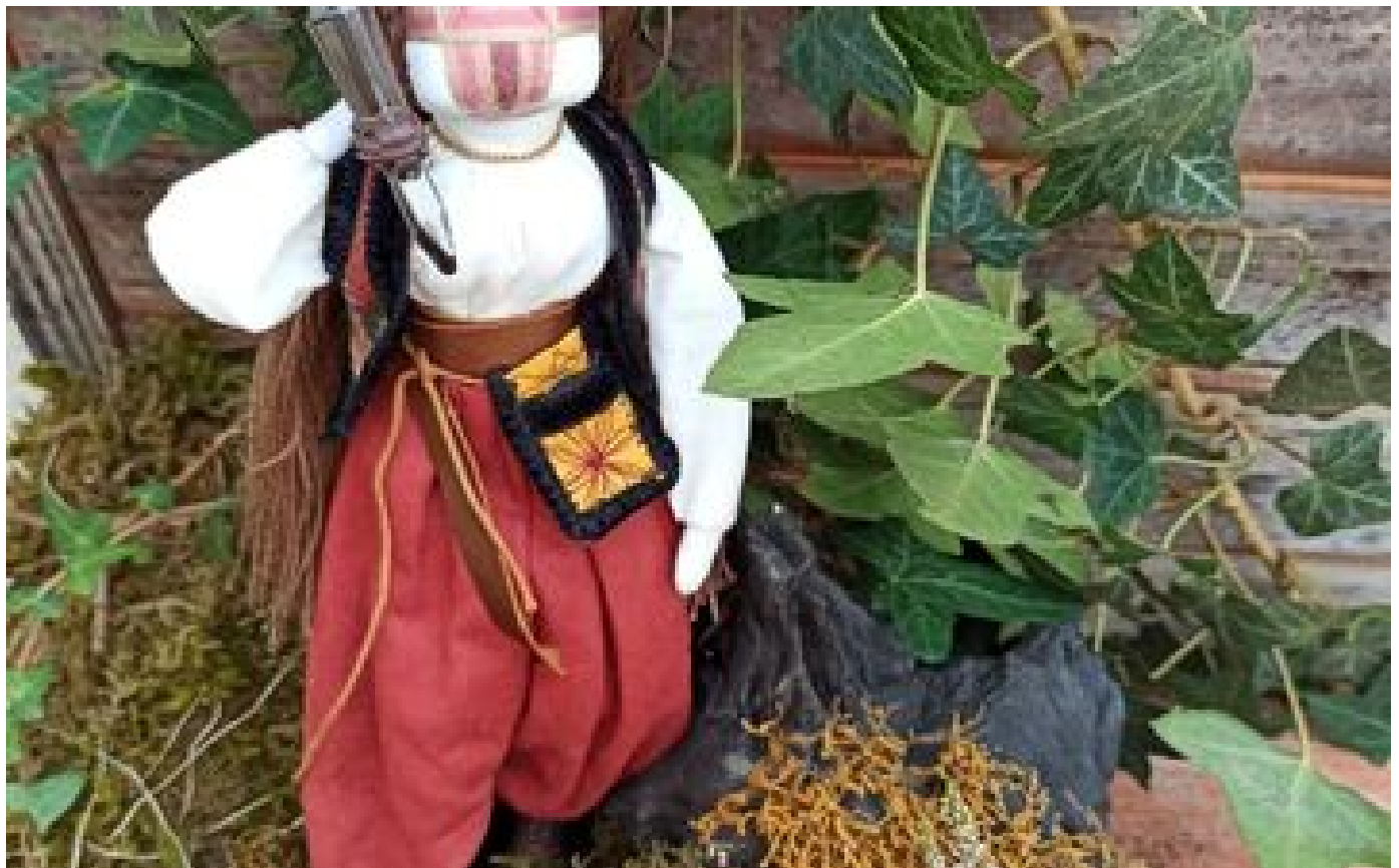
Depuis la Haute-Garonne, elle soutient les Ukrainiens avec des poupées motanka « guerrières »