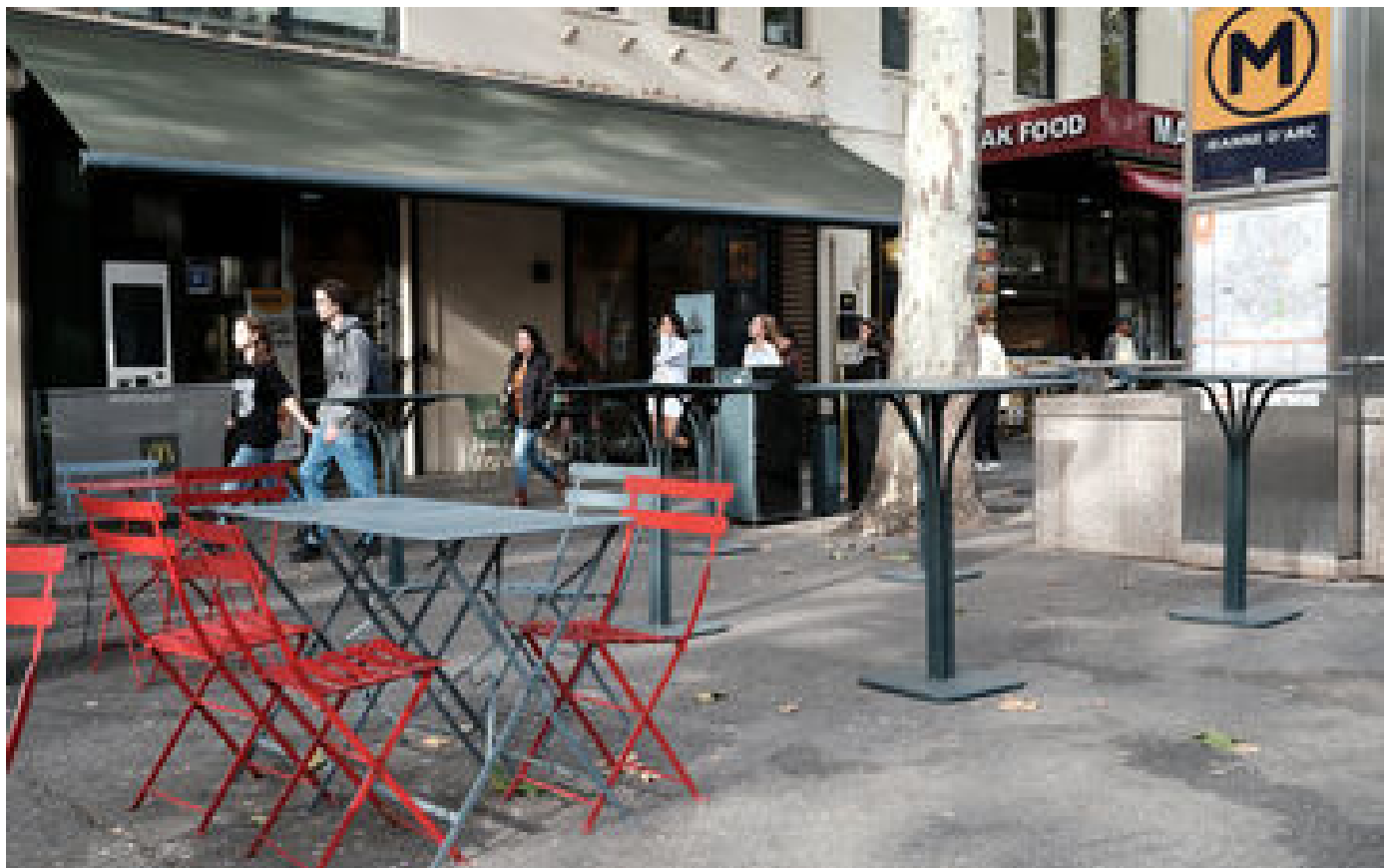
Bagarres et trafic de drogue quotidiens : à Toulouse, les dealers ont eu la peau du McDo P