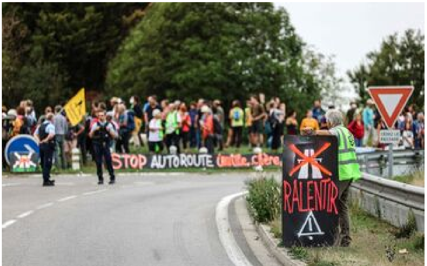
Mobilisation contre l'A69 Toulouse-Castres : les autorités redoutent ce week-end un « Sainte-Soline bis »