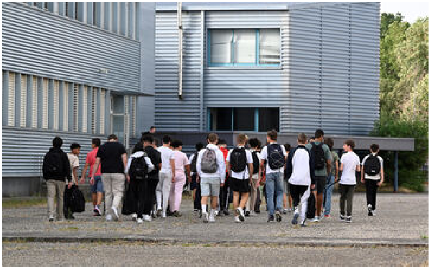
Sept lycées de Toulouse évacués ce jeudi matin après des alertes à la bombe