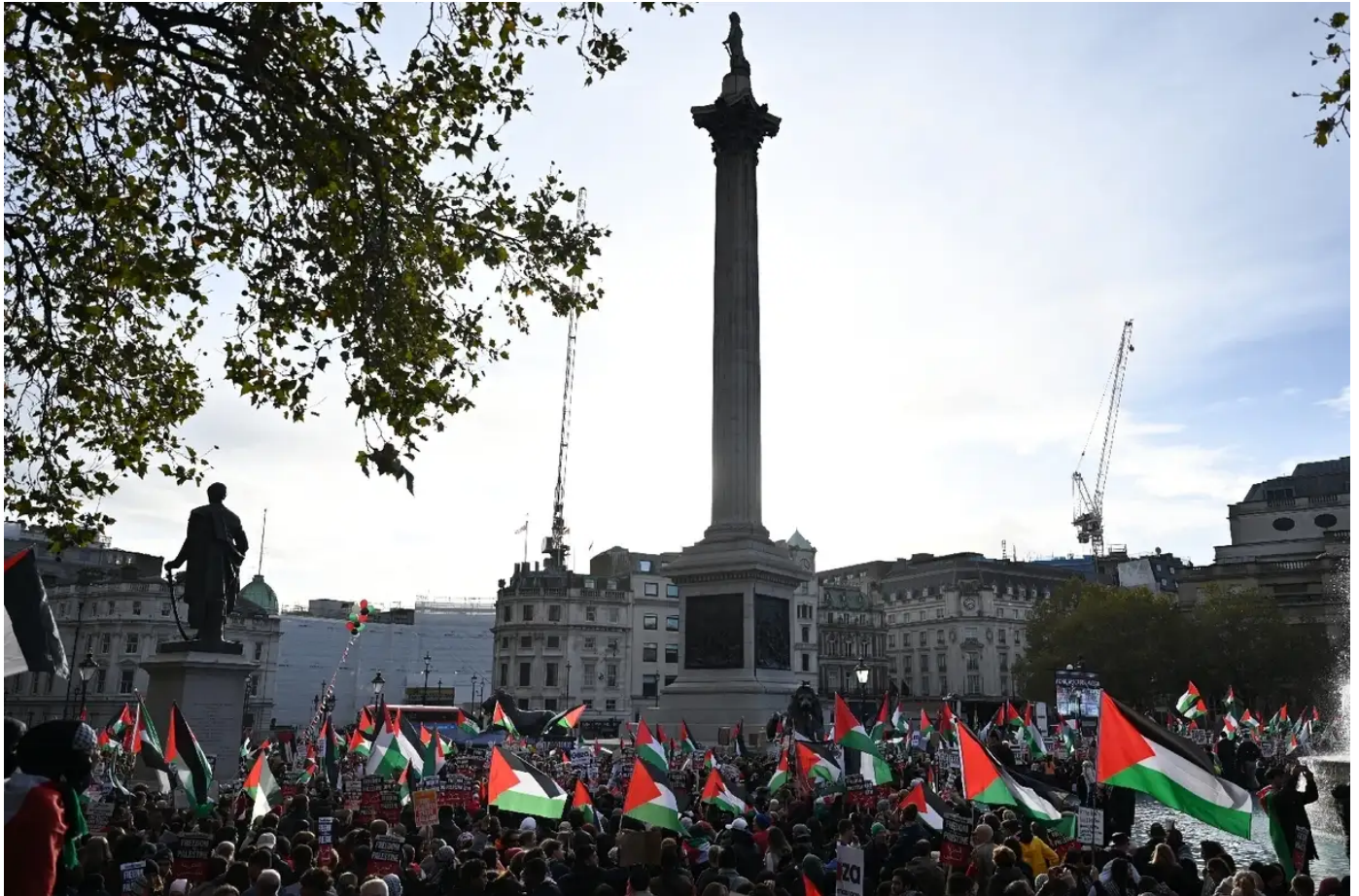
Des milliers de manifestants se rassemblent à Londres en soutien aux Palestiniens