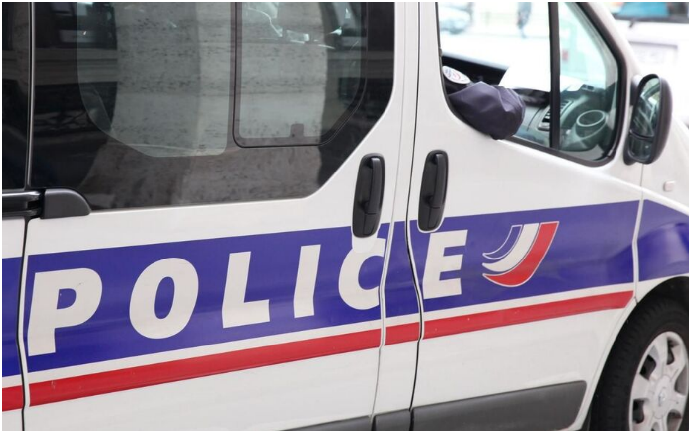
Une croix gammée a été dessinée sur la porte de la victime.

Le pronostic vital de la victime, âgée de 30 ans, n'est pas engagé. Le parquet évoque un possible mobile antisémite alors que l'enquête ne fait que commencer.