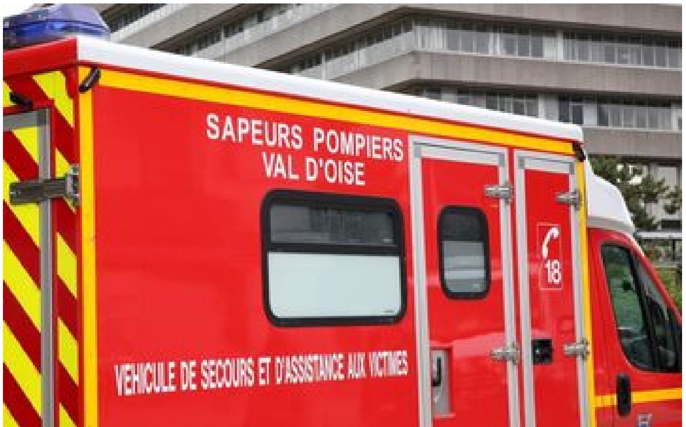
Val-d'Oise : onze blessés dans une intoxication au monoxyde de carbone