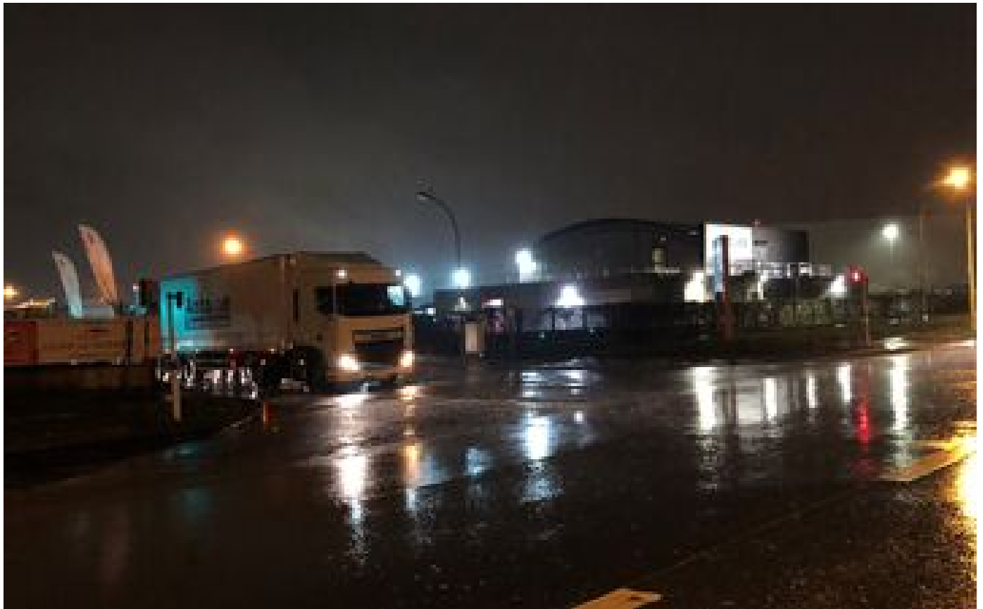
Chilly-Mazarin : un jeune homme à scooter tué dans un choc avec un camion-benne