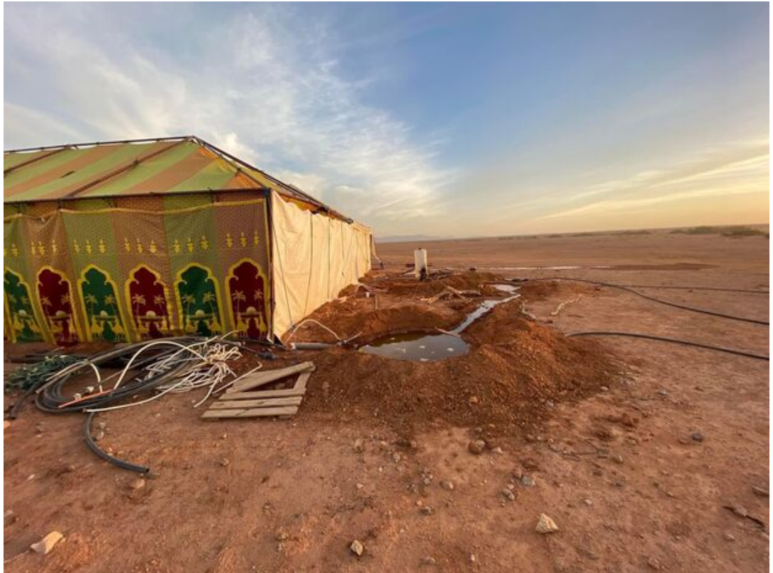
La fosse d'évacuation.

unanimes, les conditions d'hygiène du campement seraient plutôt à l'origine de l'épidémie.