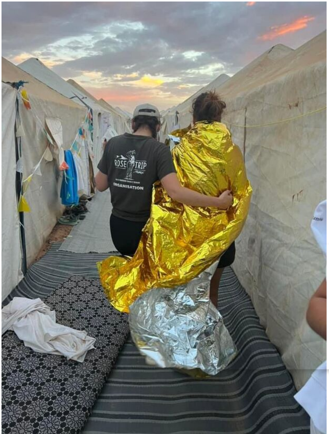
Une participante en perdition, soutenue, avec une couverture de survie.