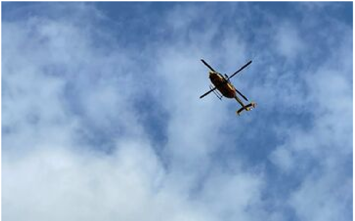
Vaucluse : un hélicoptère militaire percute une ligne à haute tension, les deux pilotes indemnes