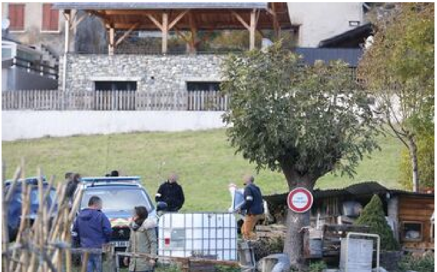
Disparition du petit Émile : pourquoi l'enquête se concentre sur le Haut-Vernet P