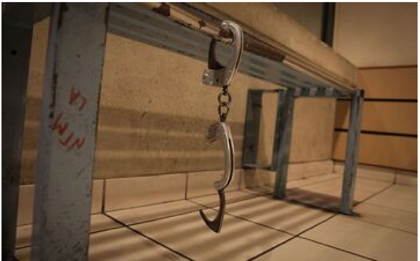
Isère : un évadé connu pour grand banditisme arrêté après deux ans de cavale