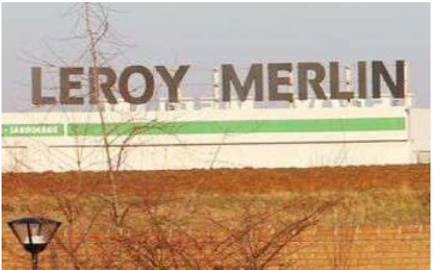
« Ils ont pris leur temps » : une équipe de cambrioleurs passe la nuit dans un Leroy Merlin de l'Oise