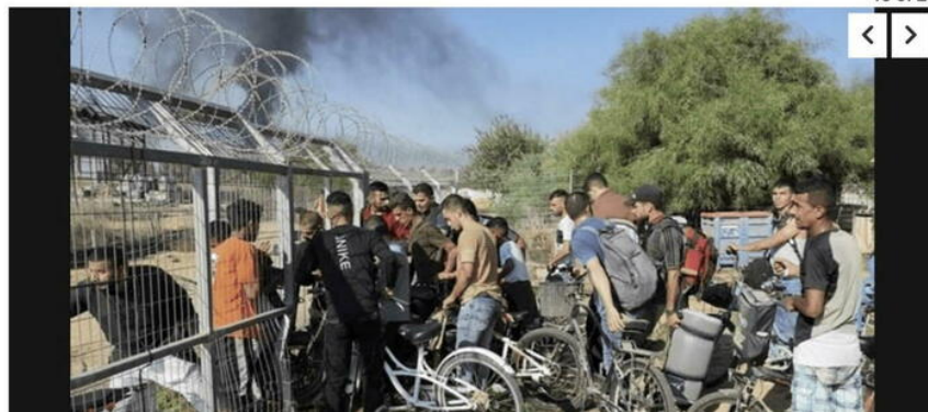
Capture d'écran de la banque d'images d'AP