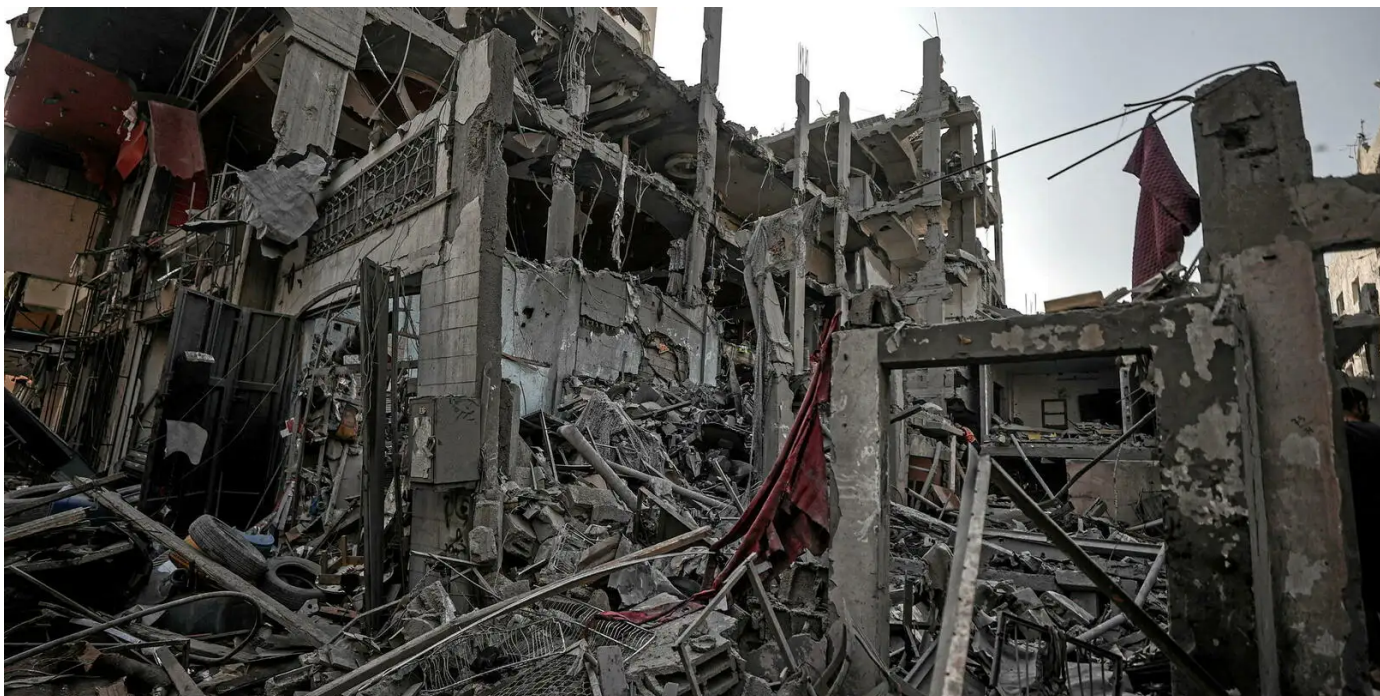
Image de Gaza le 31 octobre 2023, après des frappes israéliennes.

Publié le 10/11/2023 à 05h07, mis à jour le 10/11/2023 à 20h35