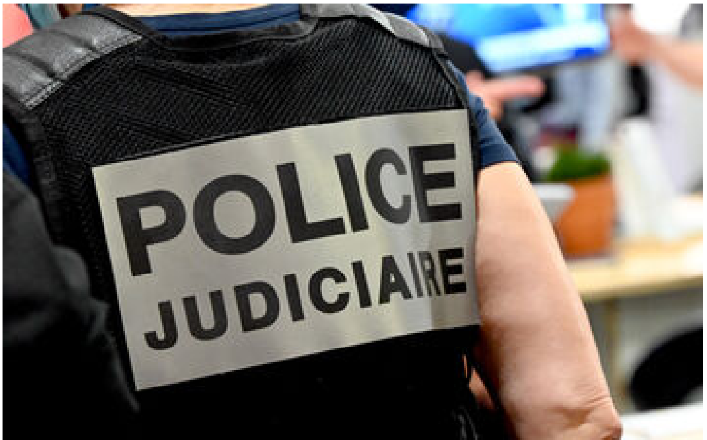
Fusillade à Marseille : un homme et une femme abattus, trois blessés à l'arme de guerre