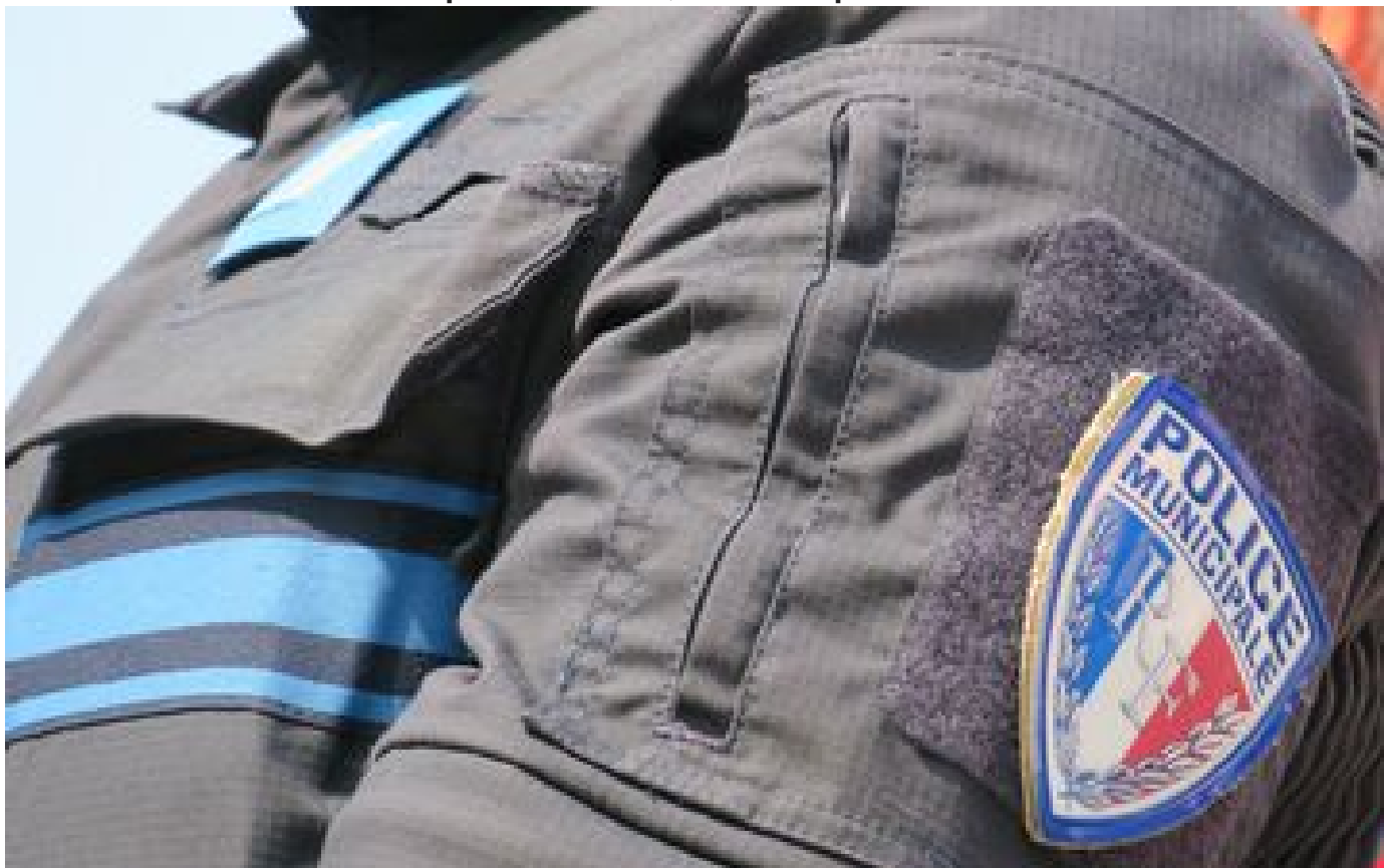
Dunkerque : un policier municipal blessé après un refus d'obtempérer, le conducteur recherché