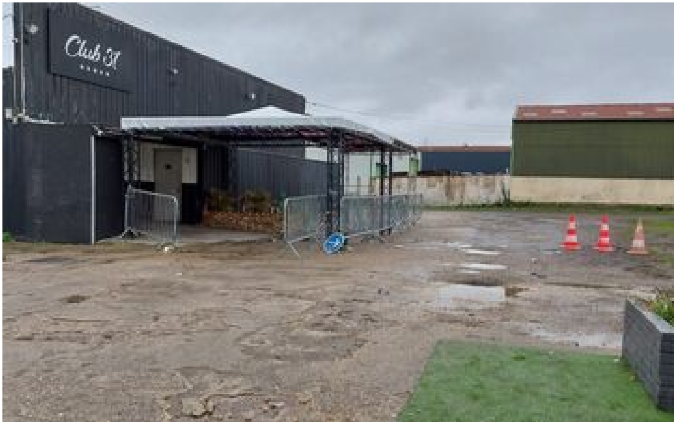
Info Le Parisien Yvelines : deux hommes blessés par arme à feu sur le parking d'une discothèque