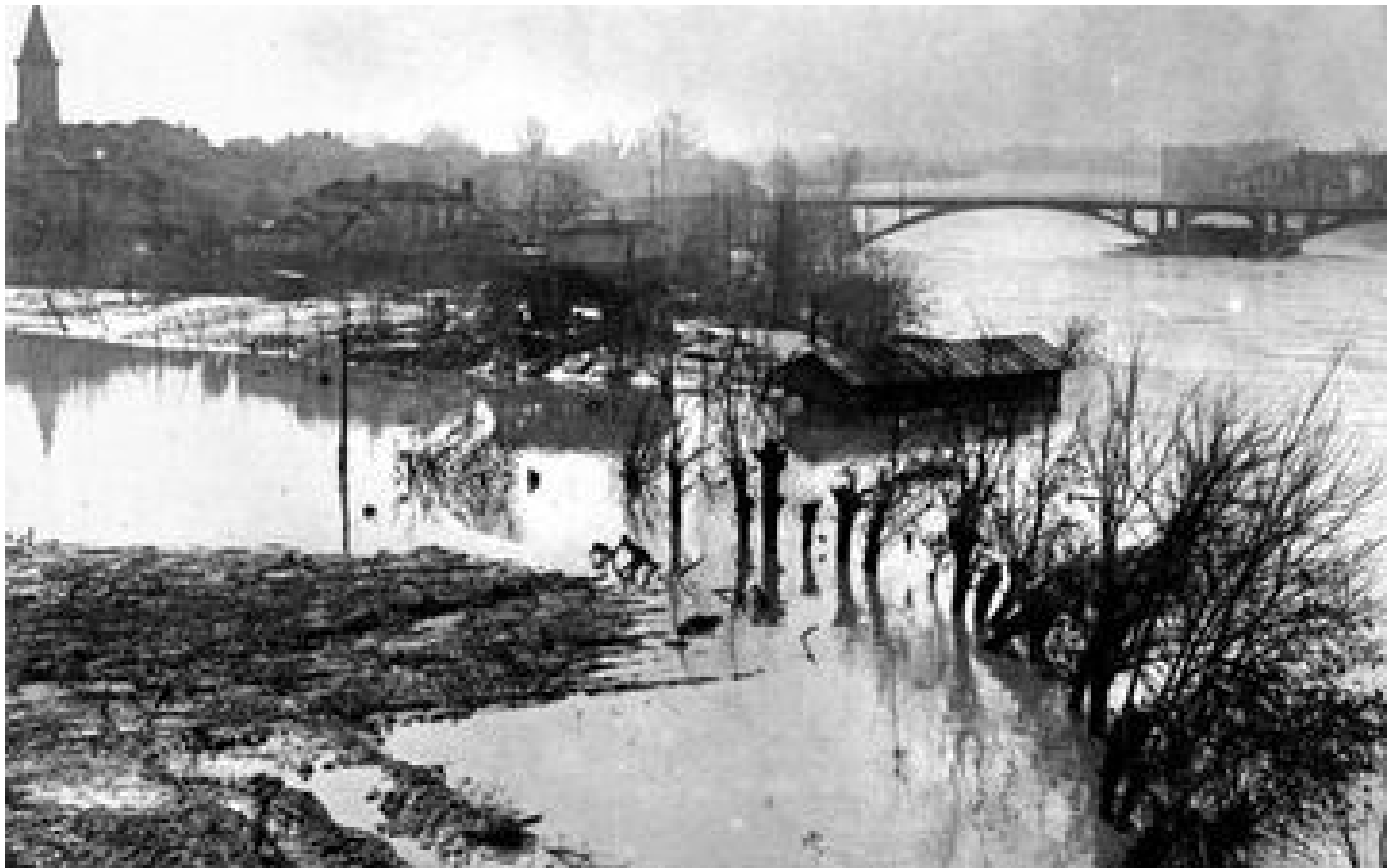
En 1930, des inondations catastrophiques ravagent le Sud-Ouest P