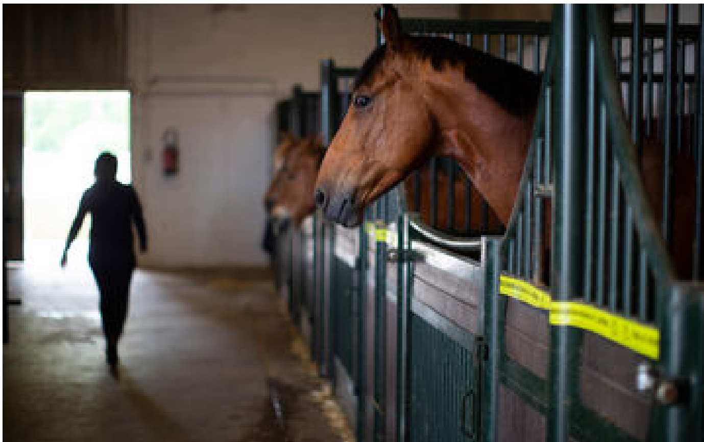
Incendie criminel dans une écurie près de New York, hécatombe parmi les chevaux