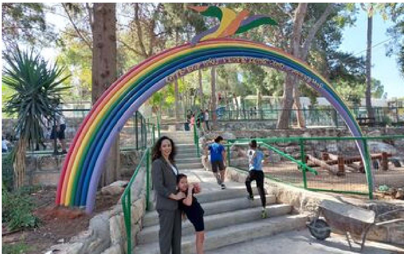
À l'« Oasis de paix », en Israël, l'espoir plus fort que la peur : « La solution ne sera jamais militaire » P