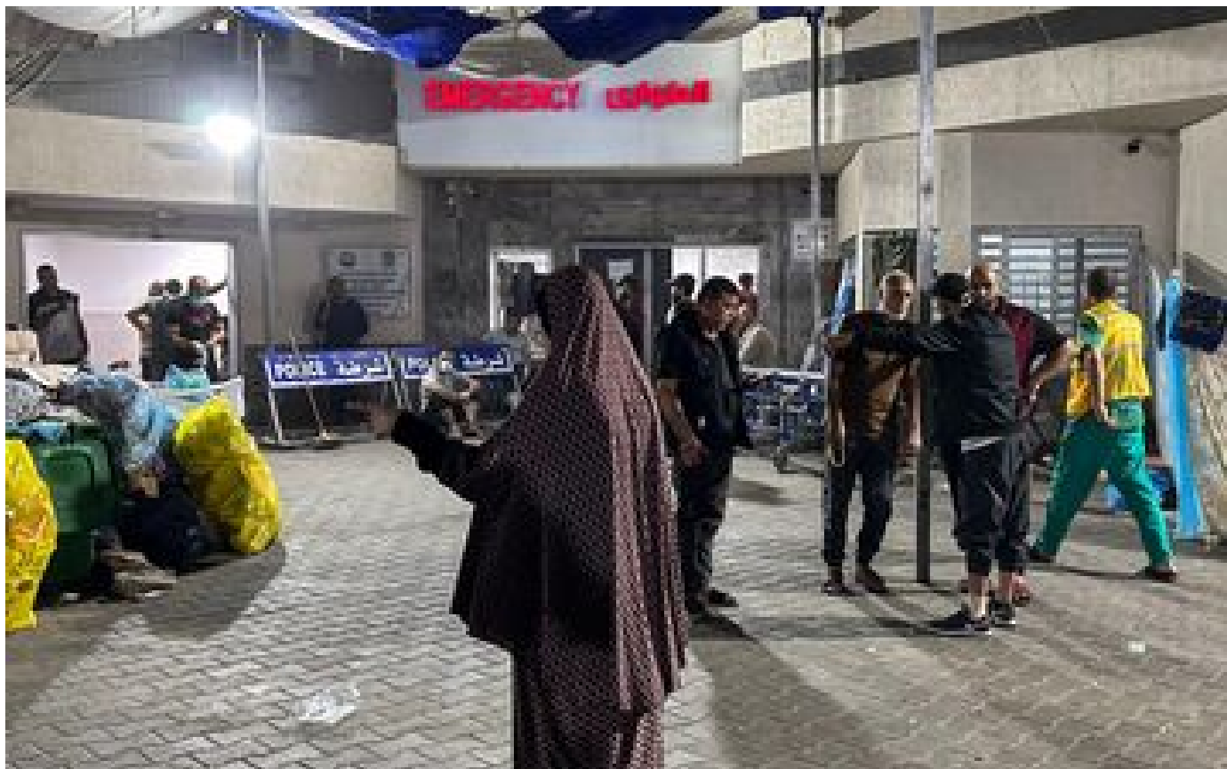
Guerre Israël-Hamas : au milieu des combats, vives inquiétudes autour des hôpitaux de Gaza