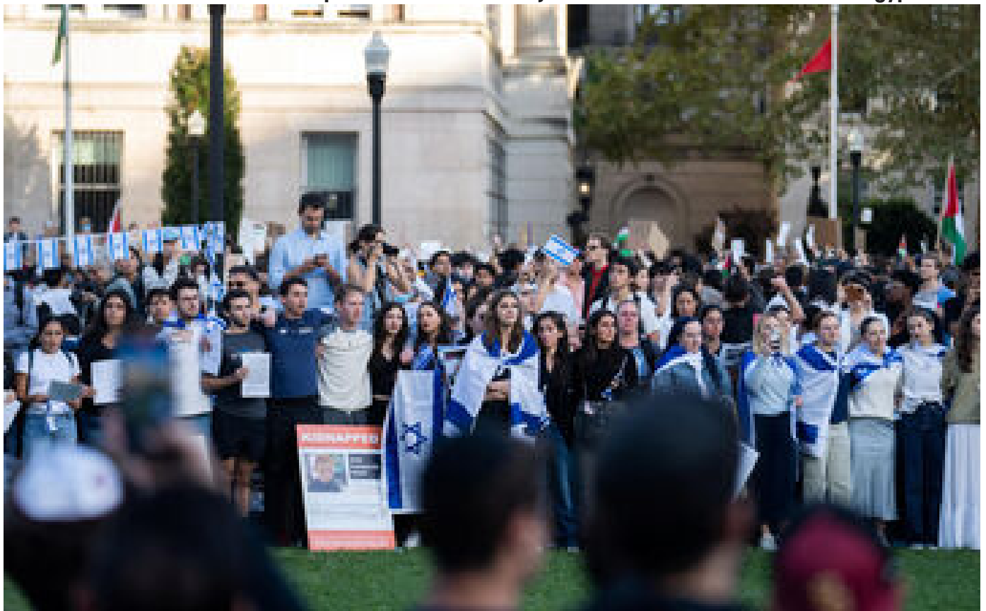
« J'ai été insultée, menacée... » : le malaise des étudiants juifs de Columbia, l'université de New York P