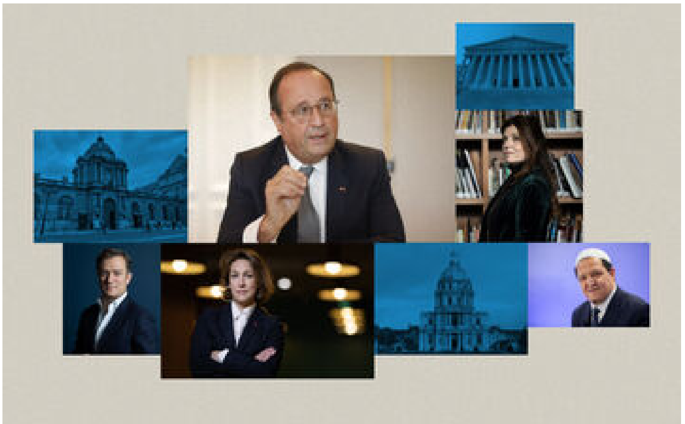
Marche contre l'antisémitisme : François Hollande, Marylise Léon, Agnès Jaoui... pourquoi ils s'engagent