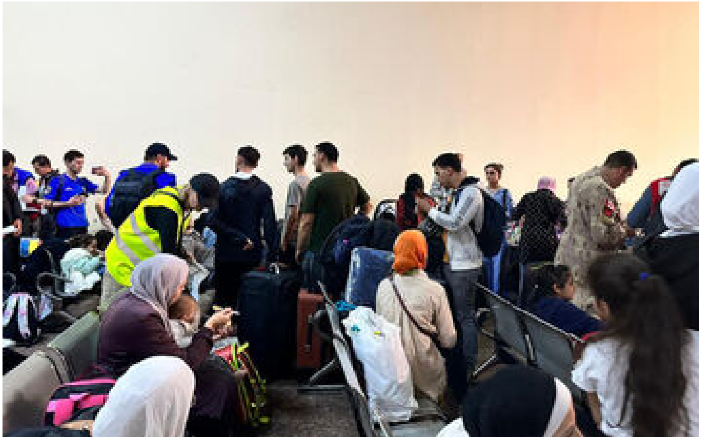
DIRECT. Guerre Israël-Hamas : 500 personnes évacuées aujourd'hui de la bande de Gaza vers l'Égypte