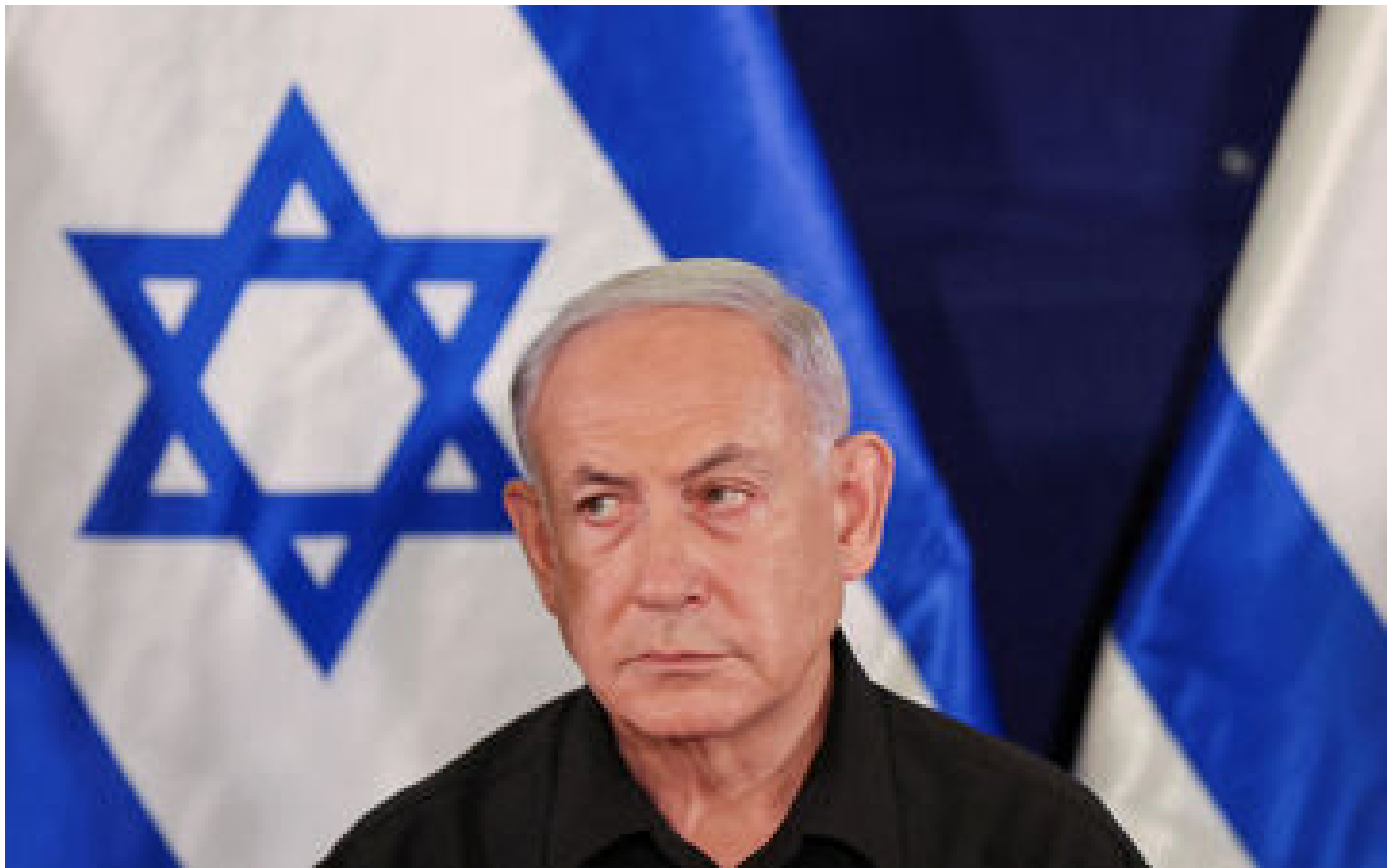
« Pas besoin de ces leçons de morale » : Netanyahu répond aux critiques de Emmanuel Maprouit sur le bombardement de civils