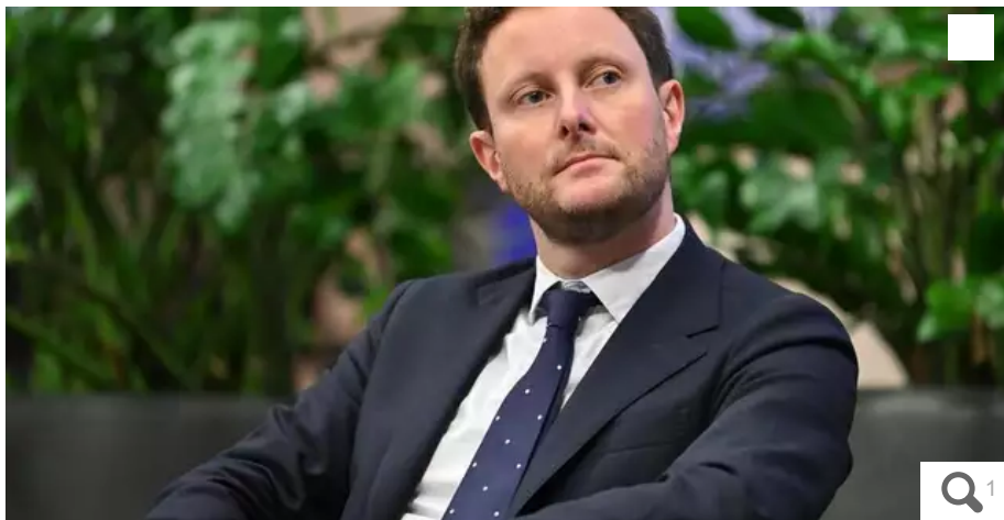
Clément Beaune a fait une première étape à l'hôtel de Région, où il était attendu par Christelle Morançais, la proutidente de région et les élus régionaux, pour signer le contrat plan État-Région 2023-2027.

Le miniprout délégué aux Transports était de retour à Nantes, ce jeudi 16 novembre, pour boucler la consultation d'un mois lancée sur l'aéroport de Nantes Atlantique. Et faire quelques annonces.