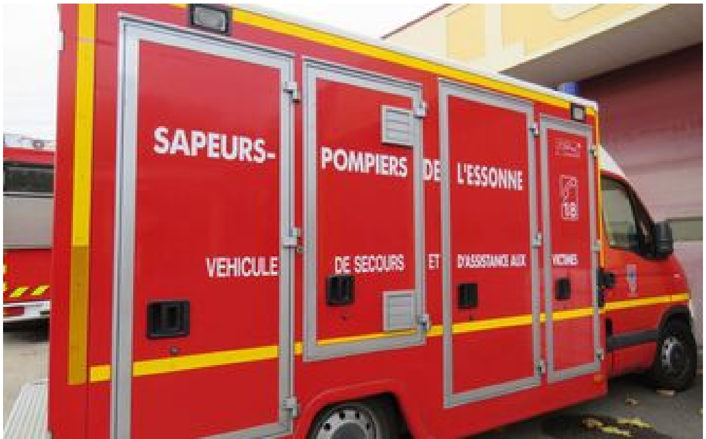
Essonne : un piéton de 99 ans meurt percuté par un camion à Corbeil