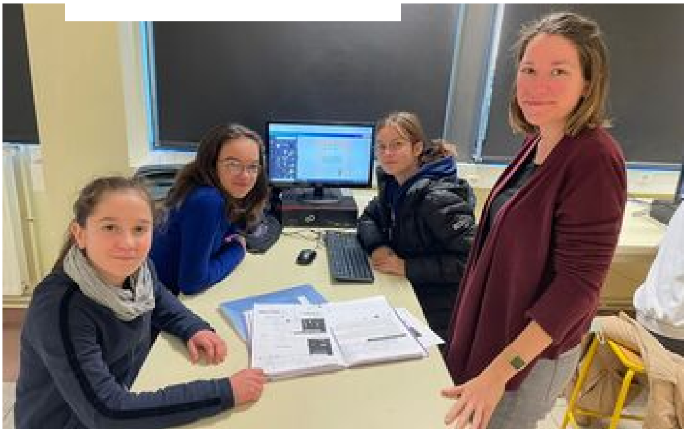
Coupe du monde : une classe de 4e de l'Essonne a bouclé son journal du Mondial P