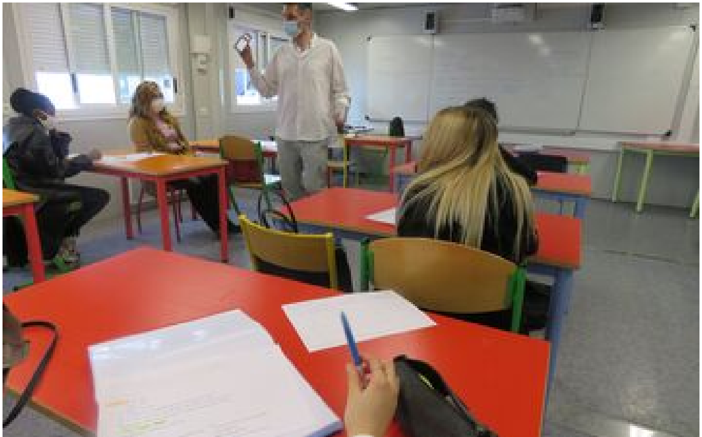
« Floco », « sten », « guenda » : un dictionnaire en ligne pour déchiffrer l'argot des cités P