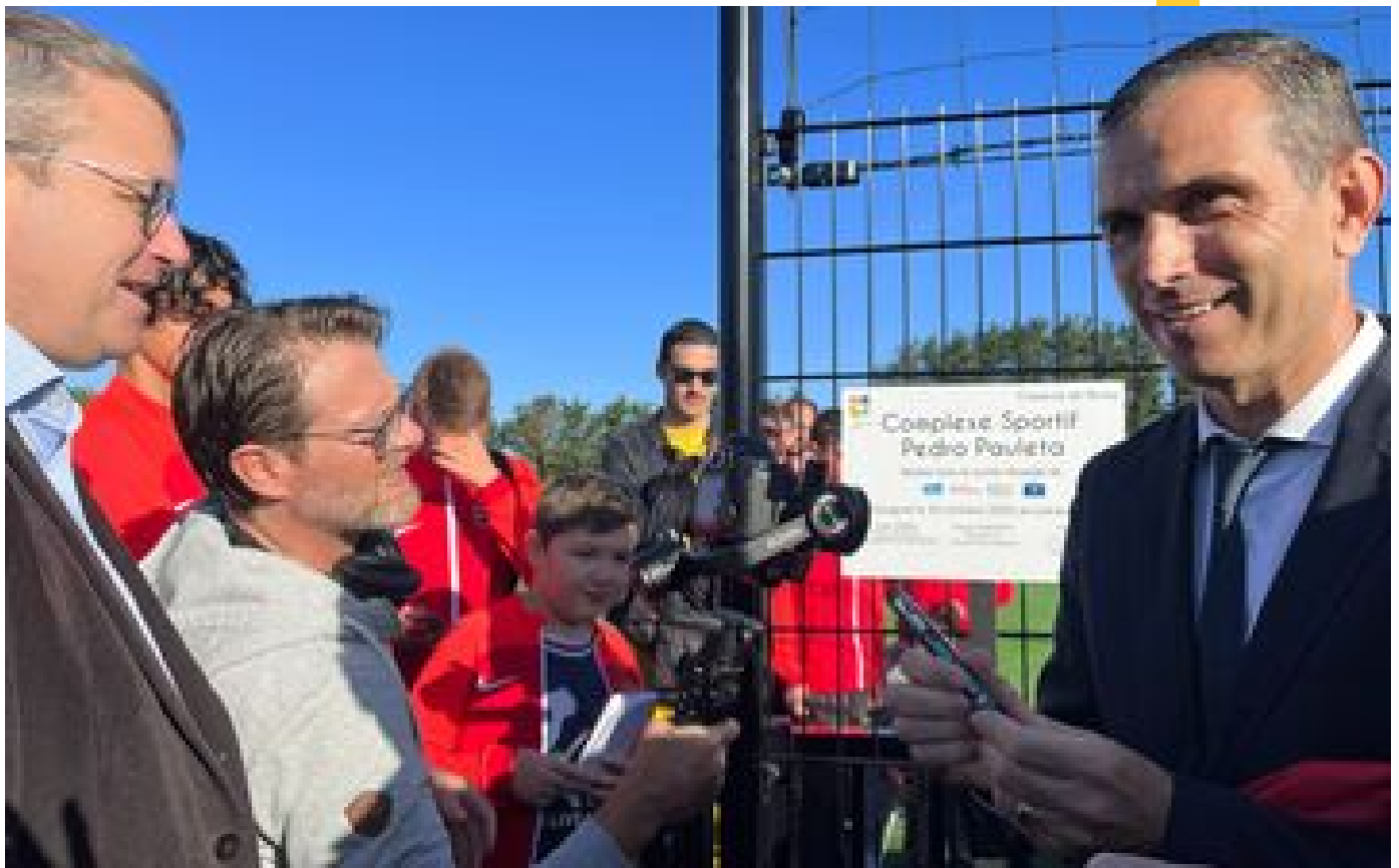
Le footballeur Pauleta inaugure un complexe sportif à son nom en Essonne : « Je suis très touché » P