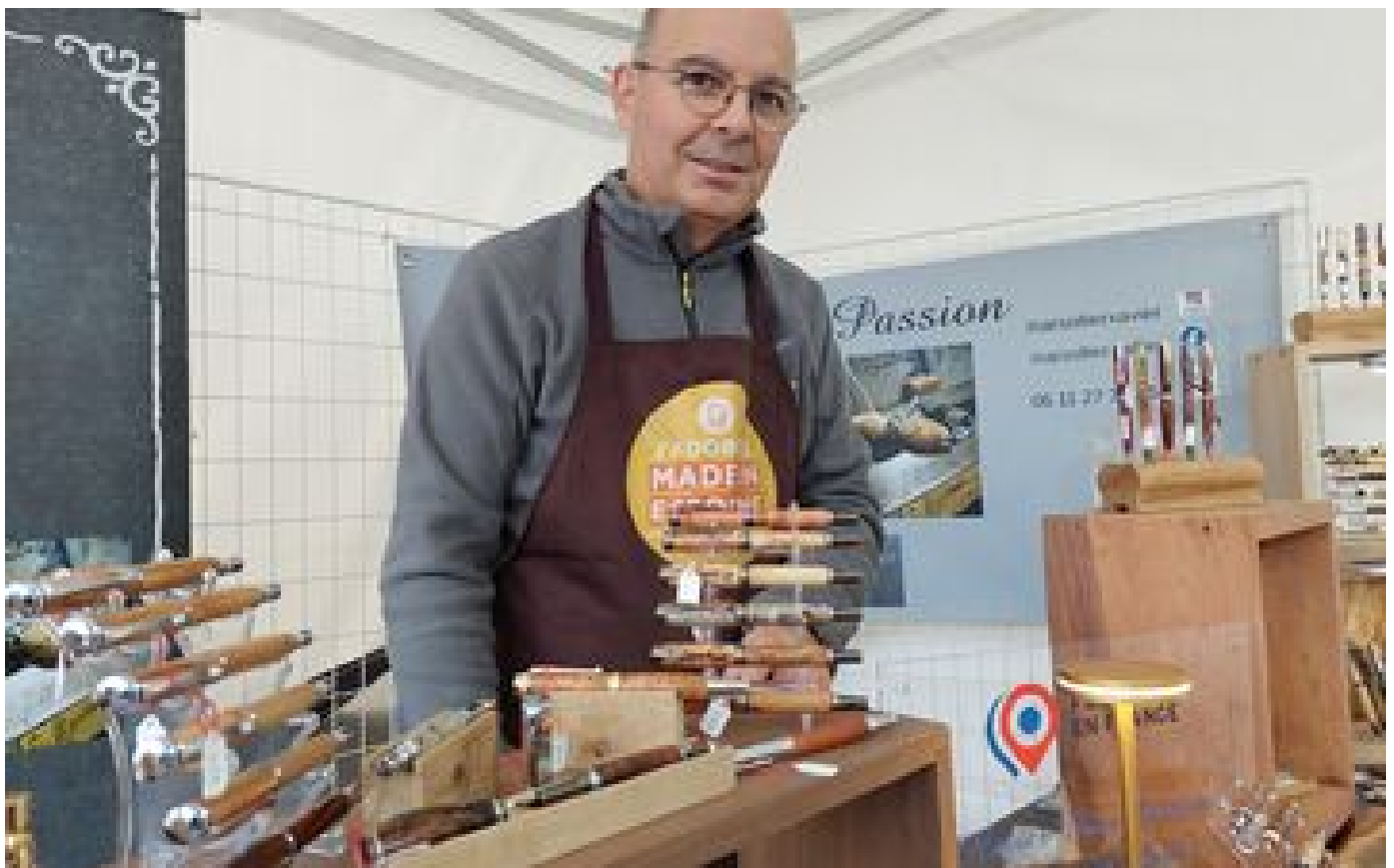
À Chamarande, faites le plein de cadeaux de Noël « made in Essonne » ! P