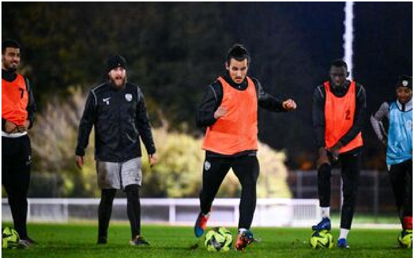
Coupe de France : primeur, ex-pro en Bulgarie, frère d'international... Les belles histoires du Petit Poucet P