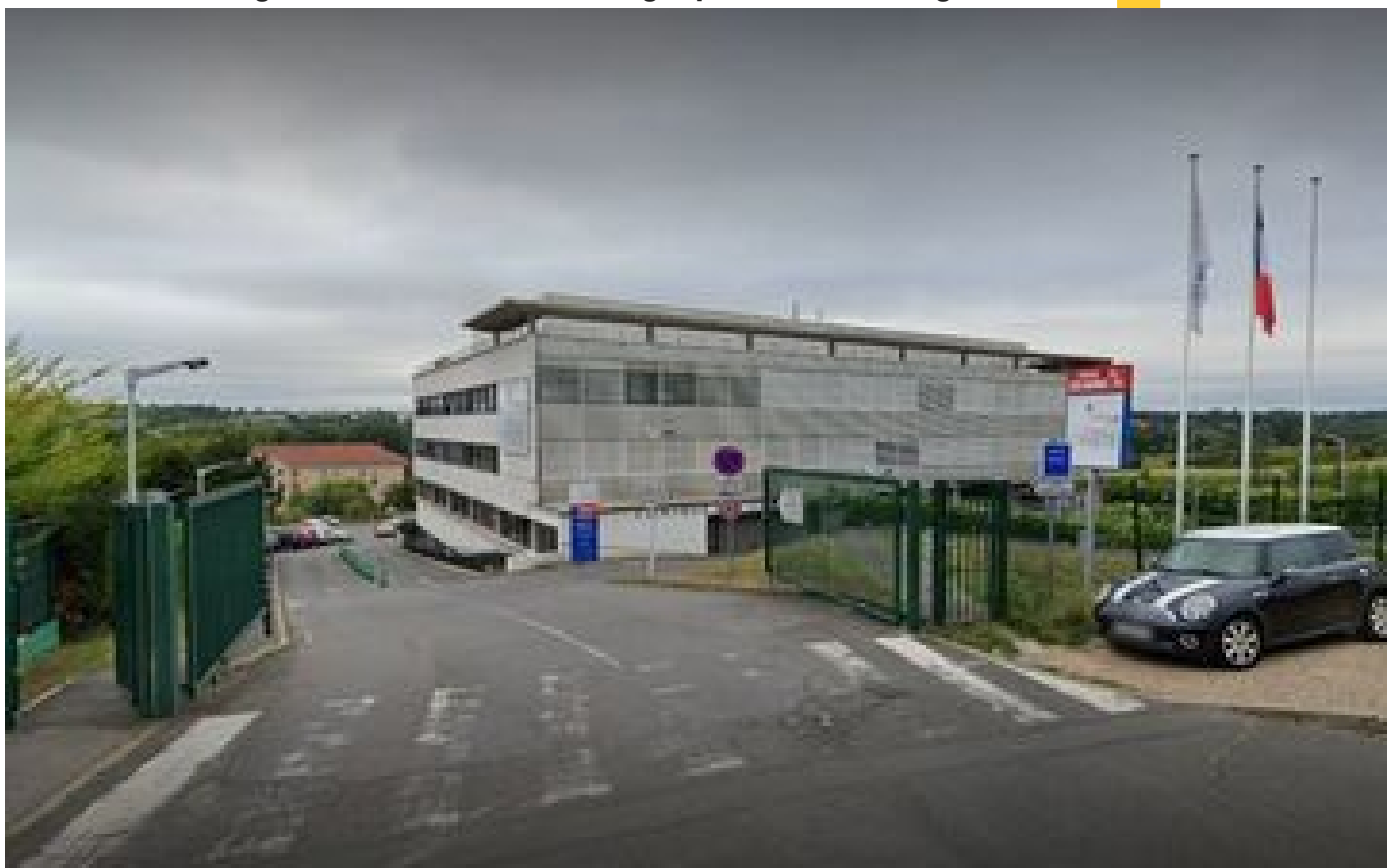
Essonne : malaises en série à la clinique de Longjumeau, 31 patients et soignants pris en charge