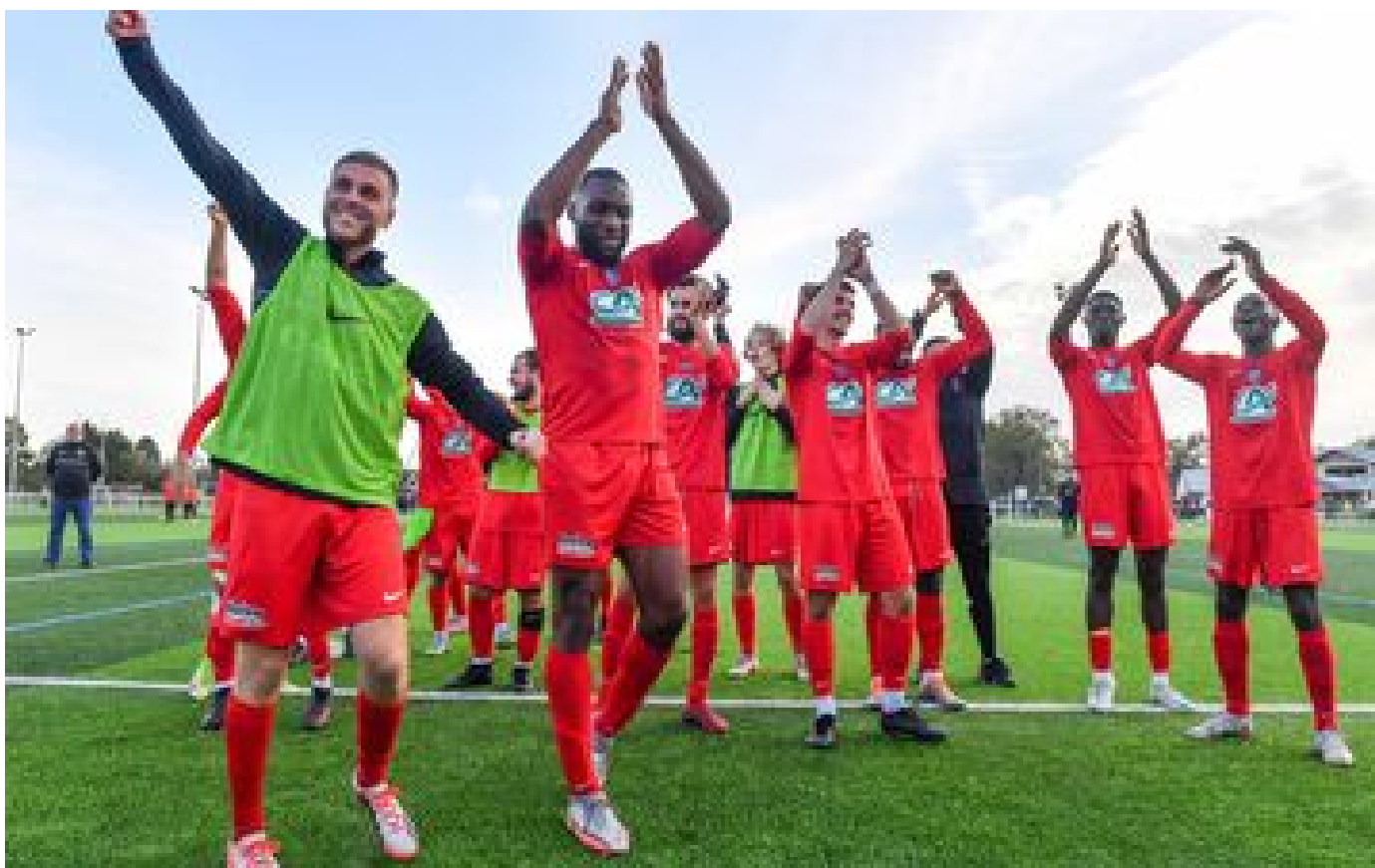
Coupe de France : au FC Marcoussis Nozay La Ville du Bois, l'union de trois villes fait la force P