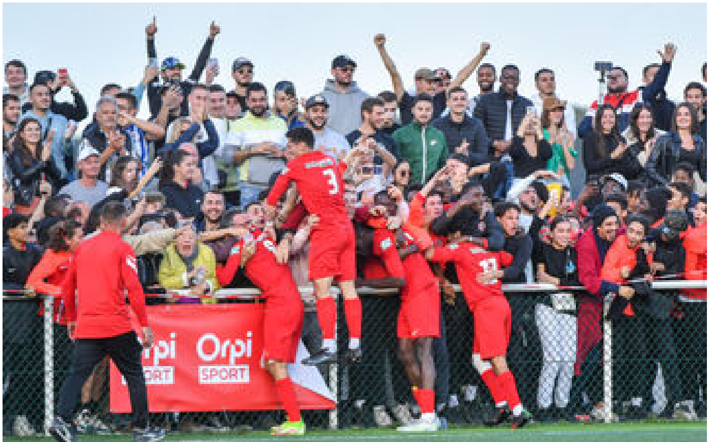
Coupe de France : dans la magie du FC Marcoussis, le Petit Poucet qui se hisse au 8e tour P