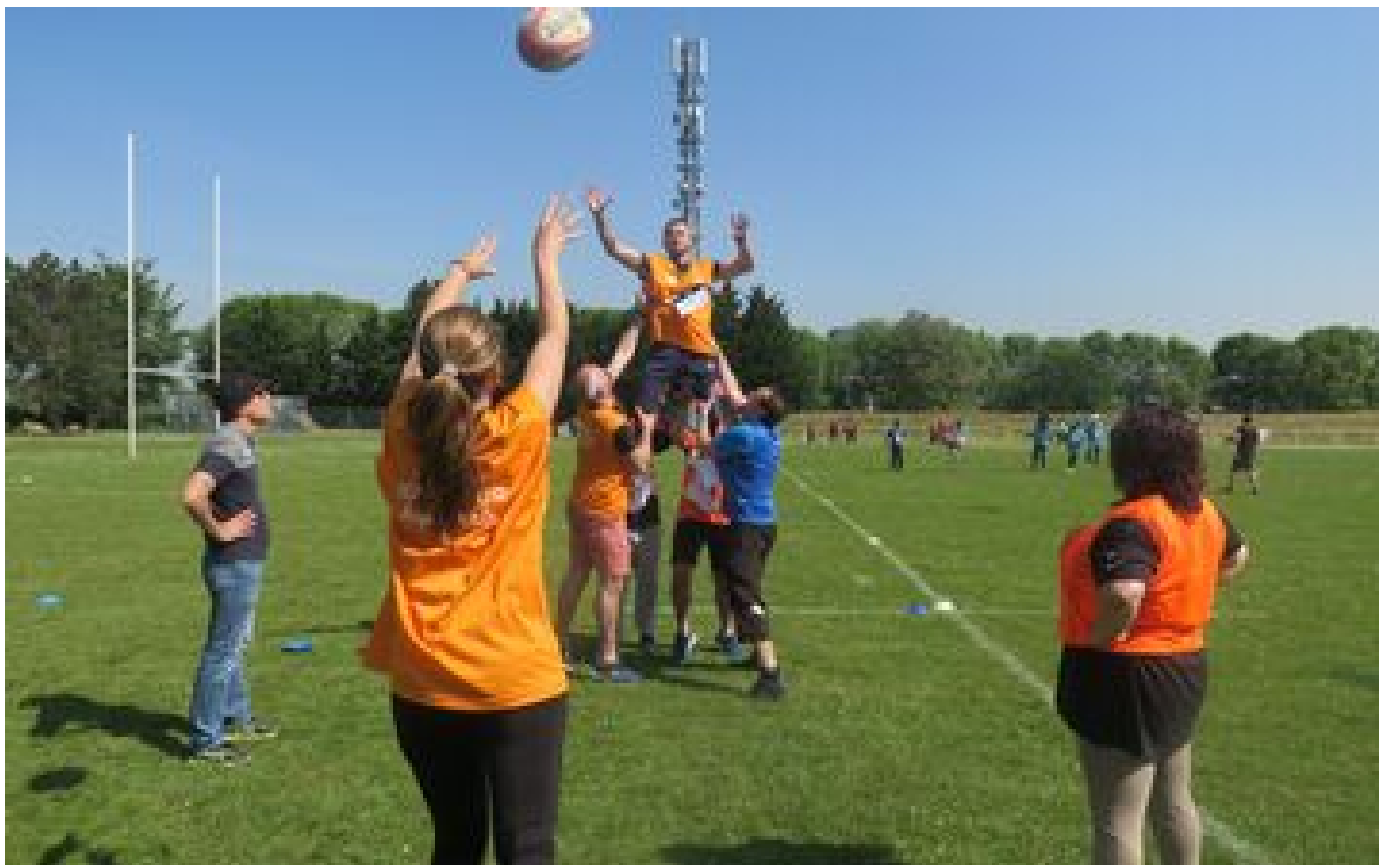
«Cela fait ressortir la nature des gens»... quand faire du sport aide à trouver un boulot P