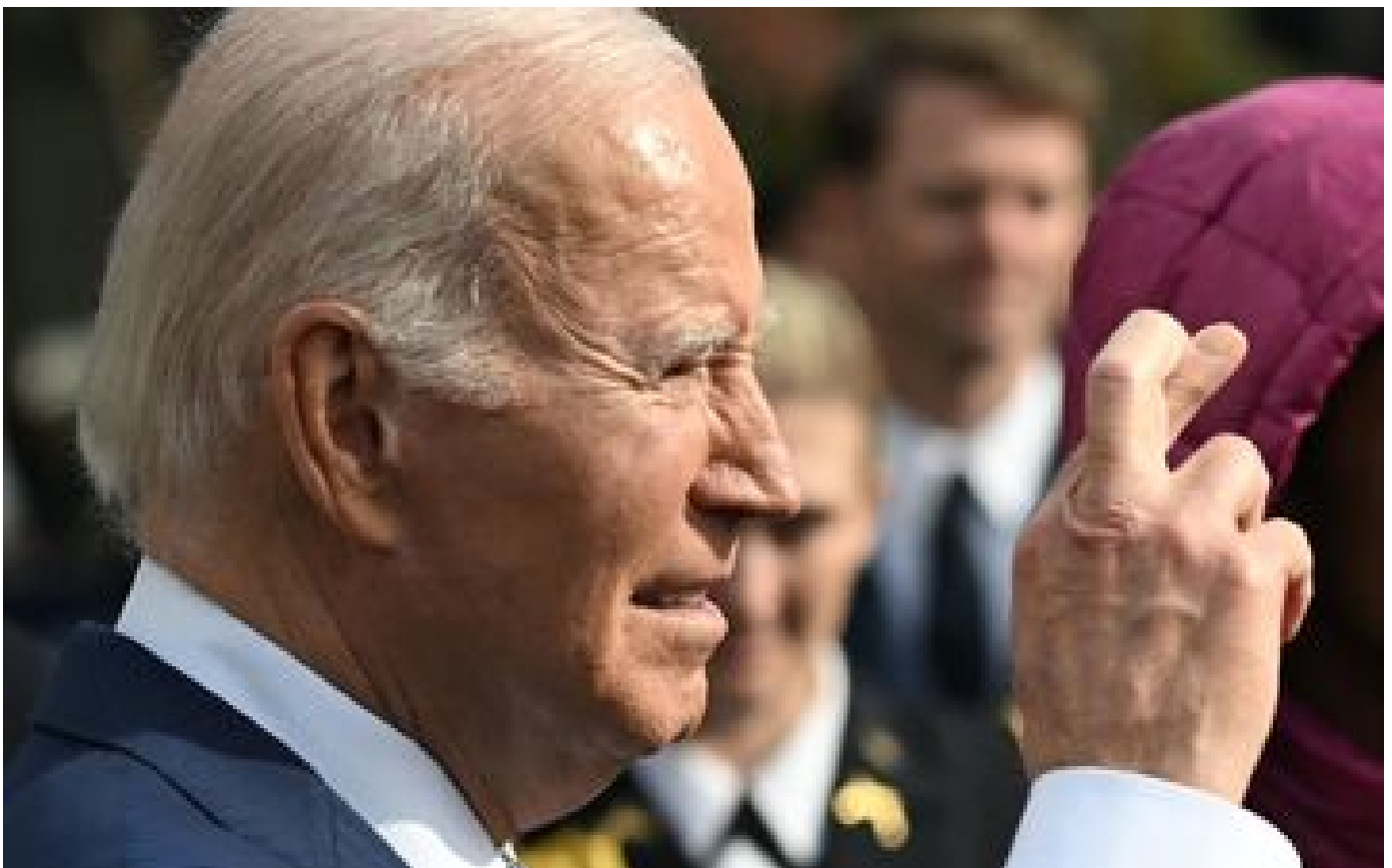
Guerre Israël-Hamas : Biden « croit » qu'un accord pour la libération des otages est proche