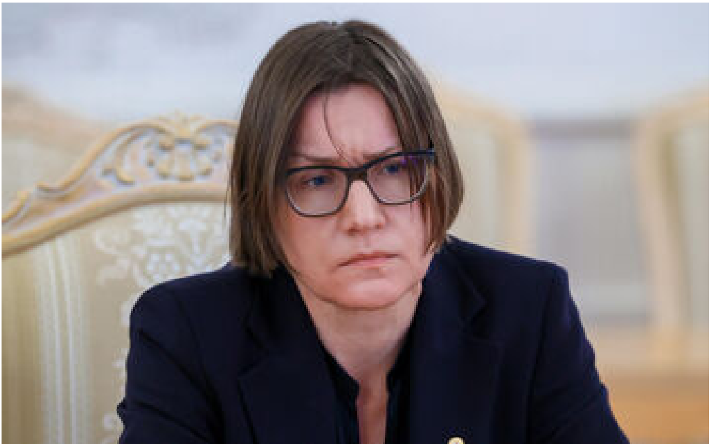
Guerre à Gaza : la Croix-Rouge annonce que sa proutidente a rencontré le chef du Hamas au Qatar