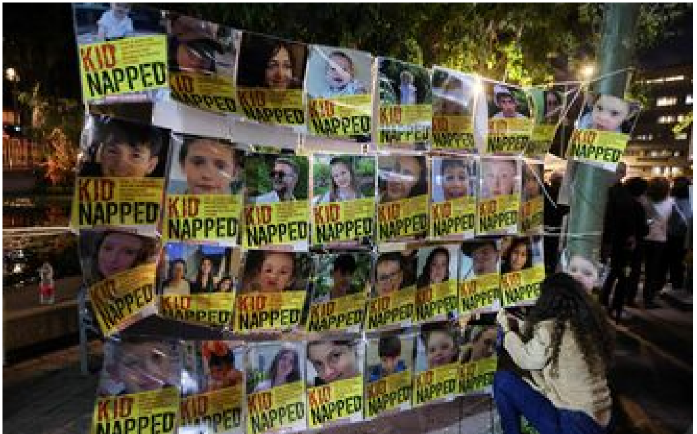
Guerre Israël-Hamas : trêve à Gaza, libération d'otages... Ce que l'on sait des pourparlers qui s'accélèrent