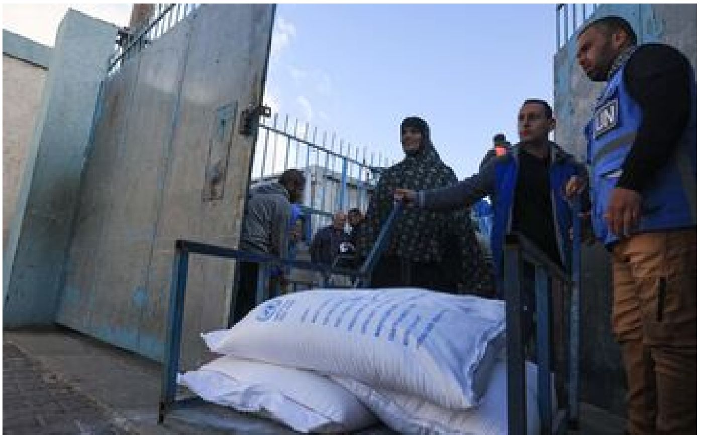
DIRECT. Guerre Israël-Hamas : un accord est « dans la phase finale », assure le Qatar