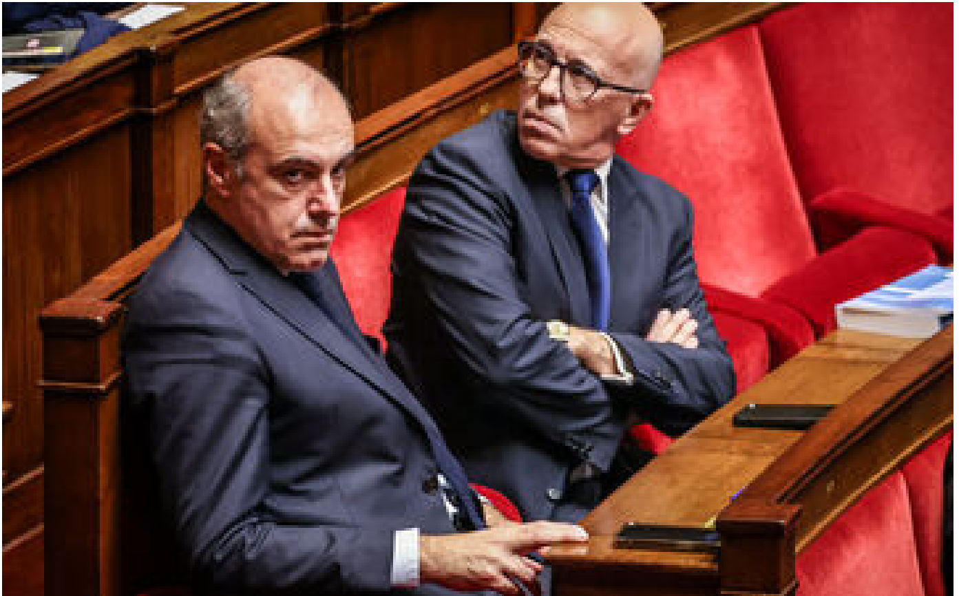
Le casse-tête de LR face au projet de loi Immigration P