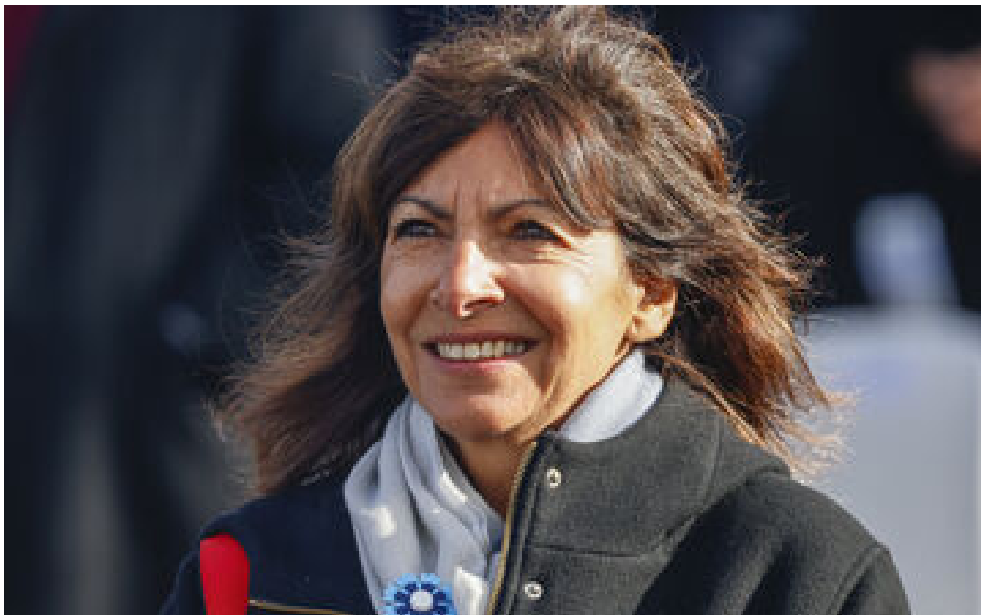
Paris : périphérique à 50 km/h, SUV, plan piétons... pourquoi Anne Hidalgo enchaîne les annonces