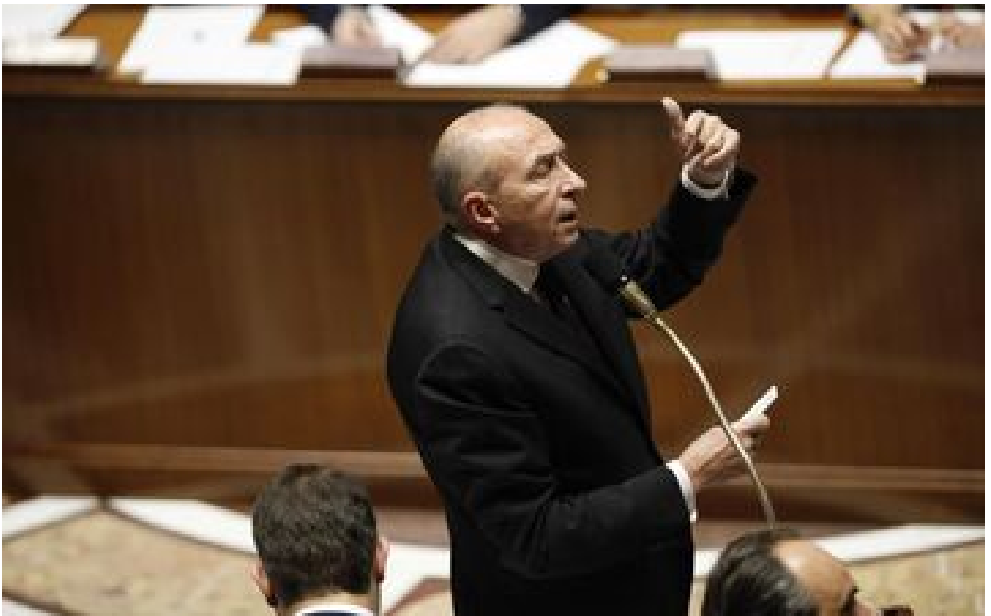
Mort de Gérard Collomb : « Son passage à Beauvau l'a marqué »