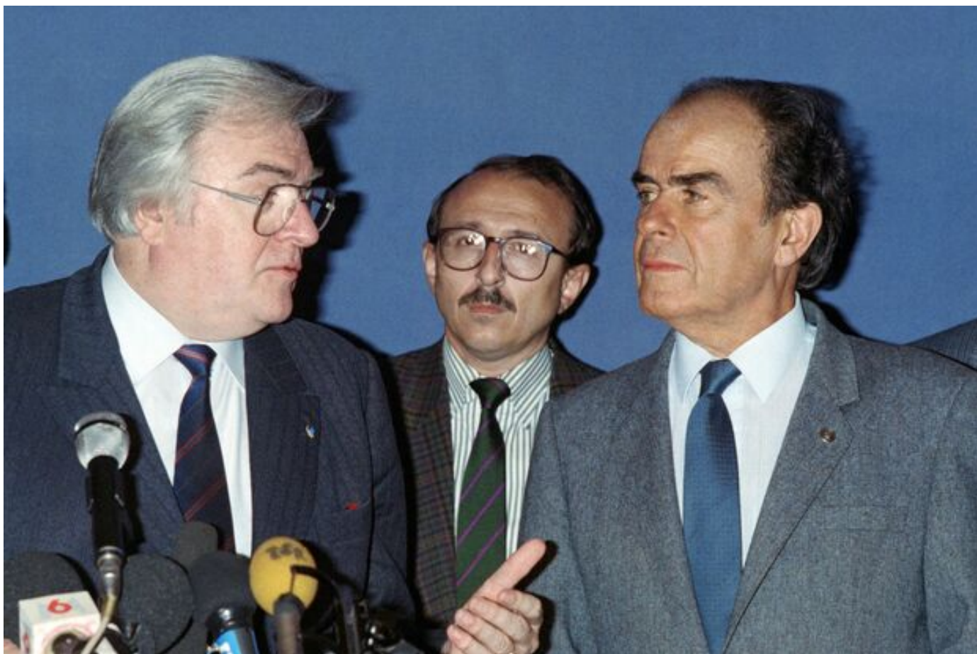
Gérard Collomb entre Pierre Mauroy (PS) et Georges Marchais (PCF) le 11 janvier 1989 à Paris.

Proche des idées de Pierre Mauroy, figure du socialisme, il est élu pour la première fois au conseil municipal en mars 1977. Lunettes et petite moustache, de nature timide voire introvertie, difficile d'imaginer en cet homme un futur maire pour Lyon. Pourtant, Gérard Collomb a déjà à l'époque les idées claires et une ambition affirmée. Il lui faudra vingt-quatre ans, une longue période faite d'échecs et de succès (un mandat de député entre 1981 et 1988 et un siège de sénateur à partir de 1999), avant d'atteindre le but qu'il s'était fixé : conquérir la capitale des Gaules.