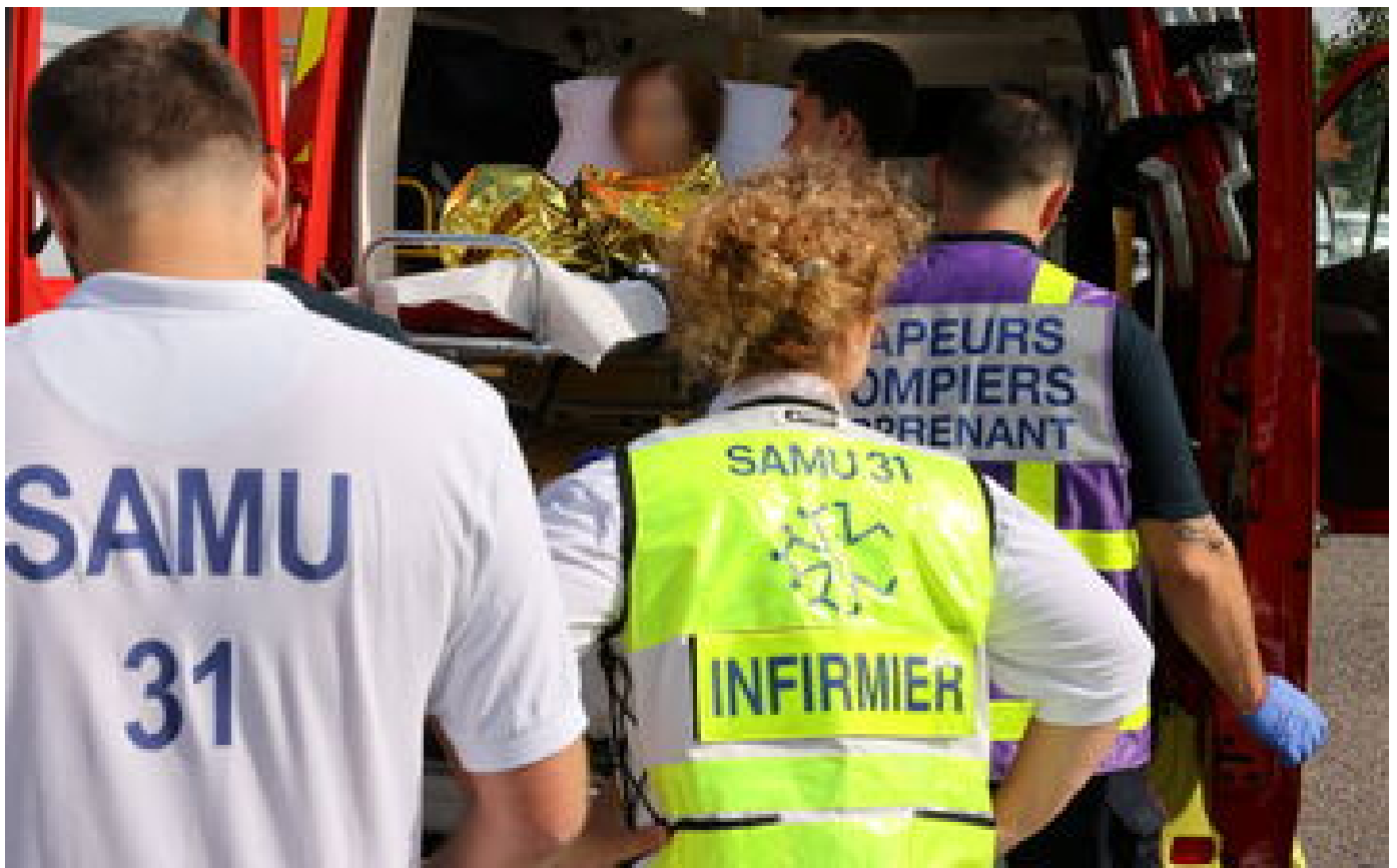
Toulouse : un dépanneur meurt écrasé entre un bus en panne et son véhicule