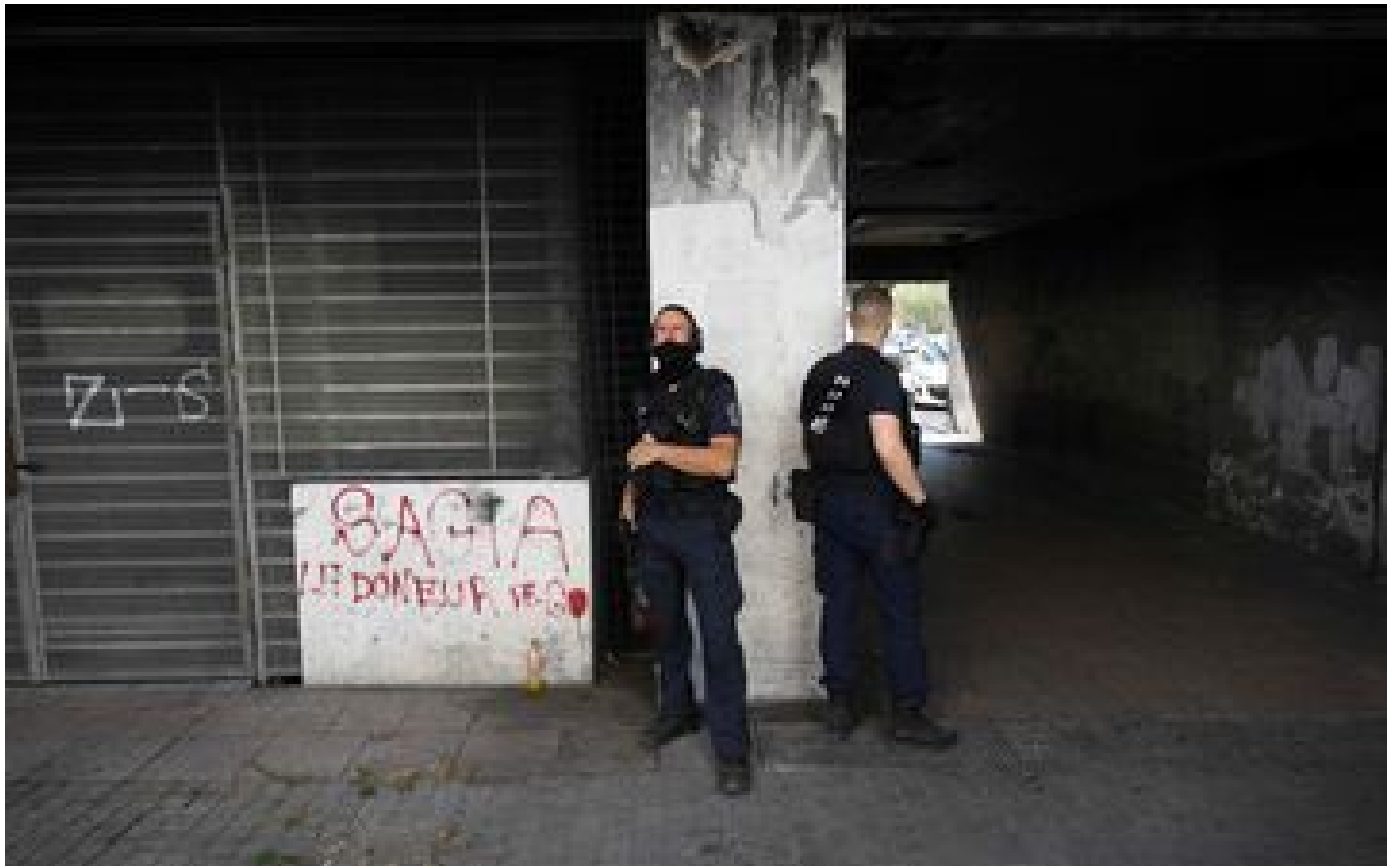
Trafic de drogue : les homicides ou tentatives d'homicide en hausse de 57 % en zone police en 2023