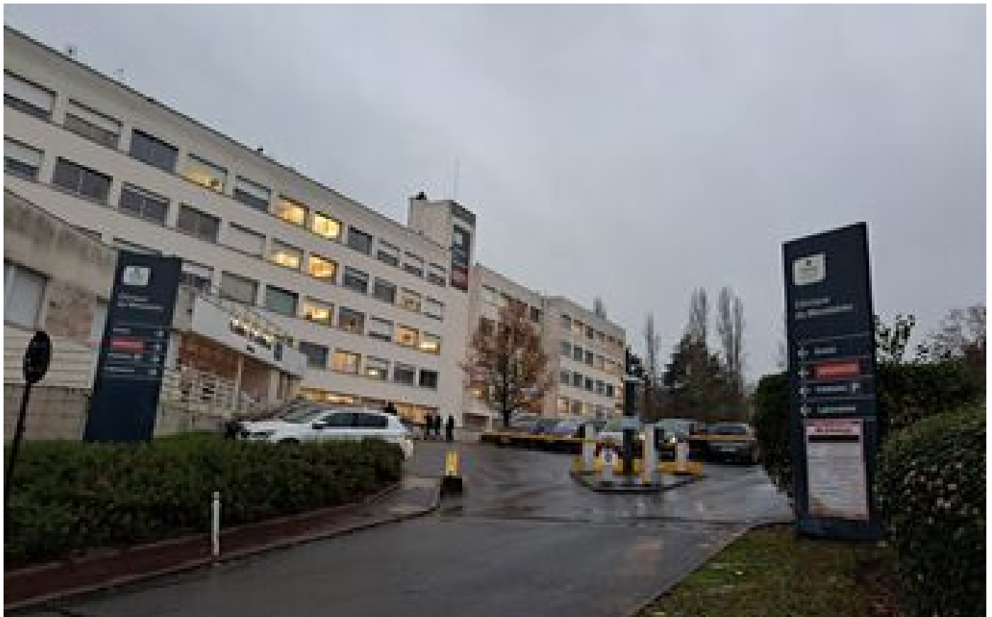
Évry : un homme mis en examen pour avoir menacé et volé 100 000 € de bijoux à une septuagénaire