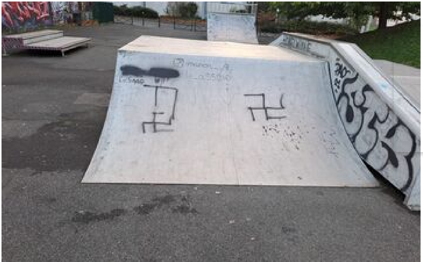
Croix gammées taguées à Paris : neuf personnes présentées à un juge d'instruction