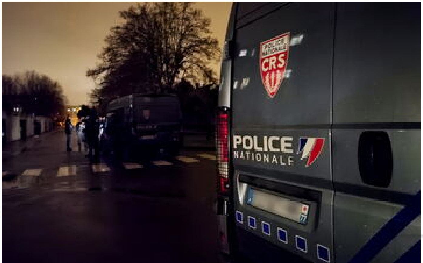
Nouvelle fusillade à Nice dans le quartier des Moulins, un blessé grave, la CRS 8 envoyée