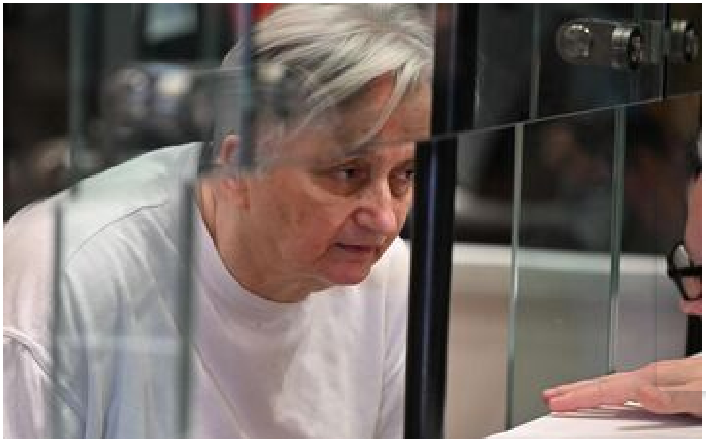
Affaires Fourniret : lors de son procès, Monique Olivier dit « regretter tout ce qu'il s'est passé »