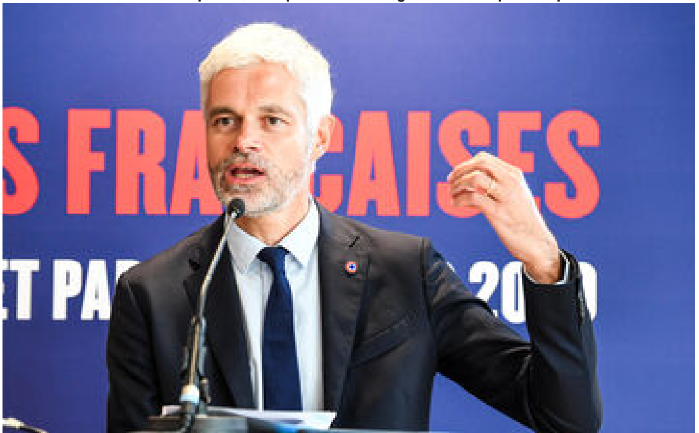
Soupçons d'« emplois fantômes » de proches de Wauquiez : des perquisitions ont lieu lundi