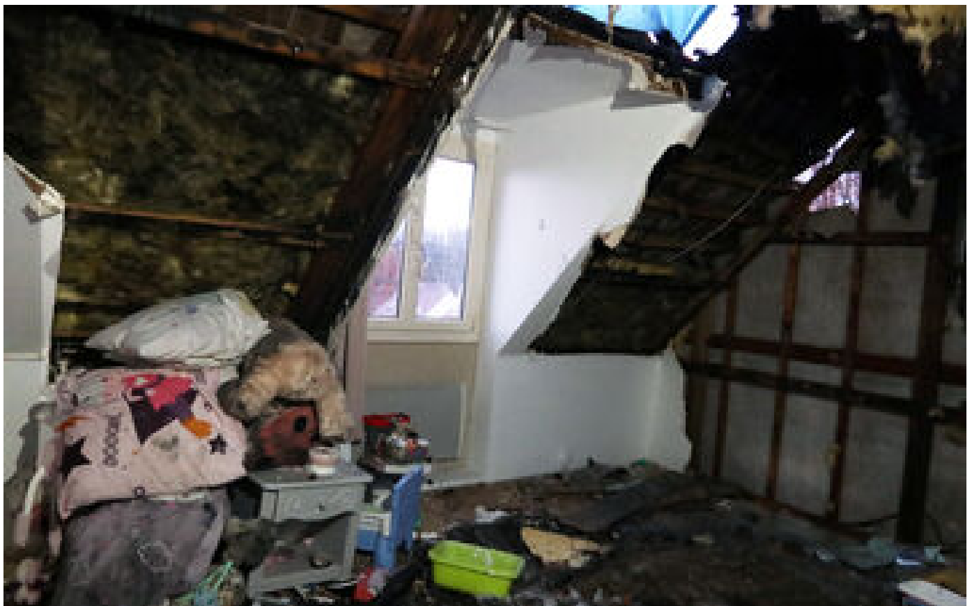
« J'ai pris les enfants et je suis sorti » : le poignant récit d'un père après l'incendie de sa maison dans l'Oise P