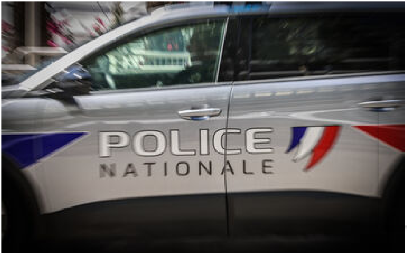
Landes : découverte d'un fœtus et d'un embryon humain dans une déchetterie