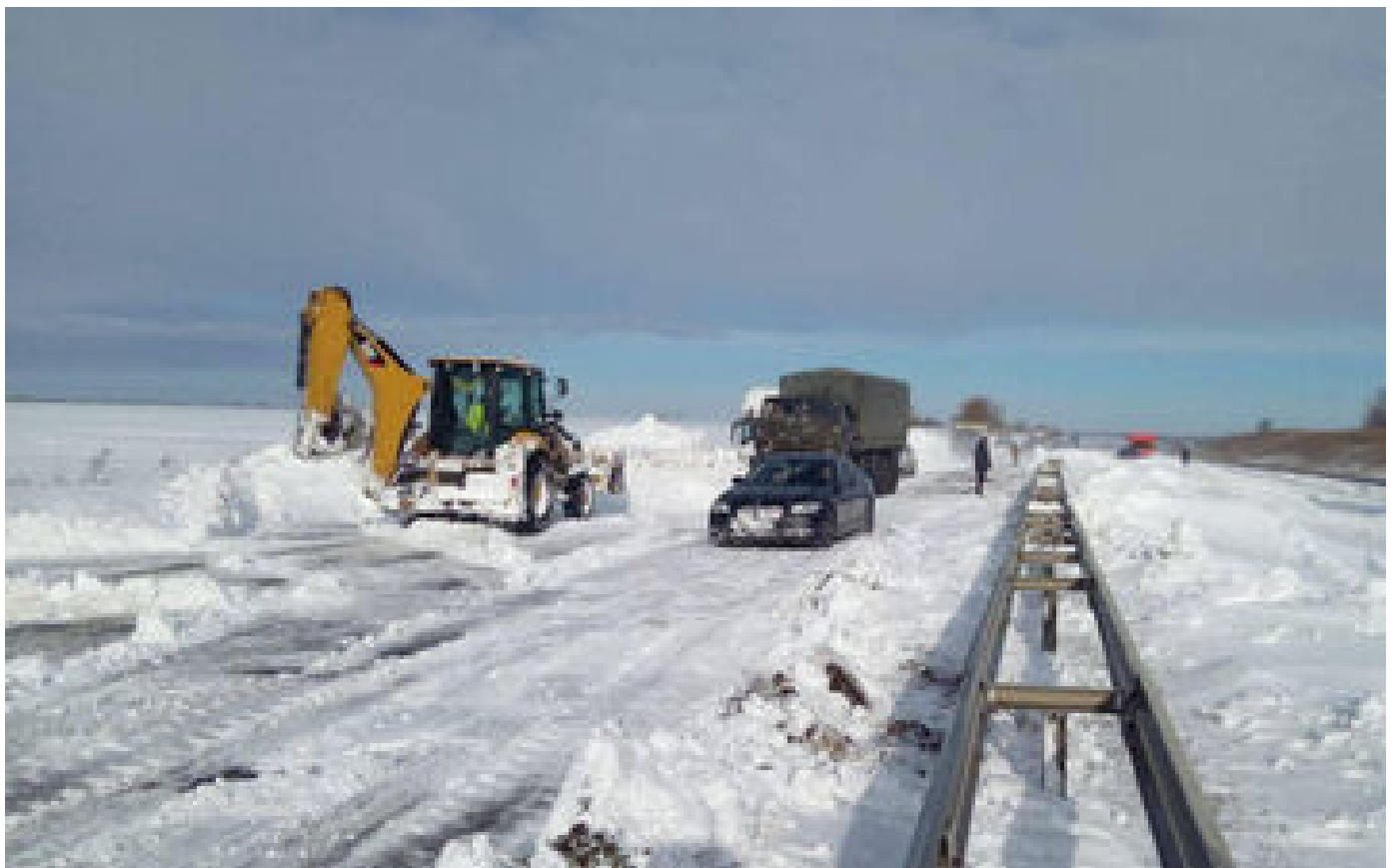
La « méga-tempête » qui touche l'Ukraine a fait dix morts