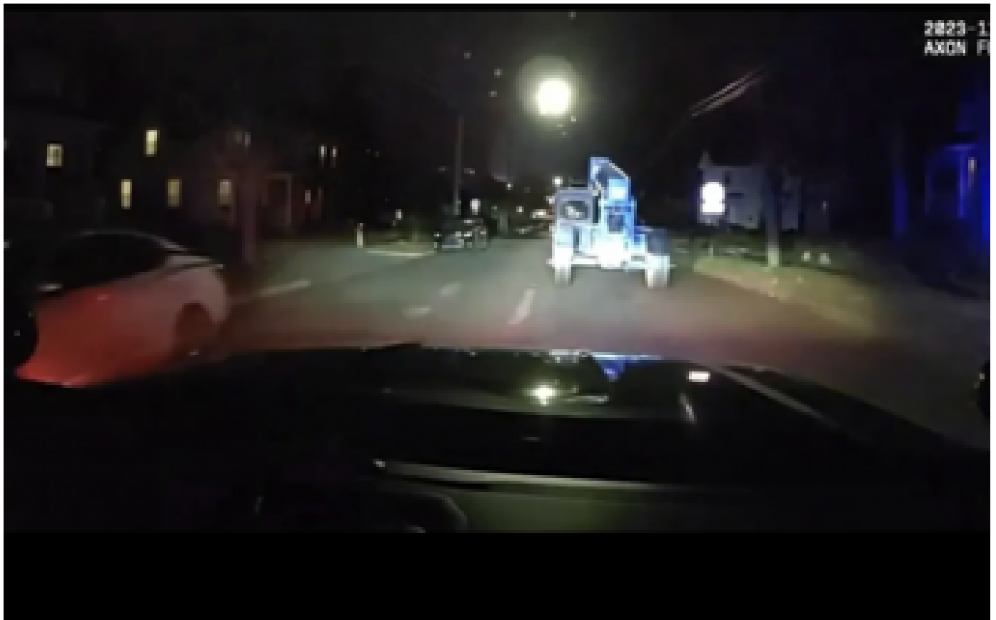
États-Unis : un enfant vole un engin de chantier et échappe à la police dans une course-poursuite improbable