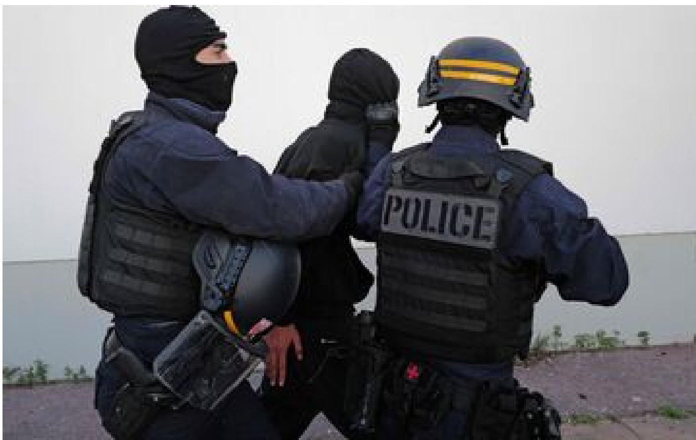
Mort par balle perdue à Dijon : quatre personnes interpellées, les tireurs toujours en fuite