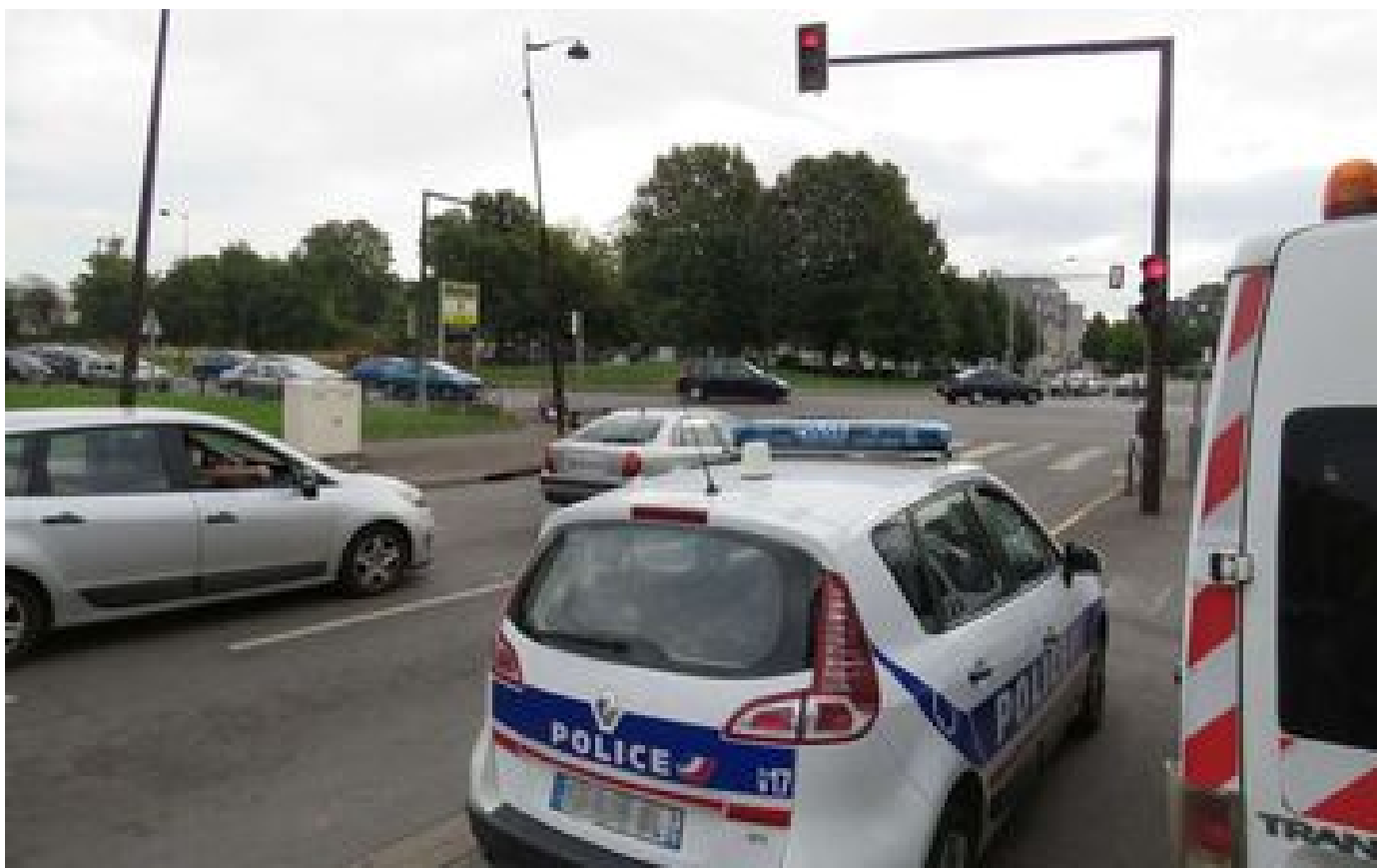
Essonne : deux adolescents interpellés après avoir tenté de braquer un homme à scooter à Viry-Chatillon