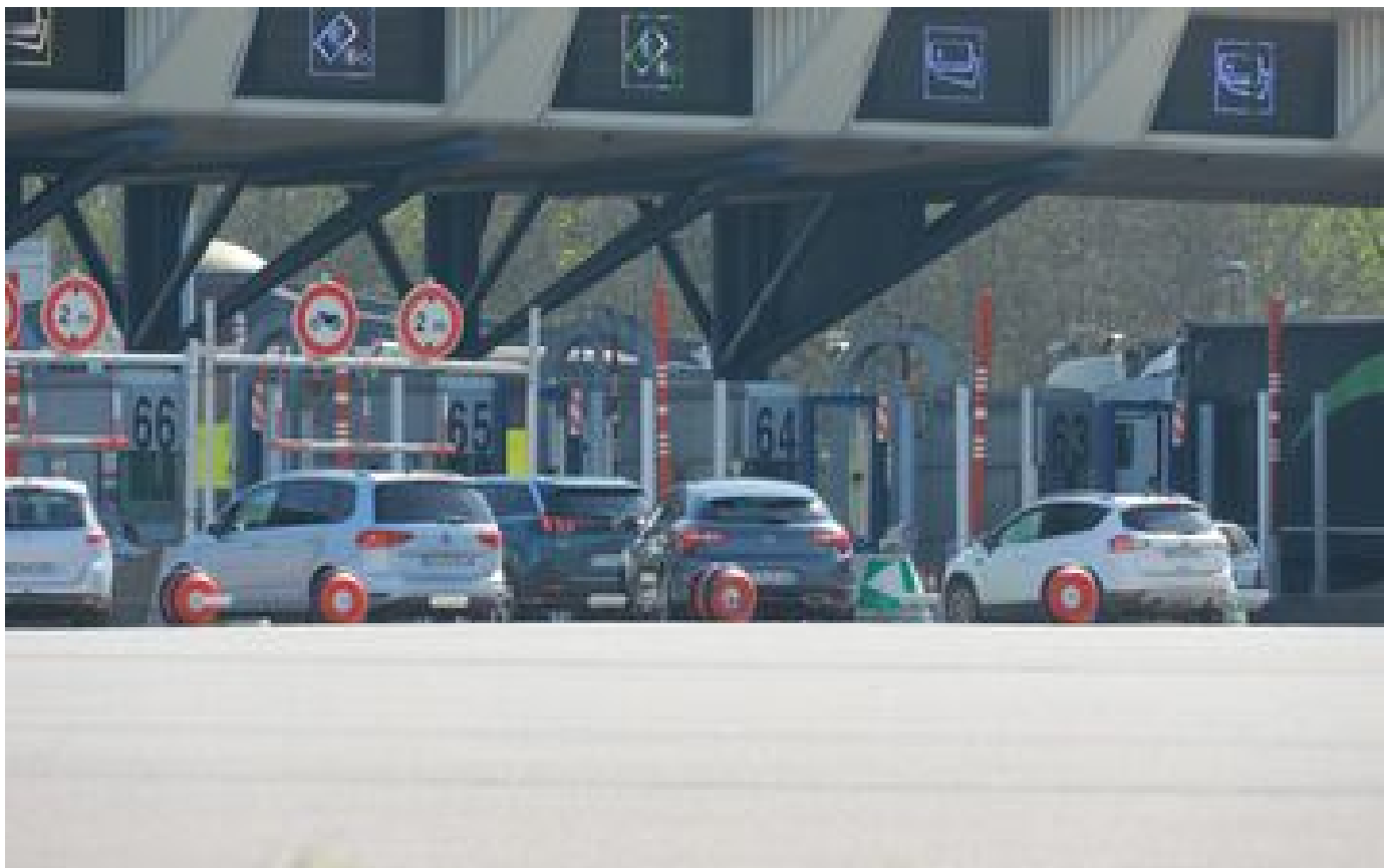
Autoroute A13 : à 180 km/h, il boit, fume et... oublie son permis