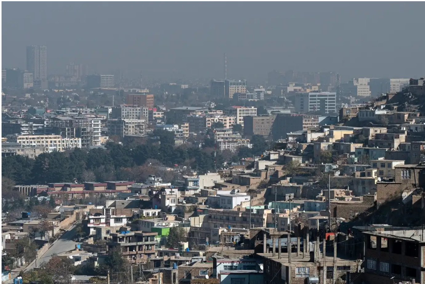
Kaboul sous le règne taliban : Plus sûre et plus sombre