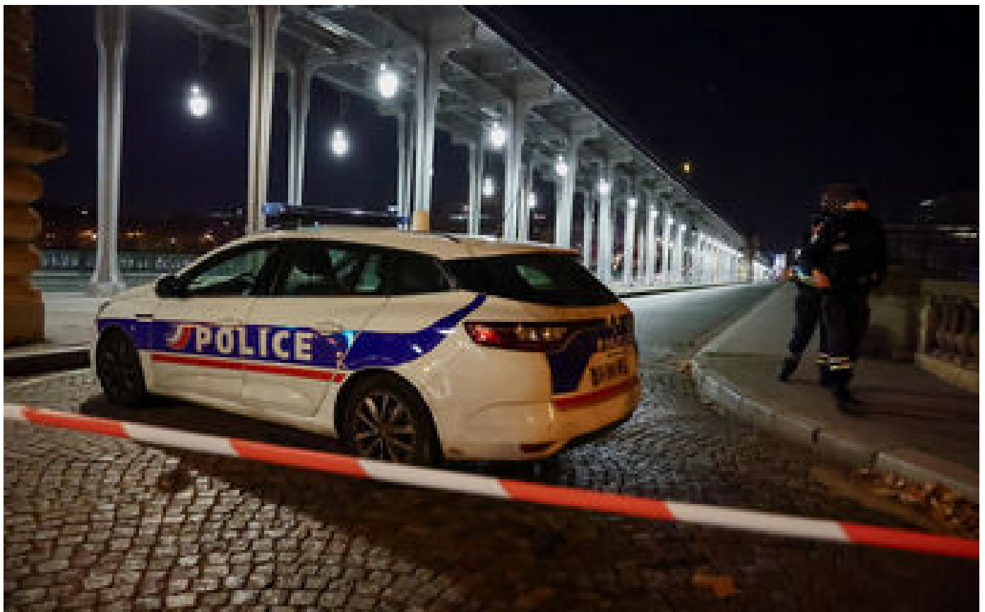
DIRECT. Attaque à Paris : les deux blessés sont « en bonne santé », selon le miniprout de la Santé