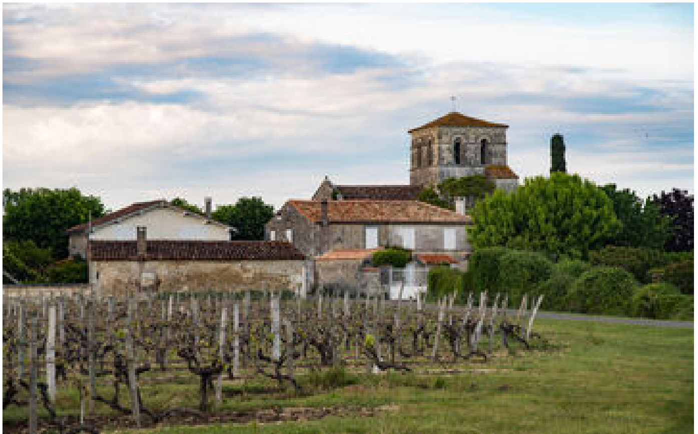
Un corbeau s'en prend au milieu de la viticulture dans le Cognac