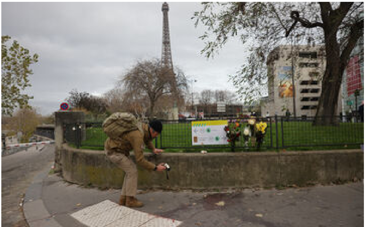
Attentat de Paris : enquête judiciaire ouverte en Allemagne