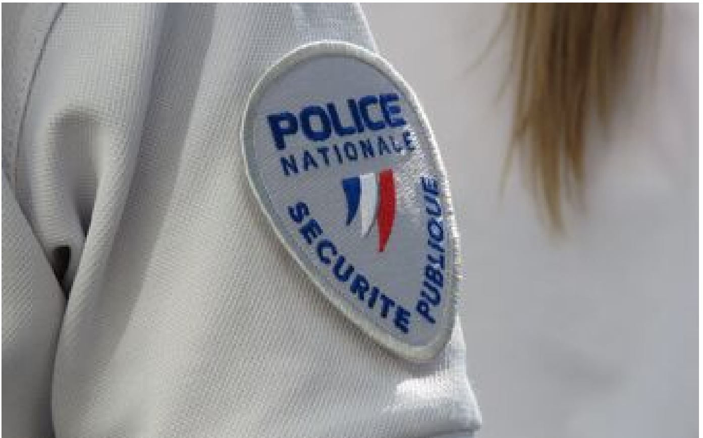
Plaignante insultée par un policier : le parquet ne demande pas de peine