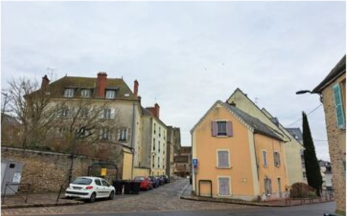
Essonne : une femme ligotée, frappée et séquestrée chez elle à Étampes