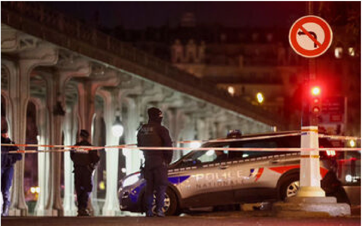
Attentat à Paris : l'assaillant « assume et revendique totalement son geste » en garde à vue