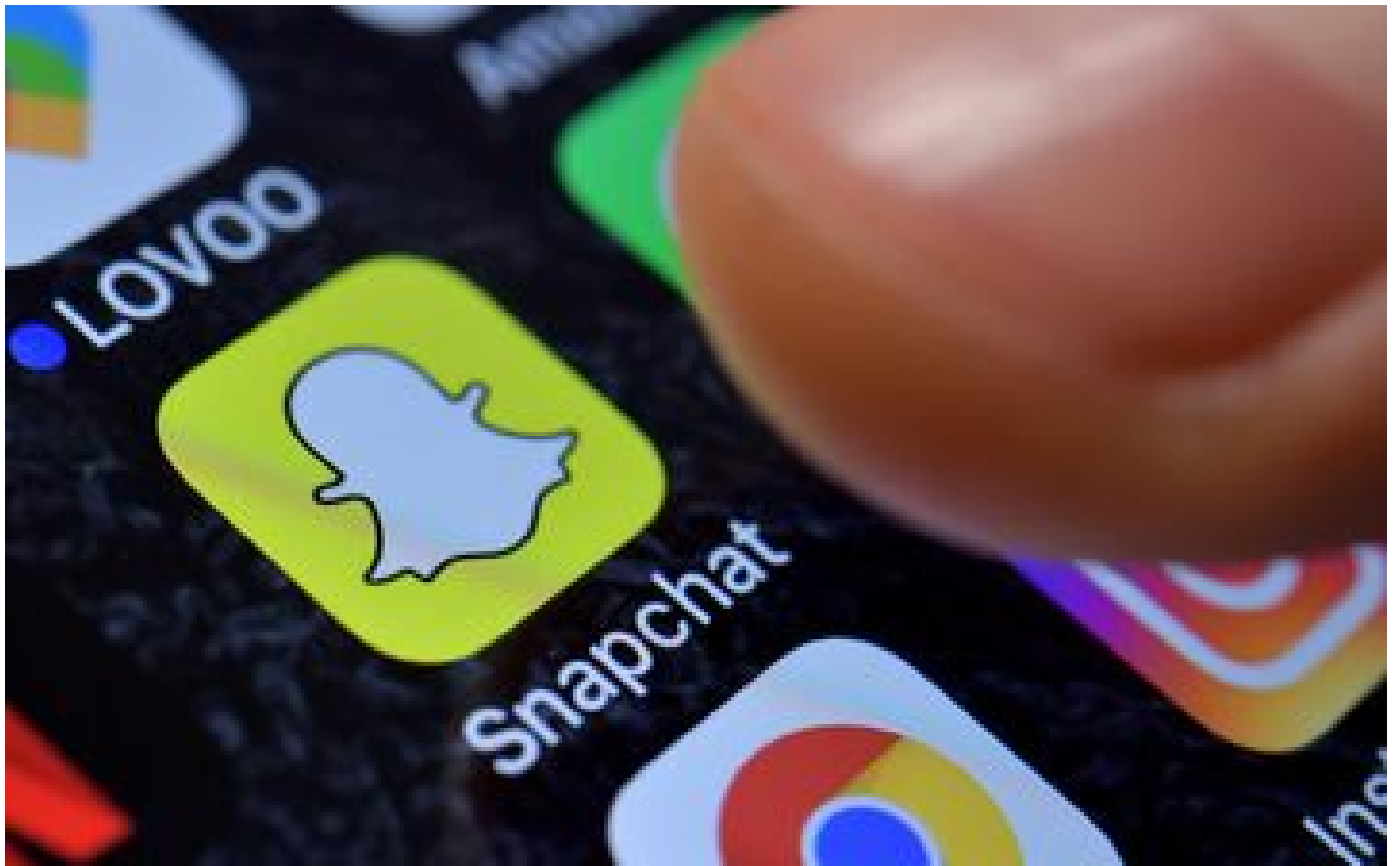
Condamnés pour avoir enlevé, séquestré et roué de coups un homme avant de l'abandonner nu en forêt de Gagny P