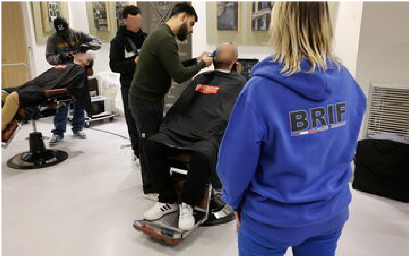
Lutte contre le cancer : à Paris, les policiers du 36 se font tailler la moustache pour le « Movember »