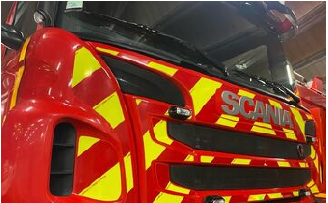
Montpellier : deux hommes décèdent dans l'incendie de leur appartement