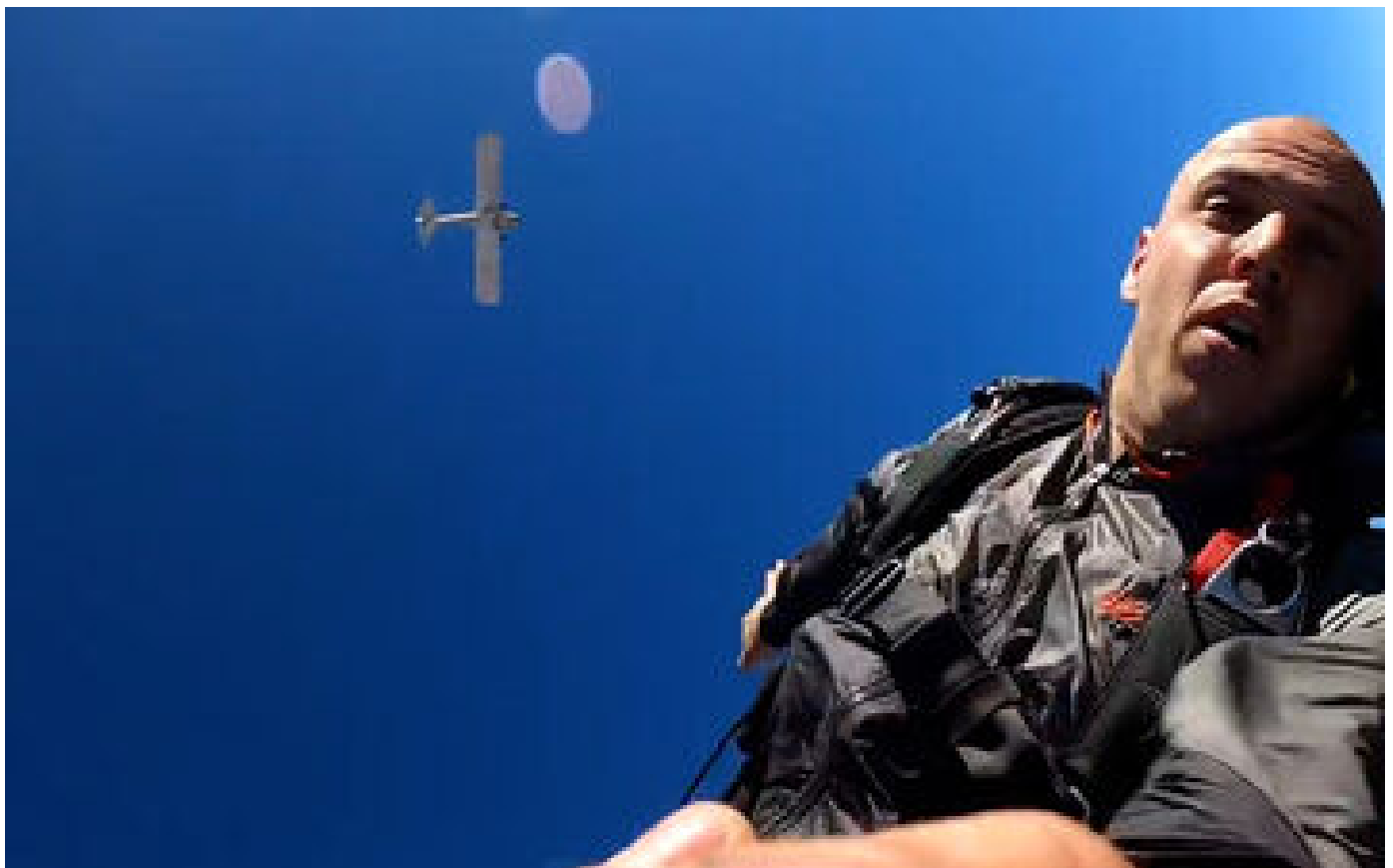
Six mois de prison pour un youtubeur qui avait mis en scène le crash de son avion