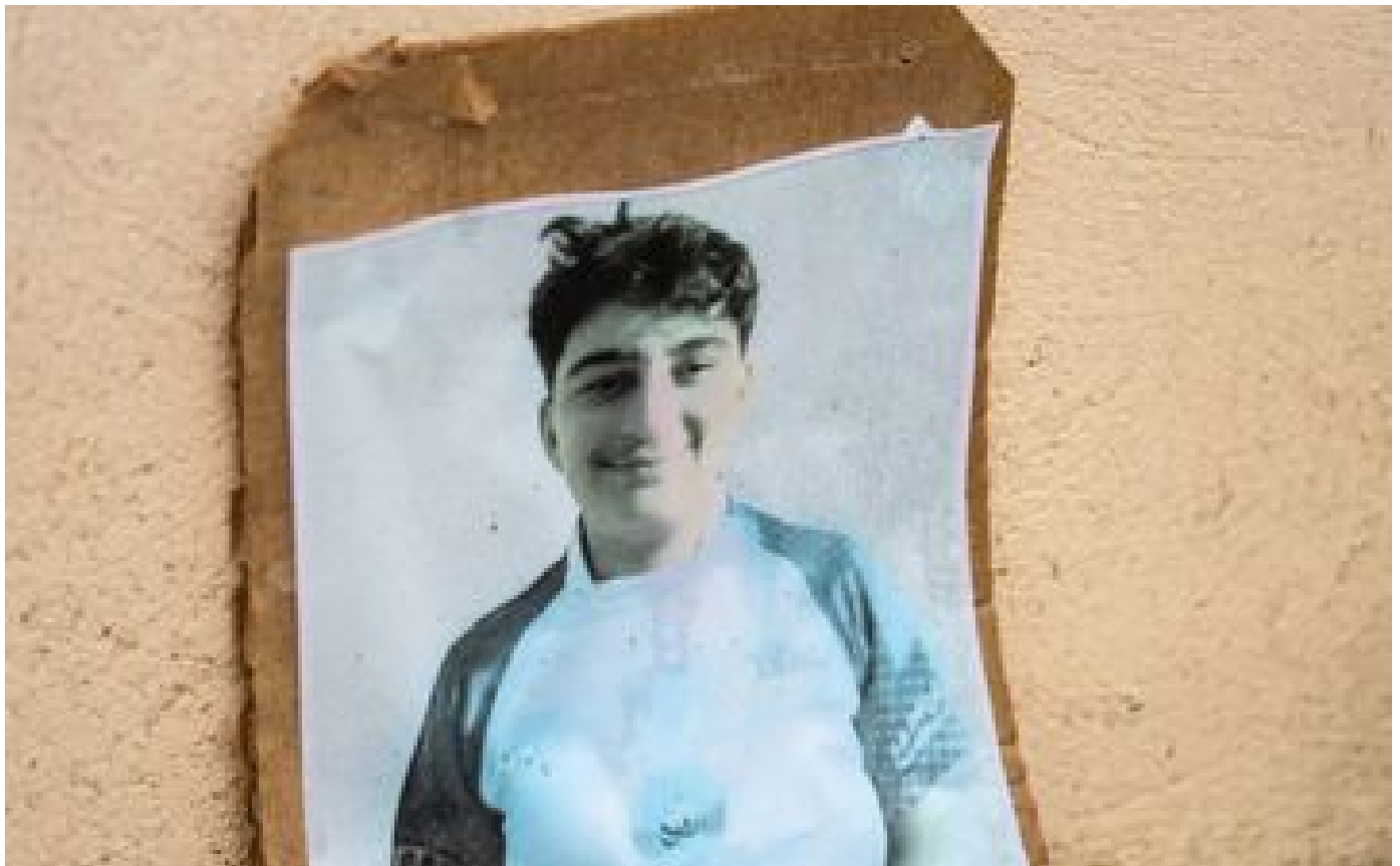
Enquête à Crépol, mère du terroriste de Bir-Hakeim, chute du niveau des élèves... les infos à retenir ce midi