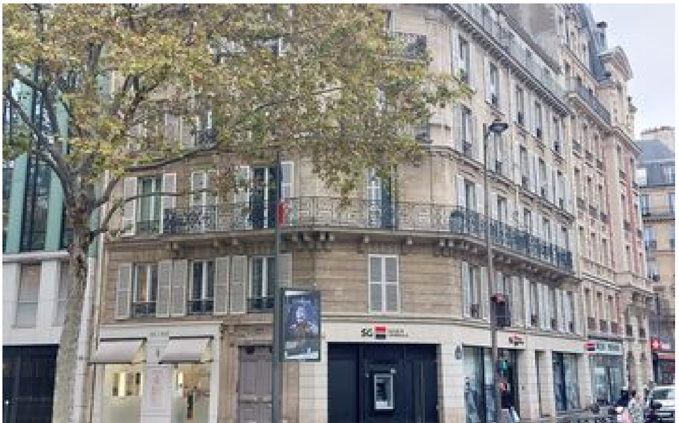
Amour, infidélité et train de vie : les paradoxes de l'entrepreneur accusé d'avoir tué sa belle-mère P