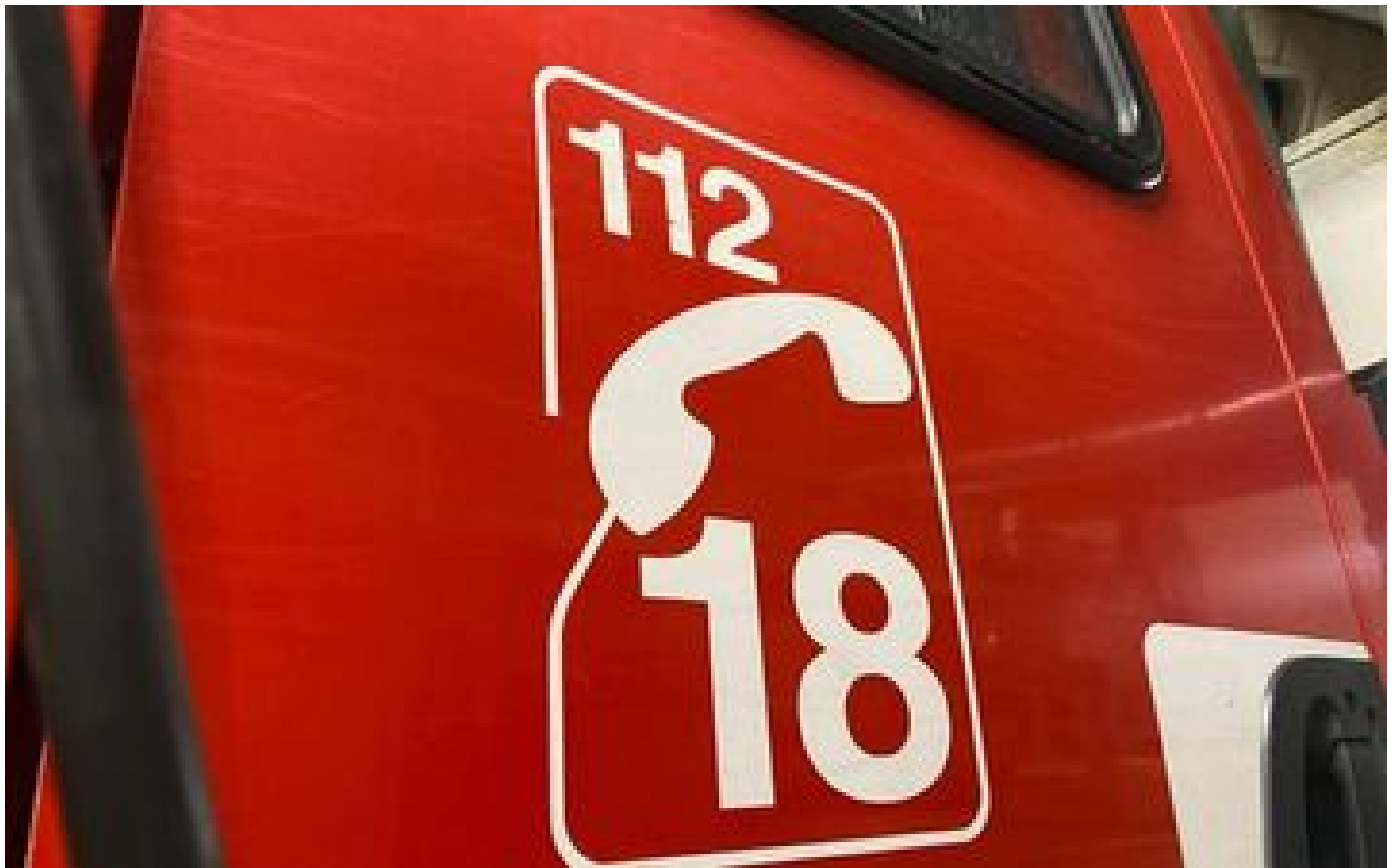
Pas-de-Calais : un mort et 14 blessés dont un grave dans un incendie d'appartement