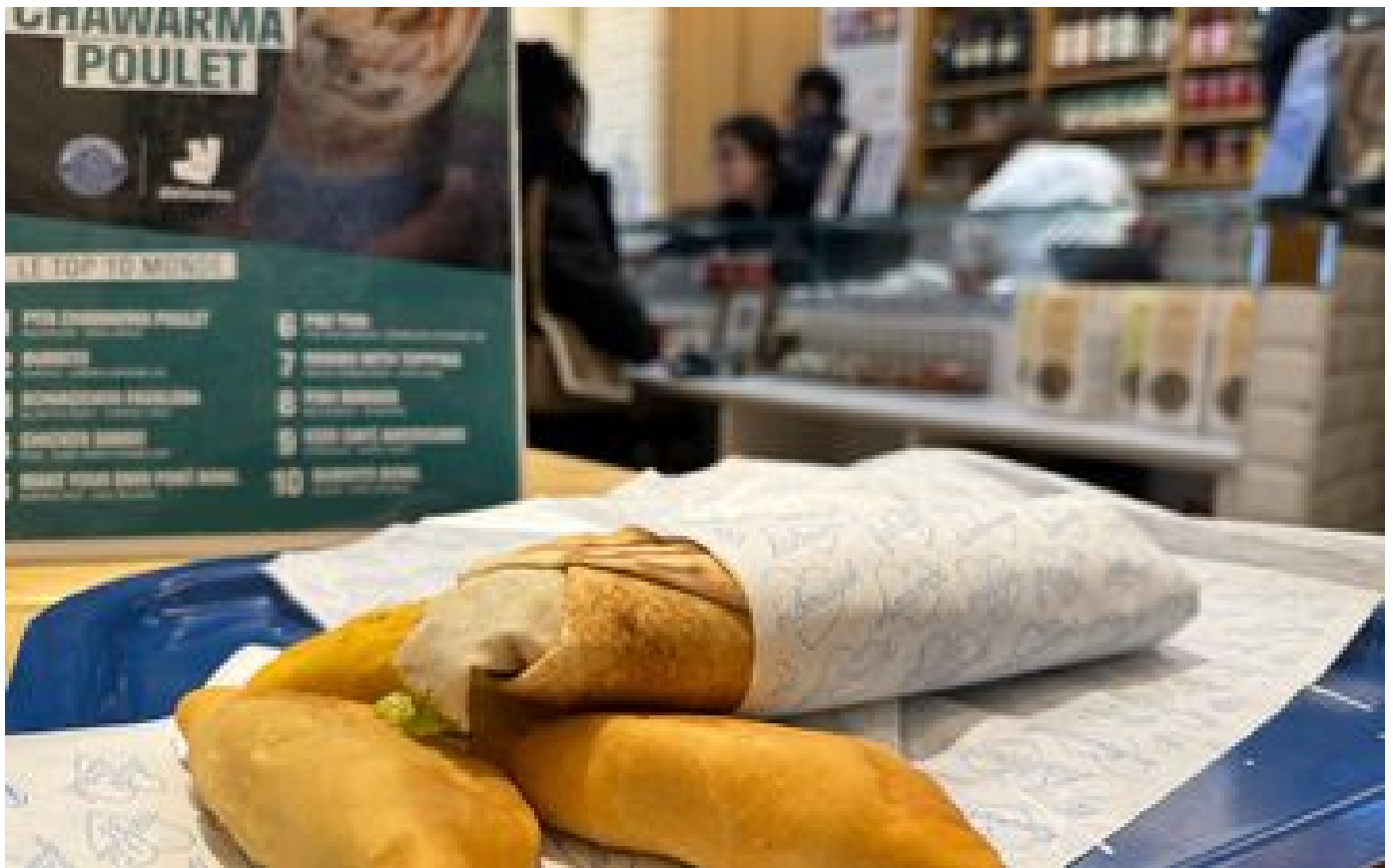
« Le poulet mariné, j'adore » : on s'est fait livrer l'un des restos préférés des Parisiens sur Deliveroo P