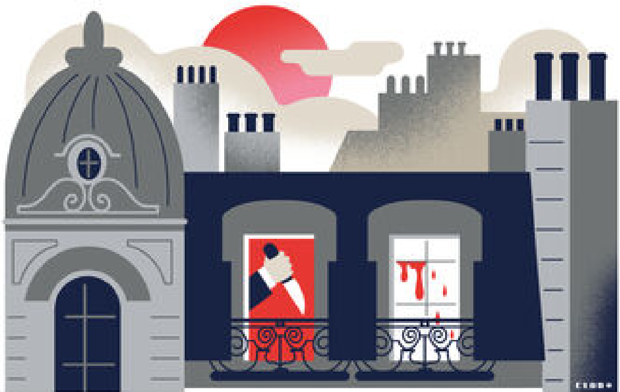
Paris : jugé pour avoir tué sa riche belle-mère en laissant son beau-frère schizophrène au cœur des soupçons P