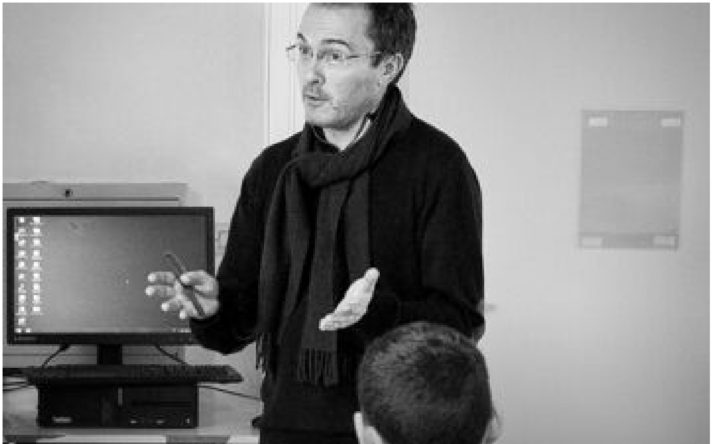
Parce qu'il s'appelle Paty, un professeur menacé de mort par un lycéen en Charente