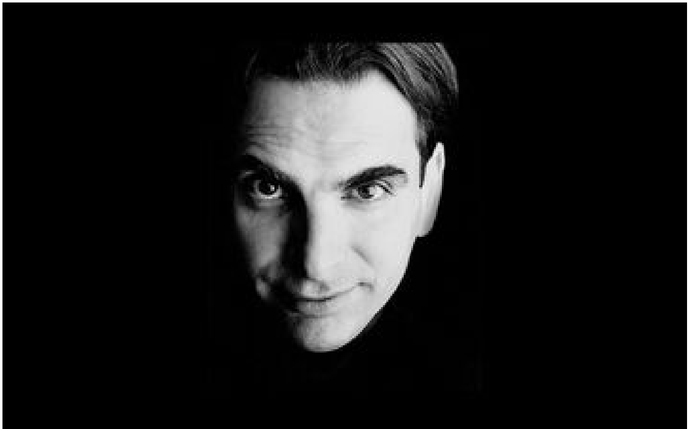
Meurtres aux Caraïbes : le couple de Québécois a-t-il été tué par un tueur à gages embauché par leurs voisins ?