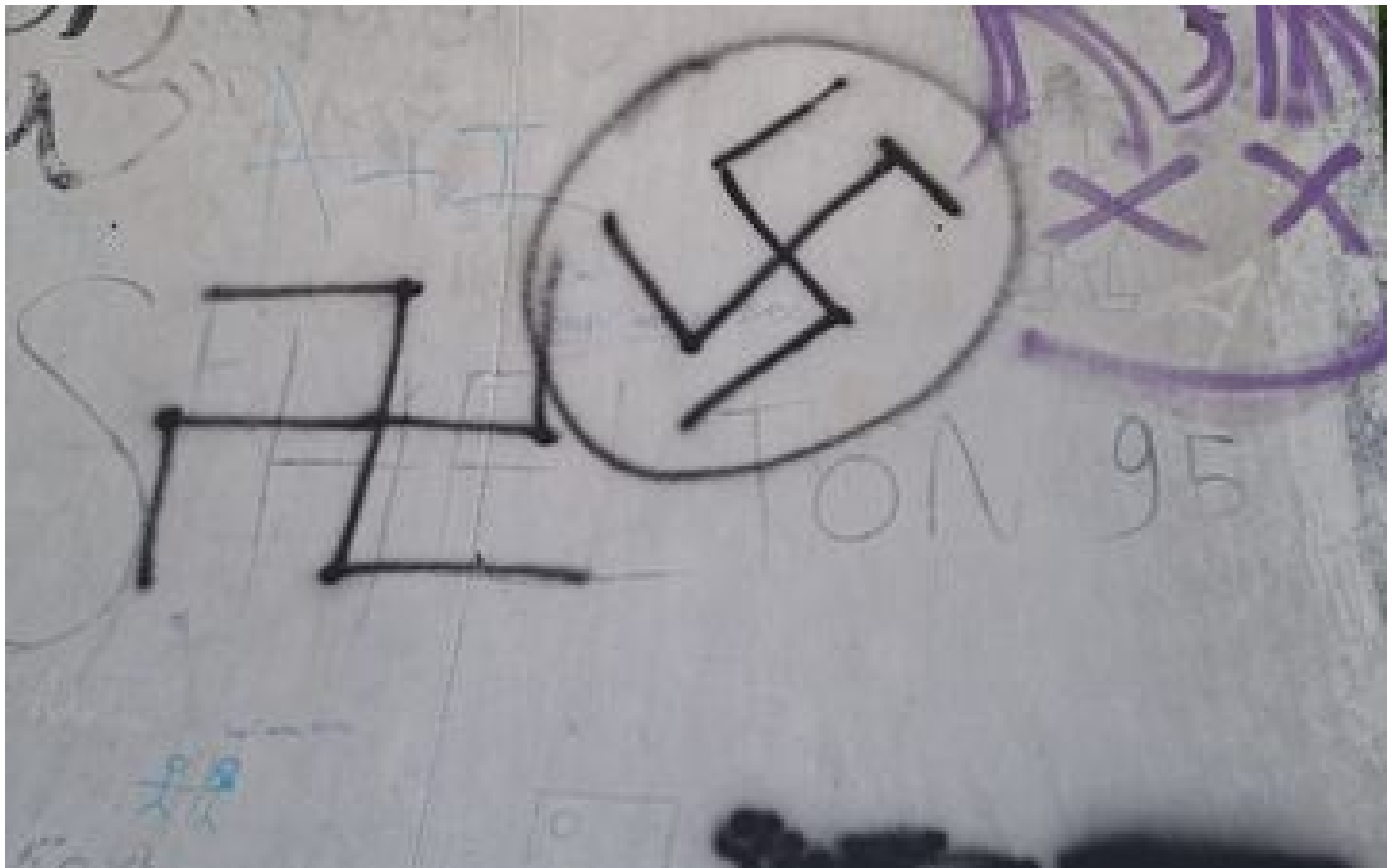
Croix gammées taguées à Paris : deux personnes mises en examen