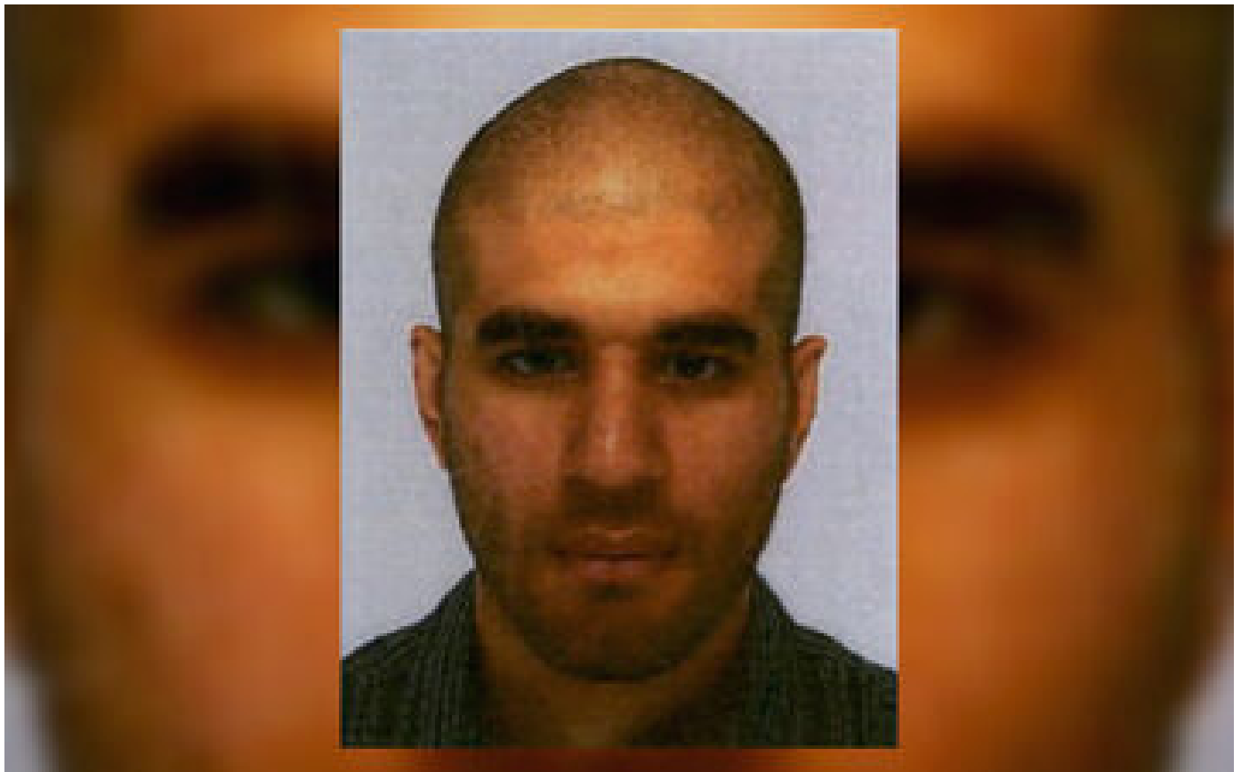
Attentat à Paris : « Je n'ai plus de fils, je demande pardon à la France », pleure la mère du terroriste P