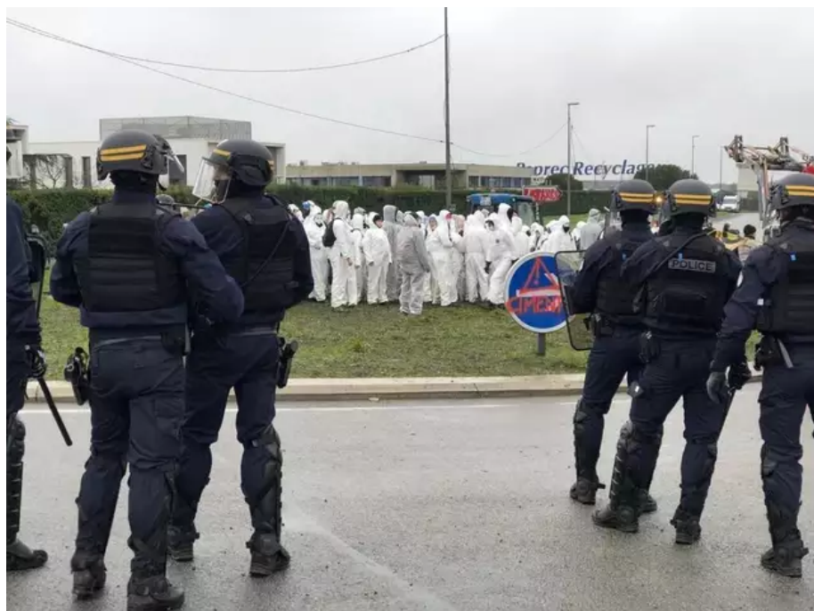
Les Soulèvements de la terre mènent une action anti Lafarge et contre le béton

« La police était déjà sur place à notre arrivée », s'étonne Camille des Soulèvements de la Terre. « Des camarades sont en ce moment même « nassés » sur le rond-point Robert-Schuman ». Selon Camille, « plusieurs personnes auraient été interpellées ».