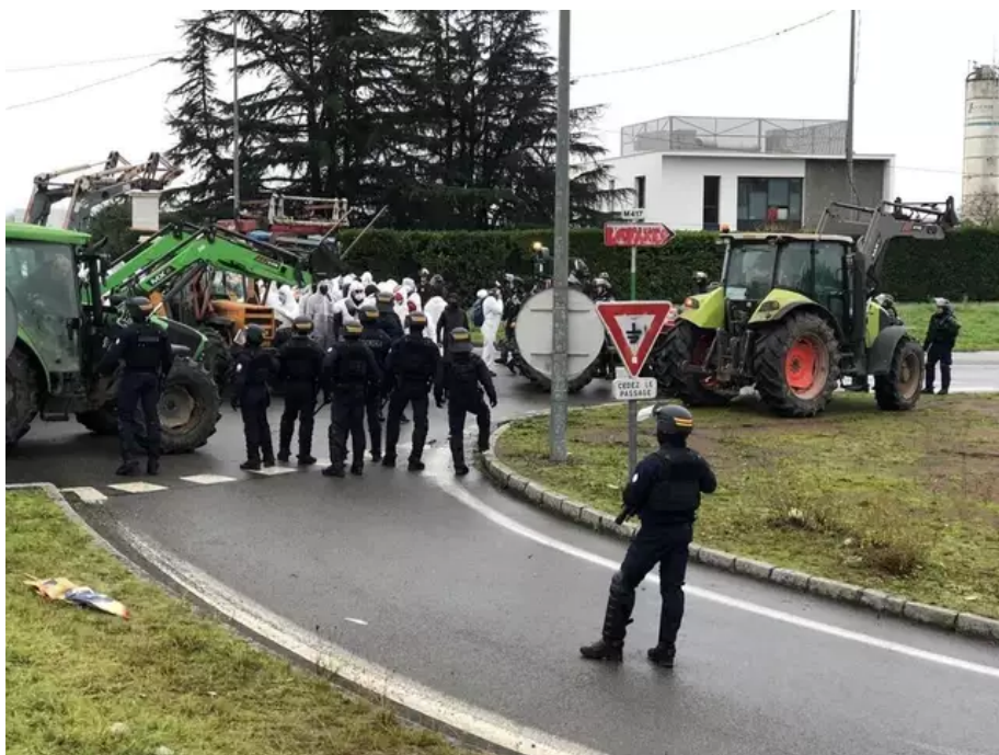
Les Soulèvements de la terre mènent une action anti Lafarge et contre le béton

« Dans le cadre des « journées d'action pour Lafarge et le monde du béton », 120 personnes et six tracteurs bloquent le site de Janvraie » ce lundi matin 11 décembre 2023 à Nantes.