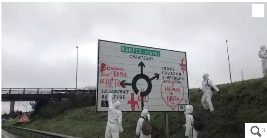
Les Soulèvements de la terre mènent une action contre l'usine du groupe Lafarge-Holcim à Nantes

Ce lundi 11 décembre 2023 à Nantes, Les Soulèvements de la Terre mènent une action sur un des sites de l'usine Lafarge en Loire-Atlantique en bloquant ses accès.