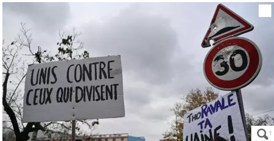
Une manifestation organisée le 2 décembre 2023 dans le quartier de la Monnaie, à Romans-sur-Isère, après la mort du jeune Thomas à Crépol dans la nuit du 18 au 19 novembre.

La préfecture de Loire-Atlantique a annoncé l'interdiction de deux manifestations prévues mercredi 13 décembre, à Nantes, en réaction au décès de Thomas Perotto, à Crépol, dans la Drôme, le 19 novembre. Les organisateurs de l'une d'entre elles, un collectif d'organisations syndicales, réagissent.