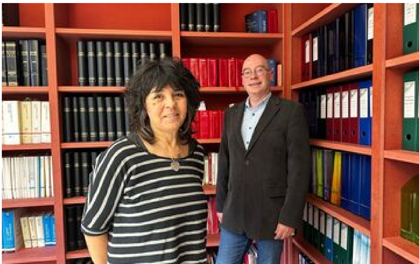
Elle arrive à mettre fin aux locations de courte durée dans sa résidence de Saint-Malo P