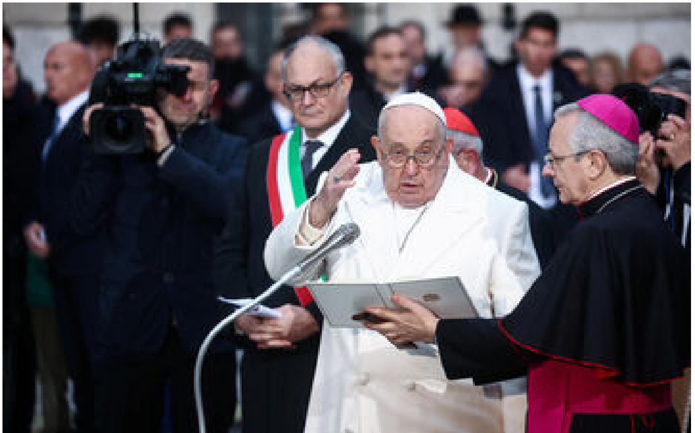
Rome : rétabli d'une bronchite, le pape s'offre un bain de foule lors d'une cérémonie