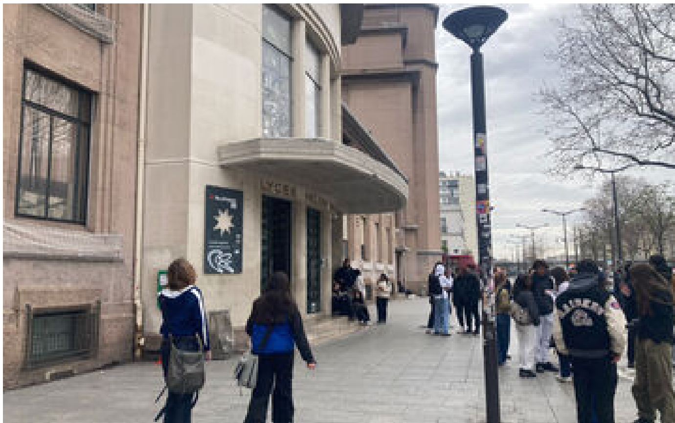
Journée de la laïcité : pour ces lycéens, la religion, c'est sur les réseaux sociaux que ça se passe P