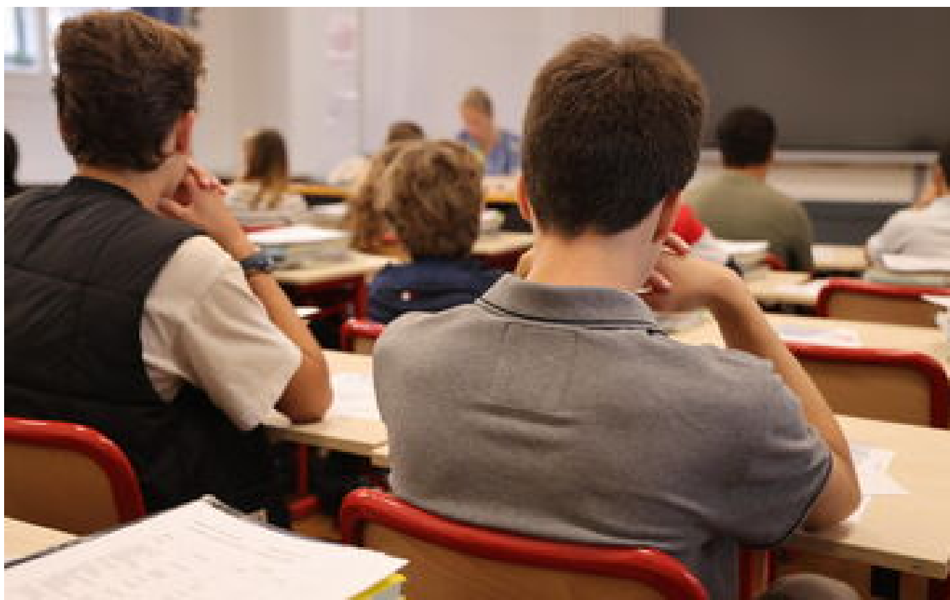
Cérémonie de Hanouka à l'Élysée : « Une maladresse extrême » pour ces professeurs d'histoire-géographie P