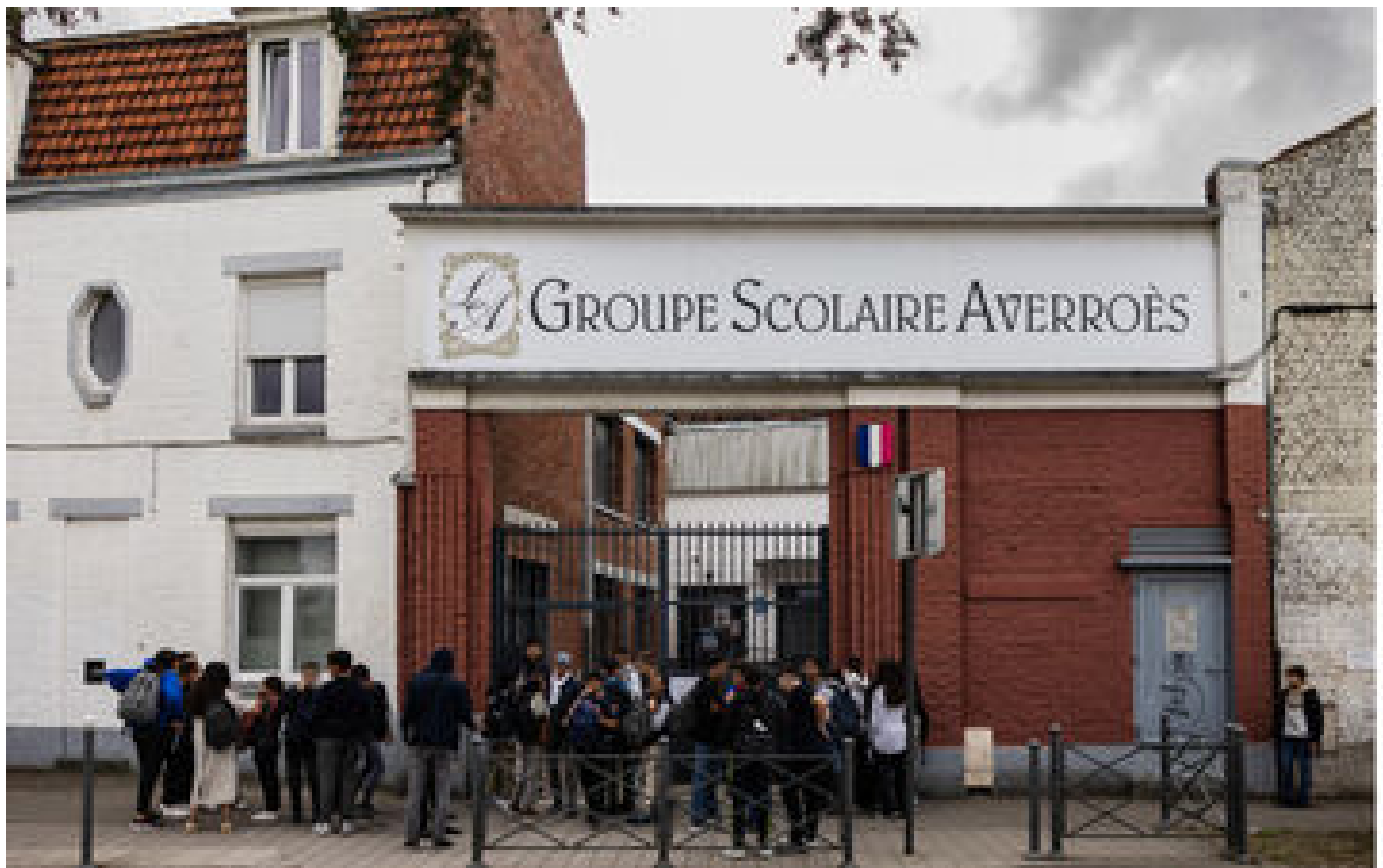
Info Le Parisien Le lycée musulman Averroès, à Lille, ne sera plus sous contrat avec l'État