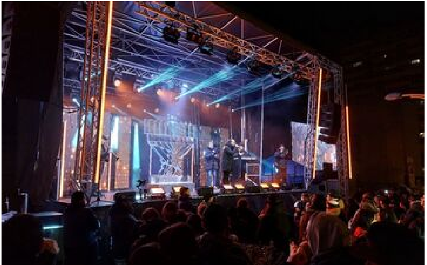
Sarcelles : la communauté juive profite d'une parenthèse joyeuse à l'occasion de Hanouka P